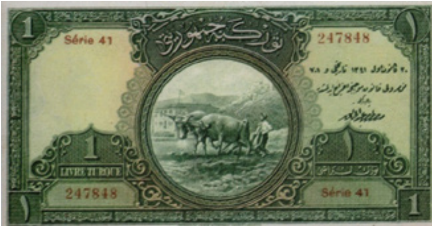
Şekil 6: 1 Liranın Ön Yüzü (1. Emisyon)

Tasarımın Çözülmesi (Arka Yüz): Banknotun arka yüzü yeşilin tonlarıyla tasarlanarak giyoş motifinin (fraktal) oluşturduğu kıvrımlı bir bordürle sınırlandırılmıştır. Banknotun ortasında gravür tekniğiyle "Maliye Bakanlığı Binası" resimlendirilmiştir. Gravürün sağ ve sol alt köşesinde Fransızca ve Arapça yazılarla "1" kupürüne ve "Türk lirası" ibaresine yer verilmiştir. Bu ibare ve kupürlerin etrafı rumi motifleriyle çevrelenmiş ve yine başka rumi motifleriyle birbirine geçerek tasarım oluşturulmuştur. Gravürün etrafı da aynı zamanda birbirine geçmiş geometrik desenlerle sınırlandırılmıştır. Banknotun sol tarafında oval bir form içerisinde mühüre benzeyen ortadan etrafa doğru dağılan rumi tasarımı bulunmaktadır. Gravürün üstünde de yeşil zemin üzerine altın sarısı renkle Arapça "sülüs" yazısı ile "Türkiye Cumhuriyeti" yazısına yer verilmiştir. Gravür etrafındaki geometrik birbirine geçmiş desen bu ibarenin etrafına kadar uzanmıştır. Banknotun sağ tarafında M. Kemal Atatürk'ün portresinin filigranı kullanılmıştır (Şekil 7).