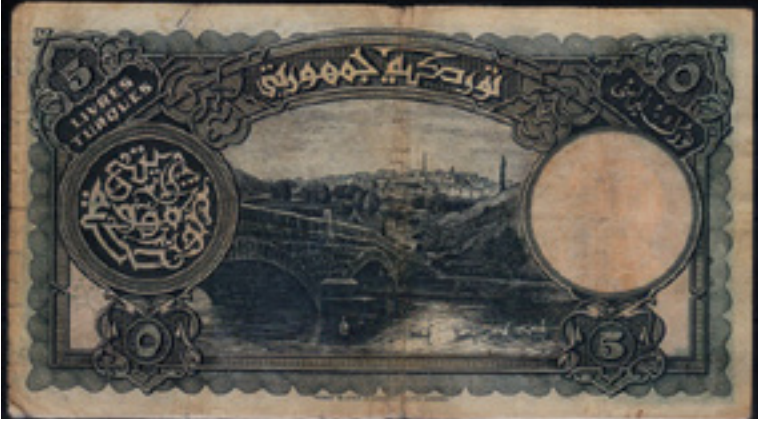
Şekil 9: 5 (Beş) Liranın Arka Yüzü (1. Emisyon)

ibaresi bulunmaktadır. Bu formun etrafı birbirine geçmiş rumilerle süslenip alt kısmından güneş ışınlarına benzeyen çizgiler çıkarılmıştır. Banknotun sağ tarafındaki oval form içerisinde kahverengi tonlarla Mustafa Kemal Atatürk'ün gravürüne yer verilmiştir. Açık renk kontörle sınırlandırılan bu oval formun etrafı aynı zamanda kare form içerisinde birbirinin aralarından geçen rumi motifleriyle süslenmiştir. Aynı kare ve oval form banknotun diğer tarafında da simetrik bir şekilde görülmektedir. Sol taraftaki bu yuvarlak formun içinde M. Kemal Atatürk'ün filigranı kullanılıp düğümlü zencerekle sınırlandırılmıştır. Yuvarlak formların üst kısımlarında ve köşelerinde "50" rakamı ve "Türk lirası" ibaresi Arapça ve Fransızca olarak bulunmaktadır. Banknotun birimi ve Türk lirası ibareleri taç form içerisinde küçük çiçek bezemeleleriyle birlikte tasarlanarak, dış kısmı koyu zeminli rumi motifleriyle süslenmiştir. Seri numaralarının belirtildiği yerlerde zemin olarak minyatürde genelde kilim ve duvarlarda kullanılan küçük geometrik desenler yer almaktadır. Banknotu sınırlamak için koyu kahverengi zemin üzerinde rumili bordür kullanılmaktadır. Bu rumilerin üç hat üzerinde dolanması da üç iplik rumi olduğunu göstermektedir.