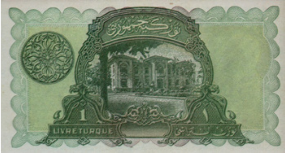
Şekil 7: 1 Liranın Arka Yüzü (1. Emisyon)

En üst kısımda büyük bir dikdörtgen levha içinde siyah zemin üzerine altın rengiyle Arapça "sülüs" yazısıyla "Türkiye Cumhuriyeti" yazmaktadır. Levhanın yan taraflarında bordür içerisinde Türk Lirası ibaresi Arapça ve Fransızca yazılarak köşe kısımlarında 5 TL (kupür) belirtilmiştir.