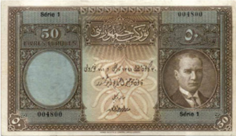
Şekil 10: 50 (Elli) Liranın Ön Yüzü (1. Emisyon)

ibaresi bulunmaktadır. Bu formun etrafı birbirine geçmiş rumilerle süslenip alt kısmından güneş ışınlarına benzeyen çizgiler çıkarılmıştır. Banknotun sağ tarafındaki oval form içerisinde kahverengi tonlarla Mustafa Kemal Atatürk'ün gravürüne yer verilmiştir. Açık renk kontörle sınırlandırılan bu oval formun etrafı aynı zamanda kare form içerisinde birbirinin aralarından geçen rumi motifleriyle süslenmiştir. Aynı kare ve oval form banknotun diğer tarafında da simetrik bir şekilde görülmektedir. Sol taraftaki bu yuvarlak formun içinde M. Kemal Atatürk'ün filigranı kullanılıp düğümlü zencerekle sınırlandırılmıştır. Yuvarlak formların üst kısımlarında ve köşelerinde "50" rakamı ve "Türk lirası" ibaresi Arapça ve Fransızca olarak bulunmaktadır. Banknotun birimi ve Türk lirası ibareleri taç form içerisinde küçük çiçek bezemeleleriyle birlikte tasarlanarak, dış kısmı koyu zeminli rumi motifleriyle süslenmiştir. Seri numaralarının belirtildiği yerlerde zemin olarak minyatürde genelde kilim ve duvarlarda kullanılan küçük geometrik desenler yer almaktadır. Banknotu sınırlamak için koyu kahverengi zemin üzerinde rumili bordür kullanılmaktadır. Bu rumilerin üç hat üzerinde dolanması da üç iplik rumi olduğunu göstermektedir.