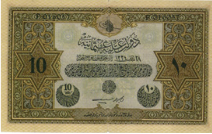
Şekil 4: VI. Mehmed Vahdettin 10 Liranın ön yüzü

1. Emisyon grubunun ilk parası olup yatay bir şekilde 90x166 mm. boyutlarında tasarlanmıştır (Ölçer, 1983, s.39).