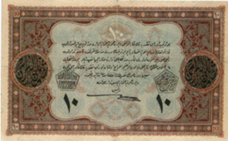
Şekil 5: VI. Mehmed Vahdettin 10 Liranın arka yüzü

Tasarımın Çözülmesi (Paranın Ön Yüzü): 1 liralık banknotun ortasında çift-çinin ve meclis binasının bulunduğu yuvarlak form bulunmaktadır. Bu görsel düzenleme Atatürk'ün "Köylü milletin efendisidir" sözüyle uyum içindedir. "Türkiye'nin hakiki sahibi, hakiki müstahsil olan köylüdür. O halde herkesten daha çok refah, saadet ve servete müstahak ve layık olan, köylüdür. TBMM hükümetinin iktisadi siyaseti, bu asli gayeyi istihsal etmeye matuftur." Ön yüzünde de eski başbakanlık binası vardır. Genç Türkiye Cumhuriyeti meşruluğunu sağlama çabasıdır. Hem kendisini hatırlatır hem de köylünün (halkın) yanında, köylüden yana olduğunu vurgulama çabası içinde gibidir (Peşken, 2004). Yuvarlak form içerisindeki bu gravür, desenli cetvel tarzı süsleme çeşidi olan kuzu zencerek ile sınırlandırılmaktadır. Yuvarlak formun üstünde bulunan yarım oval formun içinde koyu zemin üzerinde açık renk tonlar ile Arap alfabesi ile "Türkiye Cumhuriyeti" ibaresi yazmaktadır. Bu yazının etrafında küçük Rumiler birleştirilerek hurdalı rumi motifi oluşturulmuştur.