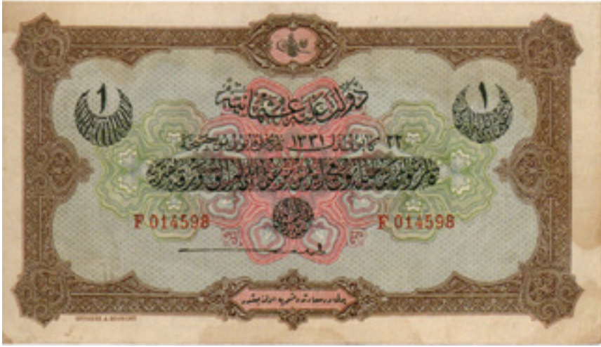
Şekil 2: Mehmed Reşat Dönemi 1 Liranın ön yüzü

Tasarım Çözümlemesi (Arka Yüz): Paranın arka kısmında kırmızı ve yeşil tonlar hâkimdir. Ortasında “Rik’a” yazısıyla “İş bu varaka-i nakdiyenin karşılığı Divan-ı Umumiye-i Osmaniye idaresine tev’di edilmiş Olup sulhun akdinden bir sene sonra istanbul’da hisse ibrazında Osmanlı lirası Olarak mezkur karşılığın hasıla-i te’diyesine tahsisi idare-i muşarun ileyha taahhüd eyler. Divan-ı umumiye-i Osmaniye meclis idaresi namına” yazmaktadır. Köşelerdeki tasarım Selçuklu Döneminin simgesini temsil eden sekizgen yıldızlar bulunmaktadır. Bu sekizgen simgeler içerisinde “Çintemani” ve “Münhani” motifleri bulunmaktadır (Şekil 3).