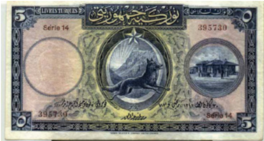
Şekil 8: 5 (Beş) Liranın Ön Yüzü (1. Emisyon)

içerisinde kufi yazıyla tekrar “Türkiye Cumhuriyeti” yazmaktadır. Kupür ile kufi yazı arasında kalan bölümde koyu mavi fonla Arapça ve Fransızca ile “Türk Lirası” yazılı levhalar yer alır. Ortada bulunan resim gravür tekniğiyle yapılmış Ankara köprüsüdür. Ankara resimlerinin bu yoğun kullanımı bu kentin yeni Başkent oluşuna ya da başkent olarak seçimine bir gönderme olarak okunabilir. Hatırlanacağı gibi, o dönemde başkent olarak Ankara'nın tercih edilmesi kimi kesimlerce eleştirilmiş, İstanbul'un daha uygun olduğu görüşleri dile getirilmişti. Banknotlardaki Ankara tercihi ile hem bu kentin başkent olarak seçimine vurgu yapıldığı hem de bahsedilen eleştirilere bir yanıt verildiği söylenebilir (Peşken, 2004). Portrelere, sembollere ve mimari yapılara tasarımlarında yer veren Cumhuriyet dönemi banknotları, o dönemdeki gelişmeler hakkında önemli bilgiler vermektedir. Artık tezhip motifleri ve hat yazılarının kullanımı yanında portre ve resim kullanımı farklı bir döneme geçildiğinin de güçlü bir göstergesidir.