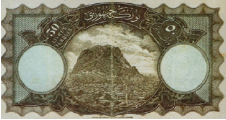
Şekil 11: 50 (Elli) Liranın Arka Yüzü (1. Emisyon)

Tasarımın Çözülmesi (Arka Yüz): Değeri 50 TL olan bu banknotun arka kısmının ortasında Afyonkarahisar'ın gravürüne yer verilmiştir. Banknot kavisli giyoş (fraktal) motifli bordür ile sınırlandırılmıştır. Sol ve sağ kısımlarda iki yuvarlak form açık renk kontörle belirtilmiştir. Sol taraftaki yuvarlak form içerisinde M. Kemal Atatürk'ün portesinin bulunduğu filigran yer almaktadır. Afyonkarahisar gravürünün üzerindeki koyu zeminli levhada "sülüs" yazı ile "Türkiye Cumhuriyeti" yazmaktadır. Bu levhanın etrafında birbirine dolanan rumi motifleri görülmektedir. Levhanın sağ ve sol kısmında banknotun "50" lira kupürünü ve "Türk Lirası" ibaresini belirten Fransızca, Arapça yazılar yer almaktadır.