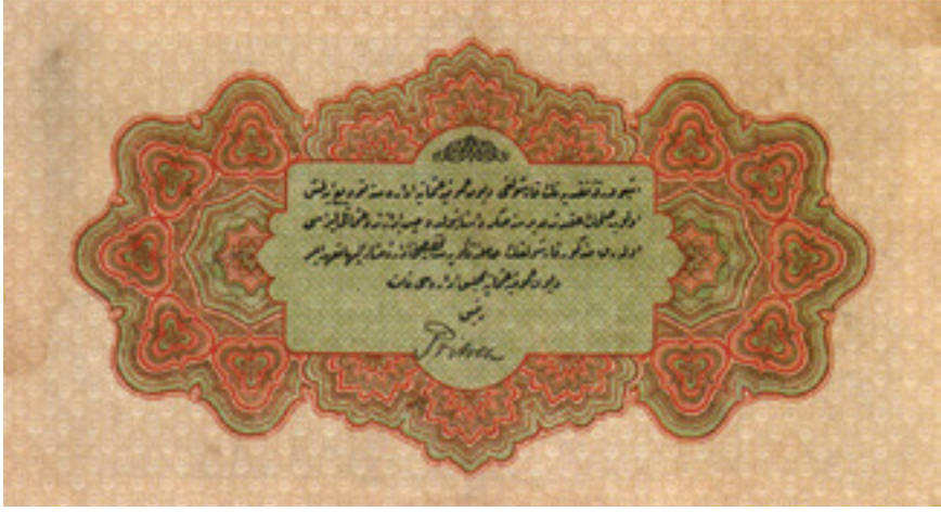
Şekil 3: Mehmed Reşat Dönemi 1 Liranın arka yüz

Kaimenin orta bölmesinde açık yeşil tonlarıyla motifler zemin oluşturulmaktadır, Bu zemin üzerinde en üst kısımda “celi sülüs” yazısıyla, “Devlet-i Aliyye-i Osmaniye” yazmaktadır. Bu yazının hemen altında “sülüs” yazısıyla, “28 Mart 1334 Tarihli Kanun mucibince” yazmaktadır. Yazının devamında “celi divanı” hat yazısıyla, “Karşılığı tamamen tevdi edilmiş on Osmanlı liralık varaka-i mugberedir” alttaki yuvarlak form içerisinde “maliye nezareti”, en alt kısımda da “bedeli der saadette altın olarak tavsiiye olacaktı” yazmaktadır.