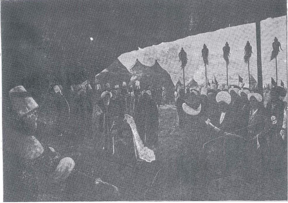
Tablo 1. Eğitim Bakanlığı tarafından oluşturularak okullara sunulan tarih levhalarından (Ressam Ziya Bey'in) Sultan I. Ahmet adına Başkomutan Lala Mehmet Paşa tarafından Prens Boçkay'a Macar Krallık tacının giydirilmesi töreni