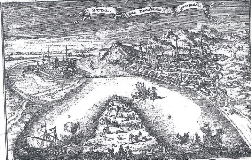
Tablo 2. Macaristan'ın başkenti olan "Budin" in Osmanlı egemenliği altında bulunduğu zamana ait manzarası

Değişik yerlerde görülen kırmızı yeşil bayraklar ise Osmanlı ordusunu teşkil eden "Tımarlı Sipahi" bölüklerinin bayraklarıdır. Törenin gerçekleştiği "Peşte" yakasının karşısında ve uzakta -o zaman Osmanlı egemenliği altında bulunan- Budin'in evleri, naları ve beyaz minareleriyle camileri görünüyor.