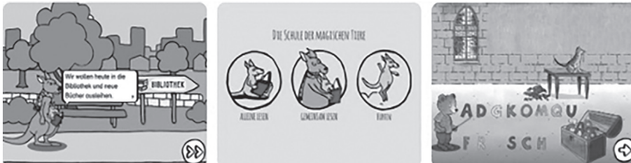
Abbildung 3. Seitenansicht der Applikation „Lesestart zum Lesenlernen“

Diese Applikation wurde von der Website „Lesestart“ entworfen, die auch eine breite Auswahl von Lesemöglichkeiten für Kinder zwischen den Altersgruppen zwei bis drei zur Verfügung stellt. Abgesehen davon ist diese Website auch für ältere Kinder, die die deutsche Sprache als Fremdsprache lernen wollen, zu empfehlen. Neben diesen Besonderheiten gibt es auf der Website Ideen für Eltern, wie sie ihre Kinder zum Lesen bringen können und auf welche Weise sie das Lesen zu einem Spiel umwandeln können. Auch können zahlreiche Materialien von dieser Website für kleine Fremdsprachler heruntergeladen werden.