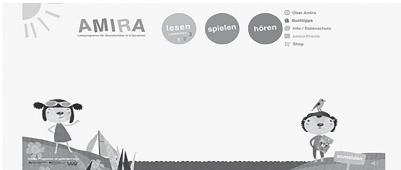
Abbildung 6. Seitenansicht der Website „Amira-lesen!“ - http://www.amira-lesen.de/#page=home

Wenn in der Fremdsprachendidaktik als ein Ziel gesetzt wird, Lernende mehr zum Lesen zu motivieren, dann sollten die Lehrkräfte mehr Zeit auf den oben genannten Websites verbringen, um die geeigneten für ihre Schüler zu finden.