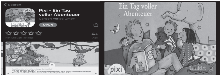
Abbildung 4. Seitenansicht der Applikation „Pixi – Ein Tag voller Abenteuer“

wachsenen aufgenommen und anschließend von den Kindern abgespielt werden. Im Netz befinden sich noch weitere Apps vom Carlsen Verlag zum Herunterladen. Ein paar Beispiele sind: „Wasser marsch!“, „Was passiert in der Spittelau?“, „Was die Sonne alles kann“. Durch Herunterladen dieser Apps taucht man in eine magische Welt ein und die Langeweile der Kinder beim Lesen wird so von den Erwachsenen in ein Vergnügen verwandelt.