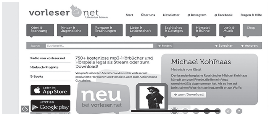
Abbildung 2. Seitenansicht der Website „Vorleser“ - https://www.vorleser.net

Diese Website hat einen großen Wert, da neben den originalen klassischen Werken auch Kommentare von den jeweiligen Sprechern über den Text zu finden sind. So eine Art von Lesemöglichkeiten macht die Websites auch für Erwachsene interessanter. Darüber hinaus wird den Besuchern eine Auswahl von Texten unterschiedlicher Länge angeboten, die von 15 Minuten bis zu mehreren Stunden dauern können. Neben den kostenfreien Abspielungen gibt es auch Hörbücher unter dem Button „Vorleser- Shop“ zu kaufen.