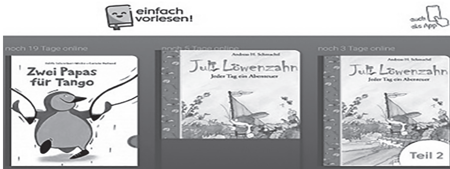
Abbildung 5. Seitenansicht der Website „Einfach vorlesen!“ - https://www.einfachvorlesen.de

wird kontinuierlich eine neue Geschichte veröffentlicht. Folglich haben die Nutzer immer etwas Neues zum Lesen und haben dadurch Zugang zu zahlreichen Texten. Der Zugang zu mehreren literarischen Texten wird dank solcher Möglichkeiten, die die Neuen Medien ihren Nutzern bieten, einfacher als je zuvor (Göçerler 2017: 266). Mit einer Anmeldung auf dieser Seite können die Nutzer über die neu veröffentlichten Geschichten informiert werden. Zwar gibt es hier keine Auswahl von Hörbüchern, aber die durchschnittliche Vorlesedauer wird angegeben. Dementsprechend je können die Geschichten nach ihrer Dauer von den Lesern ausgewählt werden. Darüber hinaus werden unter der Internetadresse lesestart.de , die von einfach vorlesen.de für Kleinkinder ab einem Jahr bereitgestellt worden ist, Leseübungen angeboten.