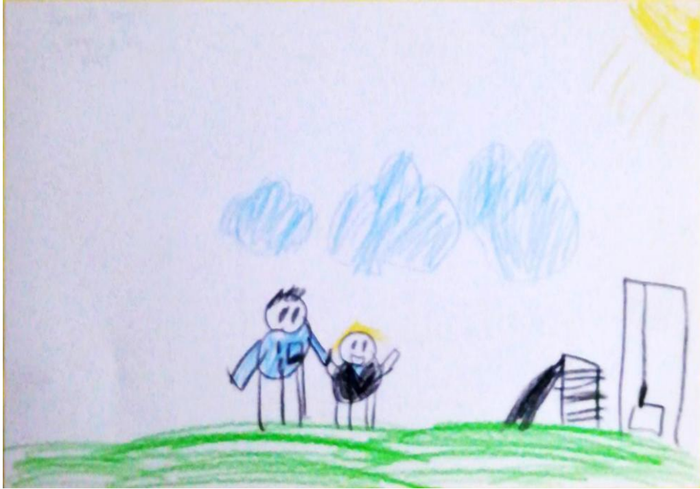
Resim 6. “Oyun oynamak” faaliyetini gösteren örnek resim

Ç8, “Kardeşinle beraber en çok ne yapmayı seviyorsun?” sorusuna ise “oyun oynamak” cevabını vermiş ve resimle ilgili anlatımında “güneşli bir havada parkta oyun oynamaya gittiklerini” ifade etmiştir.