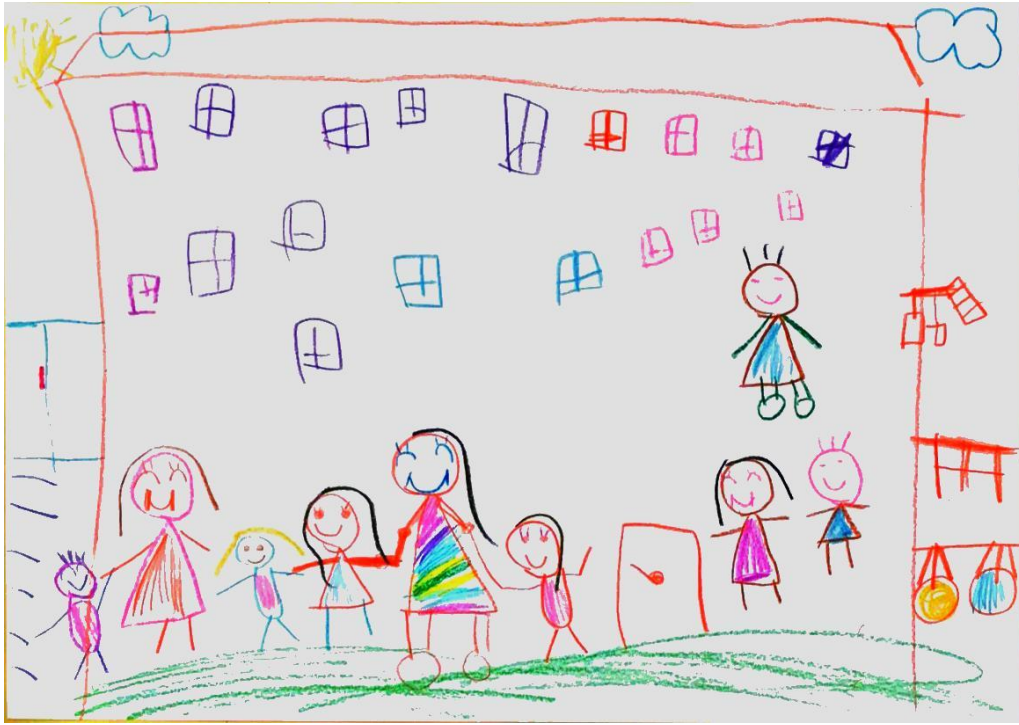
Resim 2. “İnsan” figürüne yer verilen örnek resim

Çocukların kardeş resminin çiziminde kullandıkları figürler incelendiğinde, çocuklar en çok “insan” figürüne yer vermişlerdir. Ç14’ün çizdiği resim, Resim 2’de gösterilmiştir.