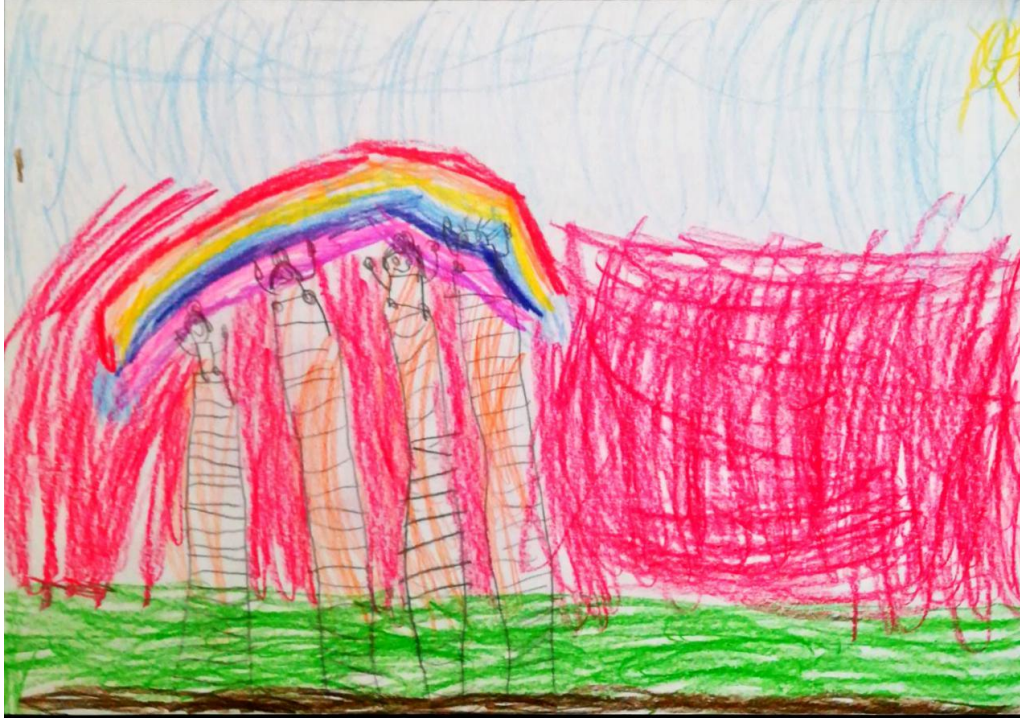
Resim 3. Çocukların, kendi kardeşleri olduğunu belirttikleri örnek resim

Çocukların çizdikleri kardeş figürünün kimin kardeşi olduğu incelendiğinde, çocuklar, kendi kardeşleri olduğunu belirtmişlerdir. Ç16’nın çizdiği resim, Resim 3’te gösterilmiştir.