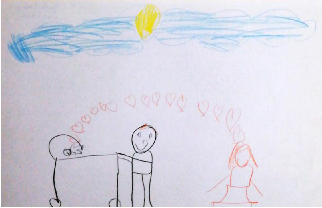
Resim 5. “Güzellik” duygusunun hissedildiğini gösteren örnek resim

Çocukların çizdikleri kardeş figürlerinde en çok “güzellik” duygusunu hissettiklerine dair Ç6’nın çizdiği resim, Resim 5’te gösterilmiştir.