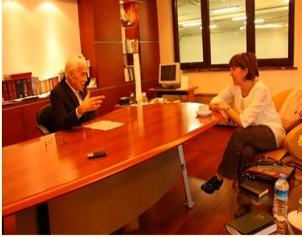
Şekil 1. 19.04 2013 tarihli görüşme