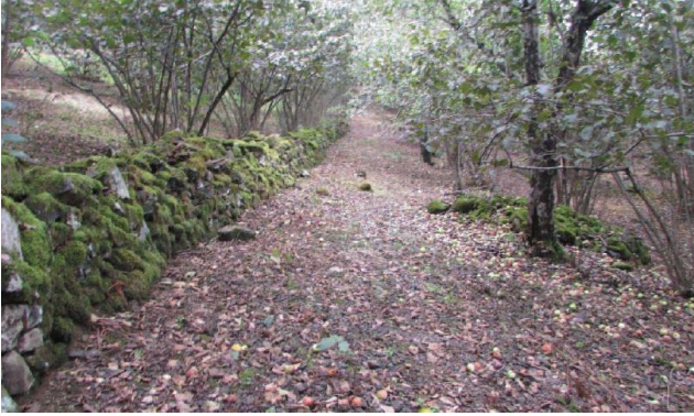
Fotograf 4. Dogankent Kozköy'de Ruslar Tarafından Yapılan Nakliye Yolu (Yazıcı, 2019).