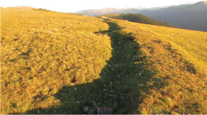
Fotoğraf 2. Dogankent Süttaşı Mahallesi Tepealan yaylasında mevzi ve siper alanları (Yazıcı, 2019).