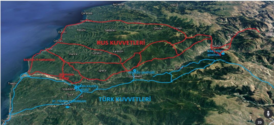
Türk ve Rus birliklerinin bulunduğu güzergâhı ve şehitlikler (Araştırmacı tarafından oluşturulmuştur)

Öte yandan bu göç sırasında geride kalanlar veya yakalananlar yol yapımı, erzak taşıma ve siper kazma gibi ağır işlerde çalıştırıldıkları gibi özellikle Rus Birlikleri içerisindeki ermeni asıllı askerlerin yaşlı ve çocukları acımasızca öldürdükleri, kadınlara ise tecavüz ettikleri bilinmektedir. Bu trajediyle karşılaşmak istemeyen bazı kadınların küçük çocuklarını Harşit Çayı'na attıkları, genç kızların ise tecavüze uğramamak için kendilerini uçurumlardan aşağı atarak intihar ettikleri bölge halkının hafızasında acı bir hatıra olarak durmaktadır (Karadeniz, 2017; Ünlü, 2019).