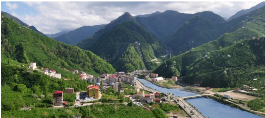
Doğankent (Harşit)'ten bir görünüm (Fatsa 2016).

Birinci Dünya Savaşı'nda Almanya'nın tarafında yer alan Osmanlı, İtilaf devletlerince saldırıya maruz kalmıştır. Bu bağlamda Karadeniz sahilindeki Osmanlı şehirleri hem Osmanlı'nın ticaret yollarını işlevsiz hale getirmek hem de Kafkas cephesine yapılan askeri sevkıyatı önlemek amacıyla, Rus savaş gemilerinin bombardımanlarına hedef olmaya başlamıştır