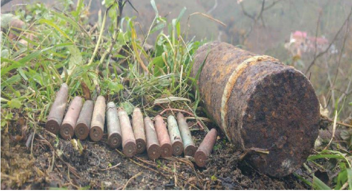
Fotograf 3. Doğankent Yeniköy'de Rus Savaşından kalan Mavzer ve Top Mermileri (Yazıcı, 2019).