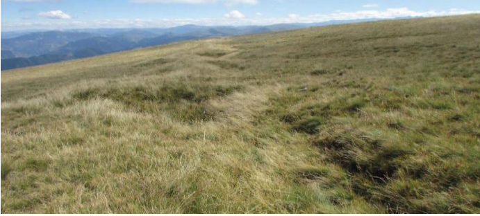
Fotoğraf 1. Kürtün Güvende yakınlarındaki Kırkatlı'da Mevzi ve Siper Alanları (Yazıcı, 2019).

Harşit vadisi Savunmasına ait somut izler sadece şehitliklerden ibaret değildir. Örneğin yontma taştan yapılmış Tirebolu evleri ile resmi binaları hala o dönemden kalma mermi izlerini taşımaktadır. Bunların başında Osmanlı zamanında Yeniköy'de askeri kışla olarak kullanılan, günümüzde ise okul olarak hizmet veren bina gelmektedir. Aynı şekilde Tirebolu Belediye Binası da söz konusu izleri taşımaktadır. Rusların tahribatından camiler ve mescitler de nasibini almıştır. Bunlar arasında Kürtün'de Şıhlı Camii, Harsit'te Sadı Köyü Camii ve Tirebolu'da Yukarı Orta camii sayılabilir. Yine Harsit Vadisi içerisindeki savaşa ait siper ve mevziler ile (Fotoğraf 1 ve 2) buralarda ele geçen mermi ve kovanlar (Fotoğraf 3), nakliye yolları (Fotoğraf 4) ve ekmek pişirme fırınları (Fotoğraf 5) hala o günlerin acısını gösterircesine durmaktadır (Yazıcı, 2019).