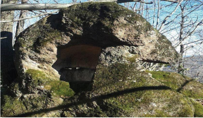
Fotograf 5. Şaban Kalesinde Türk askerlerinin iaşelerini pişirdiği fırın (Yazıcı, 2019).