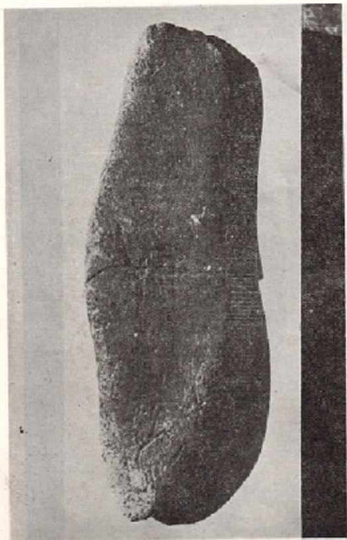
11 - Toq bulg'u, g'öc'öde parakei hatlarlı boy tarafında lür g'öc'ü çözülmüştür.