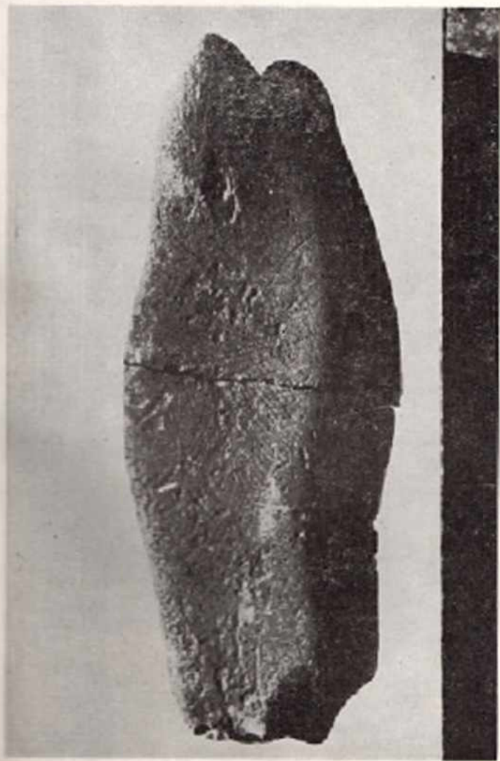
1 - Taş bula, Güvercinte çaprazlaması buldu çözümlenmiş.