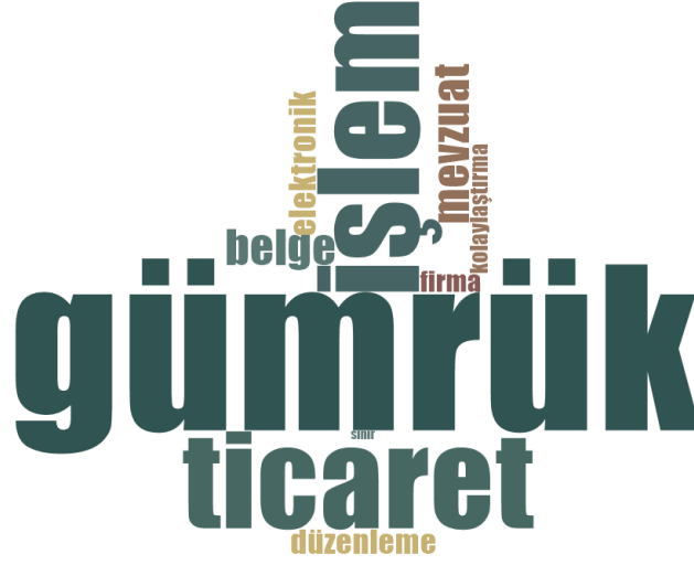
Şekil 3. Gümrük Yetkilisi Görüşmeleri Kelime Bulutu