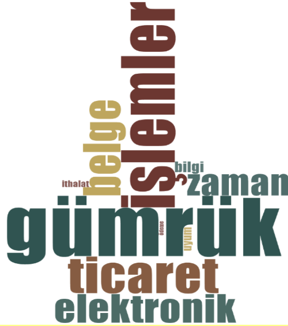
Şekil 2. Firma Yetkilisi Görüşmeleri Kelime Bulutu