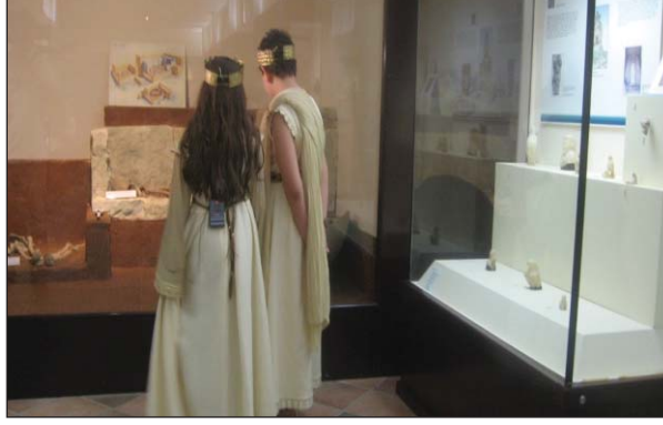
Şekil 12. Isınma çalışmaları