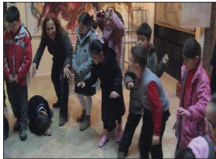
Şekil 2. Isınma çalışmaları