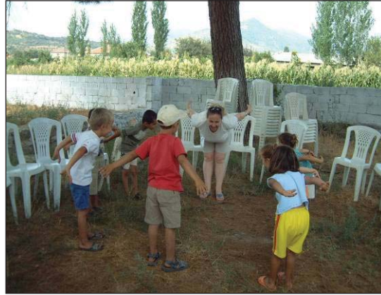
Şekil 6. Isınma çalışmaları