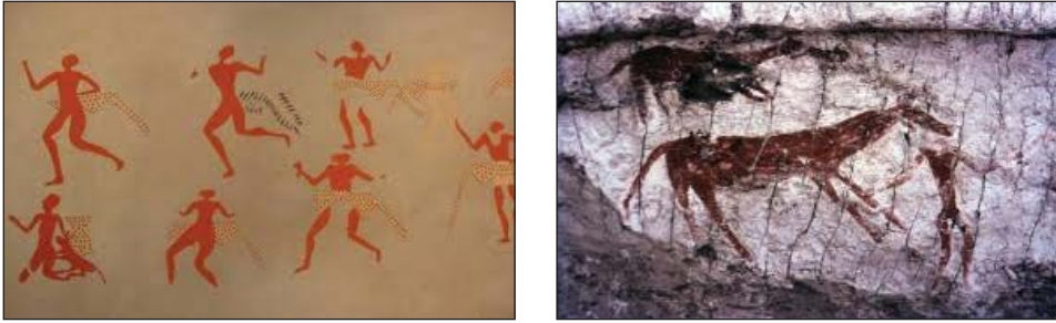
Şekil 1. Kartlarda olan duvar resimleri