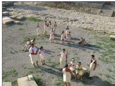
Şekil 7. Kazı alanındaki antik tiyatroya yapılan doğaçlama çalışması