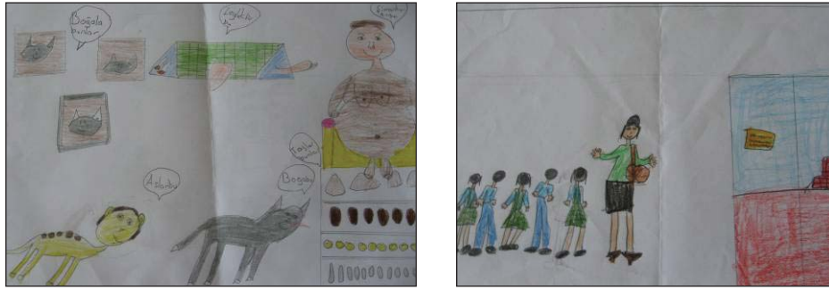
Şekil 4. Müze öncesi ve sonrasında yapılan resimler