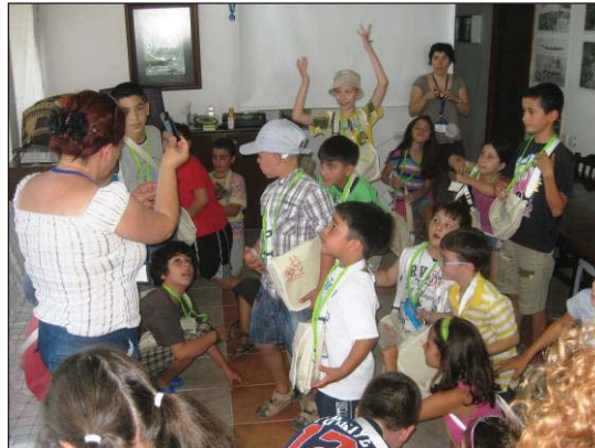
Şekil 14. Isınma çalışmaları

Çocuklar süreçte yaşadıklarına yönelik kilden heykeller ya da resim yaparlar. Yaptıkları heykelleri ve resimleri arkadaşlarına anlatırlar (Şekil 15).