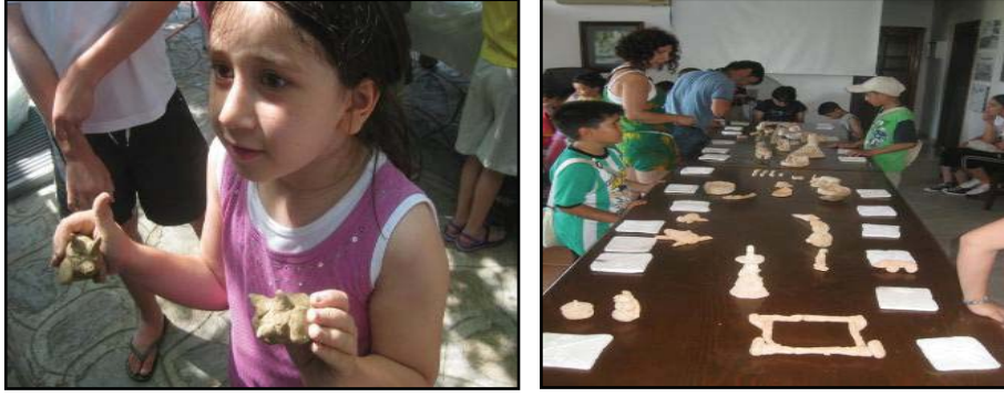
Şekil 15. Değerlendirme aşaması

Bu çalışmada müzelerde, arkeolojik alanlarda ve bir sergide yapılan drama çalışmalarına yer verilmiştir. Bizlere geçmişi anlatan mekânlarda yapılan her bir çalışmanın çocuklara sağladığı kazanımlar oldukça önemlidir. Tarihi mekânlarda yapılan çalışmaların yaygınlaştırılması ile daha fazla çocuğun benzer kazanımlara ulaşması sağlanabilir. Okullarda dört duvar arasında işlenen derslerde didaktik bir yöntemle işlenen konuların çok da akılda kalıcı olmadığı dikkate alındığında gerçek mekânlarda drama gibi yaşayarak yaparak edinilen kazanımların değeri büyüktür.