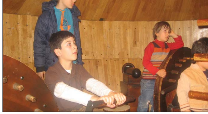
Şekil 10. Doğaçlama