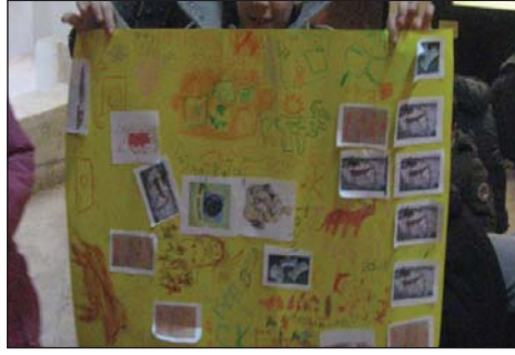
Şekil 3. Gruplar tarafından yapılan kolaj ve resim çalışması