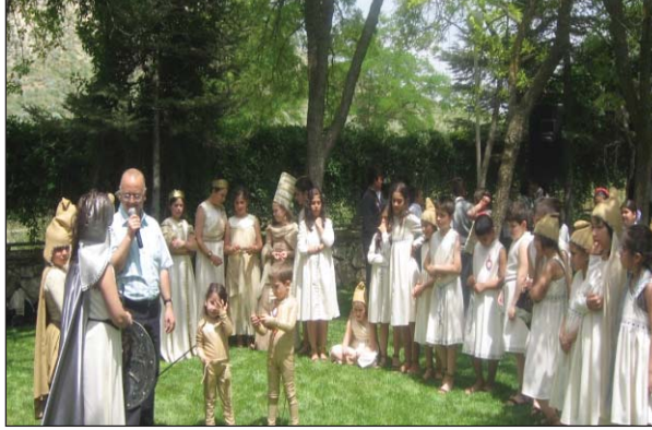
Şekil 13. Değerlendirme aşaması