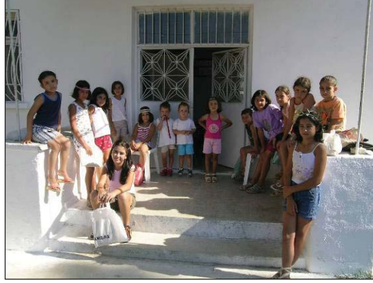
Şekil 5. Magnesia kazıevi önünde buluşma