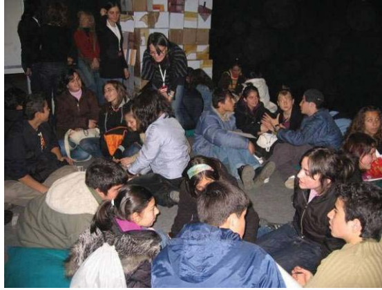
Şekil 11. Sergi salonuna girmeden önce sohbet