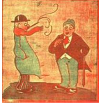
Şekil 1. Kadın'ın Seçme-Seçilme Hakkı Elde Etmesine Yönelik Cumhuriyet Gazetesinden Yayımlanan Karikatür

“-Karı Belediye Meclisine aza olmuş, tebrik ederim. -Tebrik değil, taziye et birader. Evdeki gibi orada da başıma bela kesilecek. Malum ya ben Şehremantinden memnunum.”