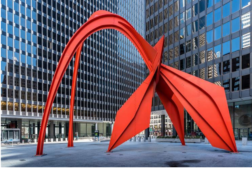
Görsel 1: Alexander Calder, Flamingo, Monumental Works: 1963-1976, 1973. Boyalı Çelik Plaka. 13, 5 m. yükseklik. Federal Center Plaza, Chicago.