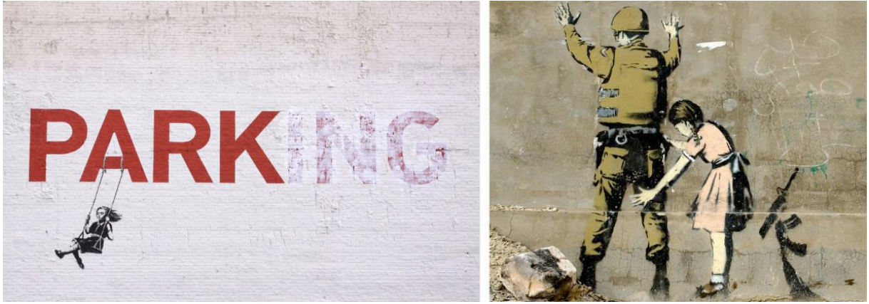
Görsel 2: Banksy’nin duvarlara yapmış olduğu duvar yazıları (Grafitti) örnekleri (Doğanay, 2015, 65).

Sokak sanatı kamusal alanlarda yaratılan bir görsel sanat türüdür. “Modern dünyada; mimari anlamda; kentsel çevrede kişiyi bir mekâna ileten eleman olarak ele alınan duvarlar; sağır etkiye sahip yan yüzeyler ya da cepleri oluşturmaktadır. Monotonluk etkisini giderirler, kentte çevrede açık ya da yarı açık mekânları oluştururlar” (Yamaçlı, 1997’den akt: Doğanay, 2015, 64). Sokak duvarlarına yazılan yazılar, çizilen şekiller çevreye bırakılan bir iz olarak dikkat çekmekte, boş duvarları ilgi çekici hale getirmektedir. Sokak sanatında duvar yüzeyleri birer sanat dili olarak ifadelerin belirdiği alanlardır. Kent içerisinde çoğu otorite tarafından izin verilmemesine rağmen sokak duvarları görsel biçimlemelerle varlığı devam ettirmektedir. Güncel sanat pratikleri arasında grafiti, duvarlara yazılan yazılar ve boyamalarla Banksy’nin işleri ile de önemli bir yere ulaşmıştır. Banksy, grafitilerinde çoğunlukla toplumsal konulara odaklanmakta, tüketim çılgınlığına, hayvan haklarına, savaşa karşıtlığına yönelik tavrını biçimsel olarak sunmaktadır (Doğanay, 2015, 64).