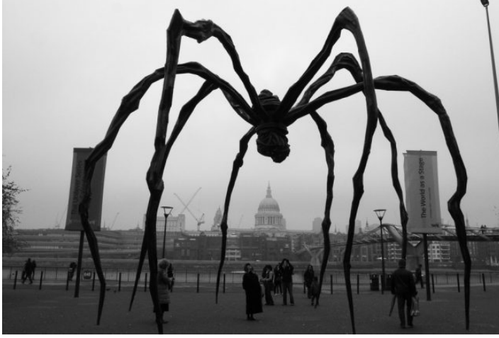
Görsel 3 : Louise Bourgeois, 'Maman' Anne, Bronze. 1999. ( https://blog.artsper.com/en/a-closer-look/3826/ )

Örümcek, büyük bir sabırla tıpkı bir anne gibi yuvasını örmekte, ağını tamir etmekte ve korumaktadır. Sanatçı bunlar ve daha birçok özellikleri ile öncelikle annesi olmak üzere doğurganlık, sabır, korku, dişilik, arkadaşlık gibi birçok kavramı ifade eden bir biçimdir. Anıtsal örümcek heykeli ile sanatçı adeta annesini ölümsüzleştirmek istemiş, bireysel duygu durumlarını evrensele taşıyarak sanat biçimi olarak başarı ile sonuçlandırmıştır. Bu biçimsel görsel etkisi ile sadece kendisini değil tüm şehri koruyan bir anne olarak örümcek kentte varlığını göstermiştir (Sağlık, 2013, 47, 48).