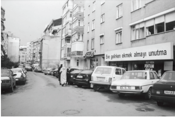
Görsel 7: Vahit Tuna, "Eve Gelirken Ekmek Almayı Unutma", 2000, İstanbul

Vahit Tuna'nın sözcükler ile gerçekleştirdiği bir kamusal alanda sanat çalışması ise bilindik bir cümlenin bir tabela olarak belirmiş olmasıdır. Tuna evde bulunanların, dışarıdan gelecek olana gelirken almalarını söyledikleri oldukça sık kullanılan bir cümle olan 'eve gelirken ekmek almayı unutma' cümlesini gözler önüne sererek, hayatımızdaki rutinelere dikkat çekmekte ve kim bilir hayatımızda farkına varmadığımız daha pek çok şeyi düşünmeye yönlendirmektedir.