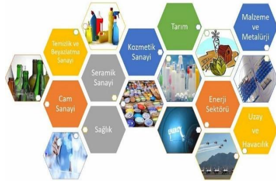
Şekil 1. Borun kullanım alanları Figure 1. Different using areas of boron

1861 yılında çıkartılan Maadin Nizamnamesi uyarınca 1865 yılında bir Fransız şirketine 20 senelik işletme imtiyazı verilmesiyle Türkiye'de ilk işletmenin çalışmaya başladığı bilinmektedir. 1950 yılında Bigadiç ve 1952 yılında Mustafakemalpaşa yöresindeki kolemanit yatakları bulunmuştur. 1956 yılında Kütahya-Emet kolemanit, 1961 yılında Eskişehir-Kırka boraks yataklarının bulunması ve işletilmeye başlanmasıyla Türkiye dünya bor üretimi içinde 1955 yıllarında %3 olan payını 1962'de %15, 1977'de %39 düzeyine yükseltmiş ve giderek artan üretimi sayesinde de günümüzde ABD'nin en önemli rakibi haline gelmiştir [8, 9].