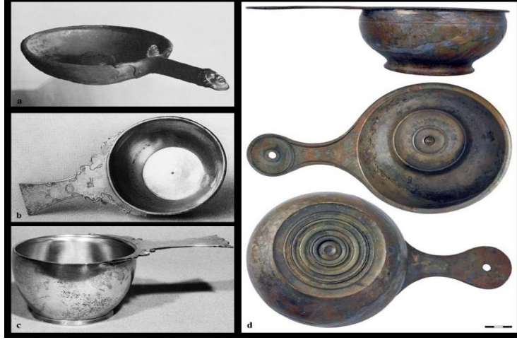
Şekil 1: Patella ve Casserole (Güveç) Örnekleri (a: Matthews, 1969: 32; b-c: Igl, 2002: 99, Abb. 16, 18; d: Treister, 2020: 35, Fig. 18)