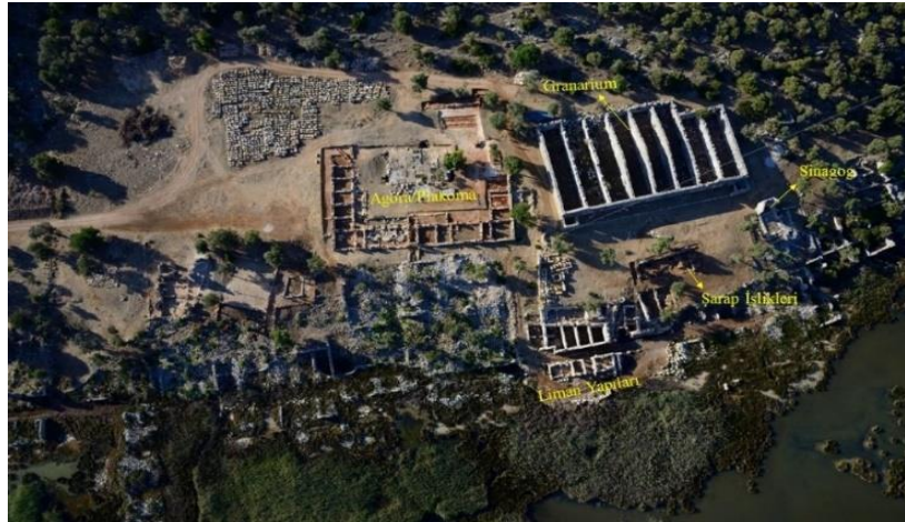
Resim 2: Patera/tagenonun Ele Geçtiği Granarium'un Konumu