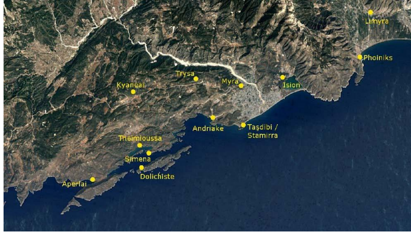
Resim 1: Myra ve Andriake'nin Konumu (Aygün, 2018: 290, Lev. 2)

ZHURAVLEV, Denis V. (2002), “ Terra Sigillata and Red Slip Pottery in the North Pontic Region (A Short Bibliographical Survey)”, Ancient Civilizations from Scythia to Siberia , 8.3, 237-309.