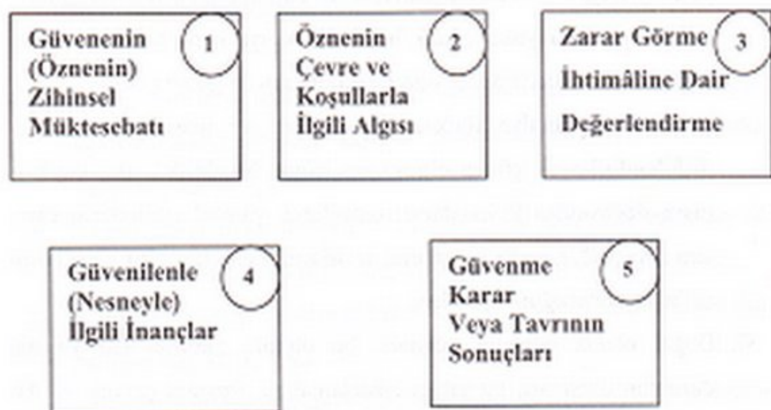
Şekil 1. Güveni Oluşturan Temel Unsurlar

Bu tespitlerden hareketle, güvenin aşağıda betimlenen unsurlardan meydana geldiği söylenebilir: