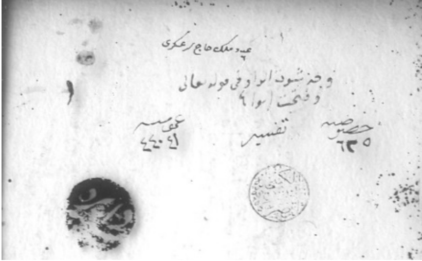
عنوان النسخة (أ) من المكتبة الخديوية.

(وَأَنْ تَعَجِبَ فَهِنَّكَ رِسَالَةٌ فِي مَعْنَى حَرْفِ الْوَاوِ، أَوْ وَجْهٍ ثَبُوتِ الْوَاوِ فِي قَوْلِهِ تَعَالَى: (وَفُتِحَتْ أَبْوَابُهَا) مِنْ أَوَاخِرِ سُورَةِ الزُّمَرِ، أَرَأَيْتَ ذَلِكَ وَأَضْعَافَ ذَلِكَ إِنَّهُ قَبَسٌ مِنْ نُورِ الْقُرْآنِ، وَشِعَاعٌ مِنْ شَمْسِ الْحَقِيقَةِ الْكُبْرَى، وَبَصِيصٌ مِنْ تَجَلِّيَّاتِ هُدَايَاتِ اللَّهِ لِعِبَادِهِ) 48 .