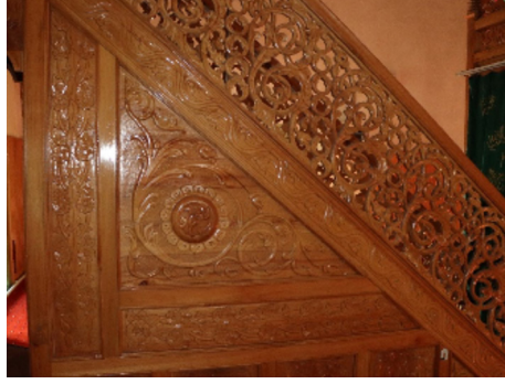
Resim 37: Seferağa Camii ahşap minberden detay