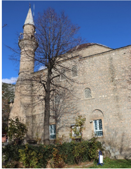
Resim 17: Seferağa Camii batı cephe ve pencere açıklıkları