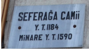
Resim 3: Seferağa Camii giriş kapısındaki kitabe