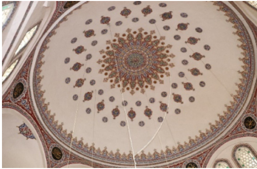
Resim 9: Seferağa Camii kubbe ve kubbeye geçiş bölgesi