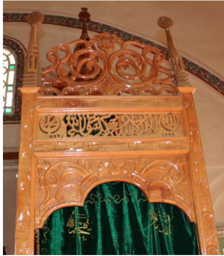
Resim 39: Seferağa Camii minberi kapı kemi, aynalık ve tepelik