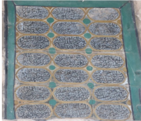
Resim 6: Seferağa Camii giriş kapısındaki kitabe