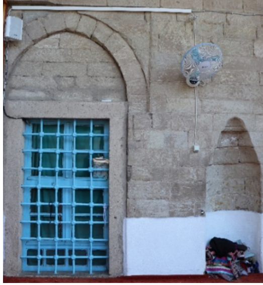
Resim 12: Seferağa Camii son cemaat yeri batı bölümdeki mihrabiye