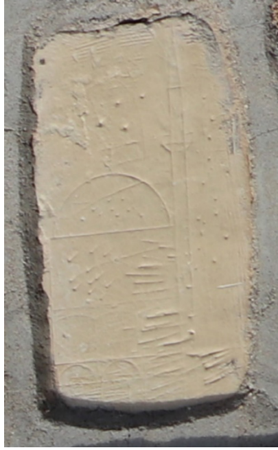
Resim 21: Seferağa Camii güney duvarındaki cami kabartması