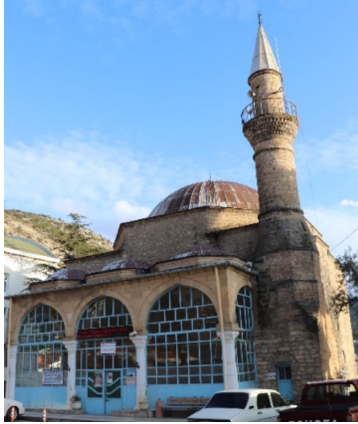
Resim 13: Seferağa Camii kuzey cephe ve minaresi