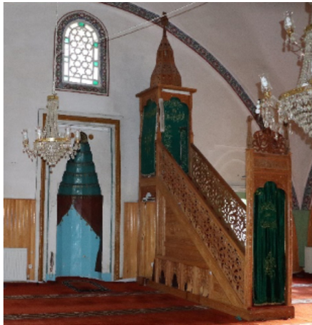
Resim 36: Seferağa Camii mihrap ve minberi