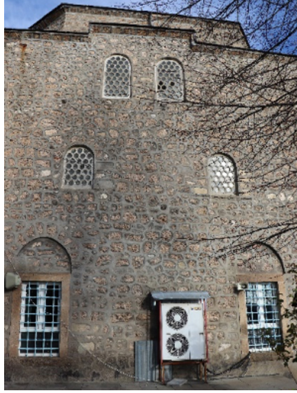
Resim 18: Seferağa Camii batı cephe ve pencere açıklıkları