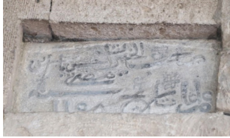
Resim 5: Seferağa Camii minare kaidesindeki kitabe