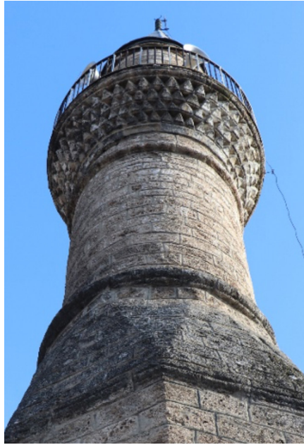
Resim 15: Seferağa Camii mukarnas süslemeli minare şerefesi