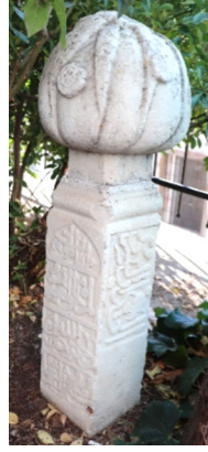
Fotoğraf 1b: 1 numaralı mezar taşı ile ön ve yan yüzelerindeki kitabeler