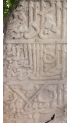
Fotoğraf 1b: 2 numaralı mezar taşı ve kitabe yüzeylerindeki bitkisel bezemeler