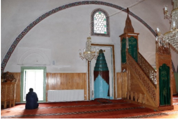
Resim 28: Seferağa Camii iç mekânda duvar yüzeyindeki friz kuşağı