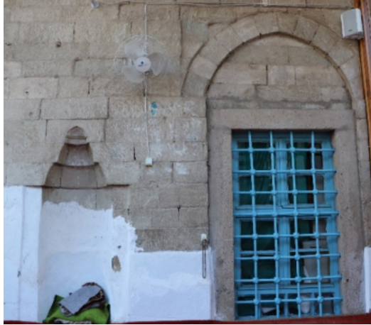
Resim 11: Seferağa Camii son cemaat yeri doğu bölümdeki mihrabiye