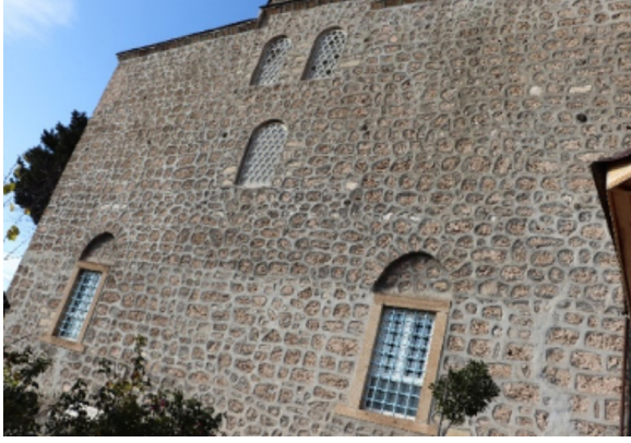
Resim 20: Seferağa Camii güney cephe ve pencere açıklıkları