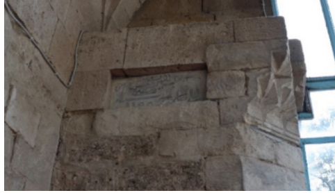
Resim 4: Seferağa Camii minare kaidesindeki kitabe