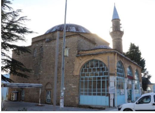
Resim 7: Seferağa Camii