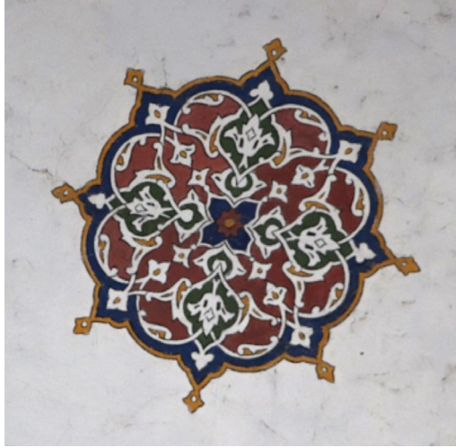
Resim 25: Seferağa Camii son cemaat yeri kubbe merkezindeki kalem işi