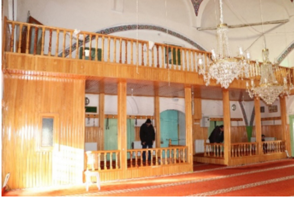
Resim 33: Seferağa Camii kuzey bölümdeki kadınlar mahfili