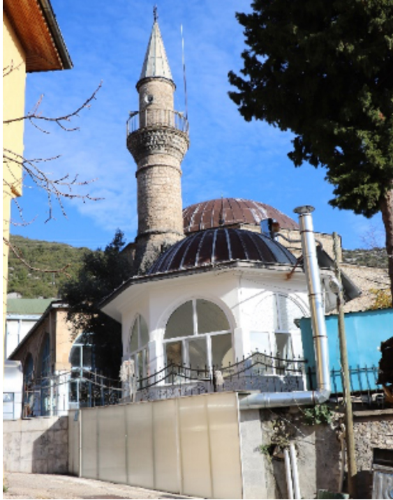
Resim 27: Seferağa Camii ve şadırvanı