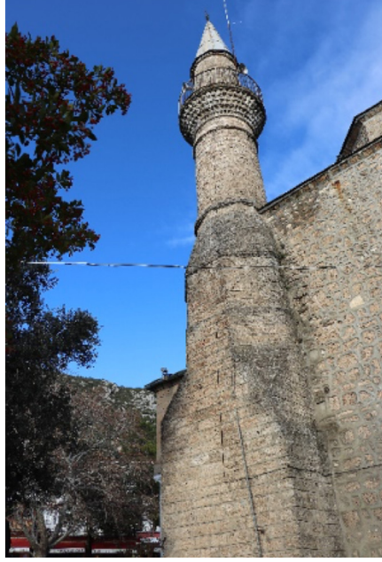
Resim 14: Seferağa Camii minaresi