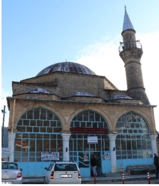
Resim 10: Seferağa Camii kuzey cephe