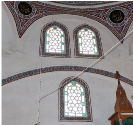
Resim 30: Seferağa Camii mihrap duvarındaki pencereler