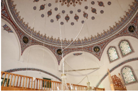
Resim 8: Seferağa Camii kubbe ve kubbeye geçiş bölgesi