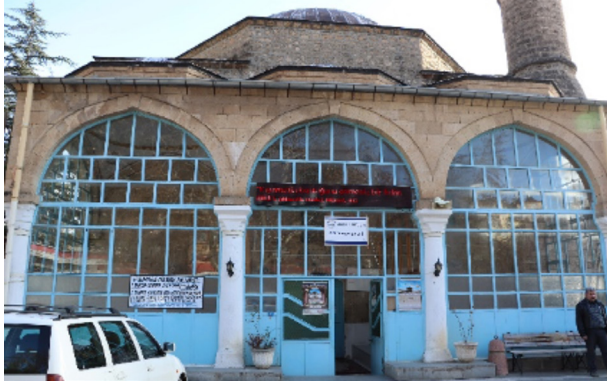
Resim 22: Seferaga Camii son cemaat yeri ve camiye giriş kapısı.