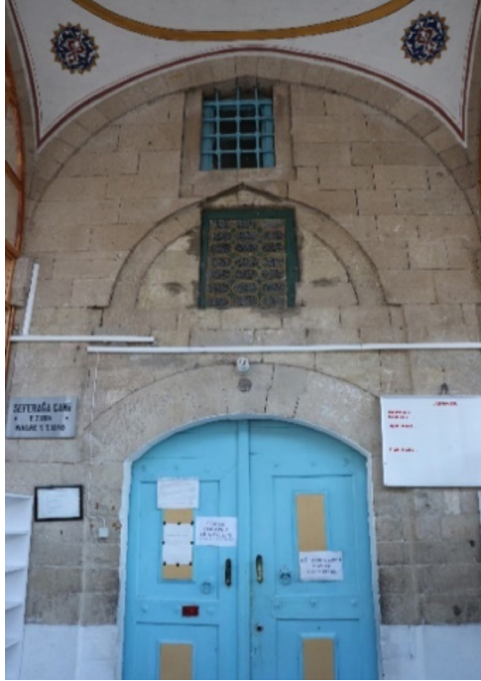
Resim 2: Seferağa Camii giriş kapısındaki kitabeler