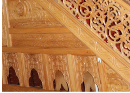
Resim 38: Seferağa Camii minberi süpürgelik