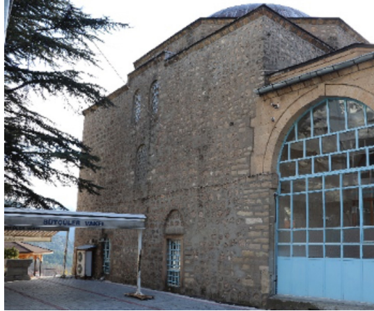
Resim 19: Seferağa Camii doğu cephe ve pencere açıklıkları