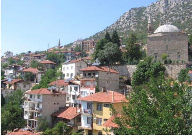
Resim 1: Sütçüler ilçe merkezi ve Seferağa Camii