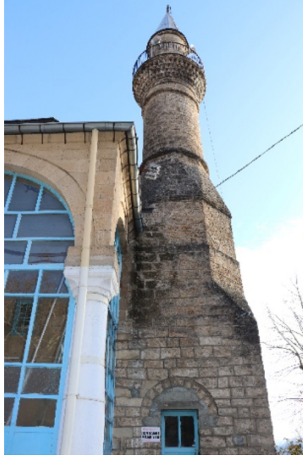
Resim 16: Seferağa Camii minaresi