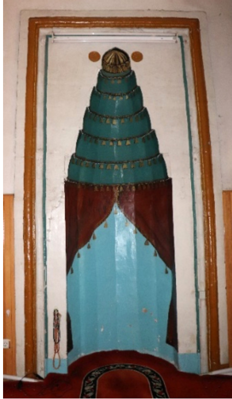
Resim 34: Seferağa Camii mihrabı