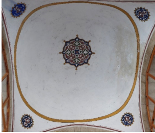
Resim 24: Seferağa Camii son cemaat yeri kubbe iç yüzeyi