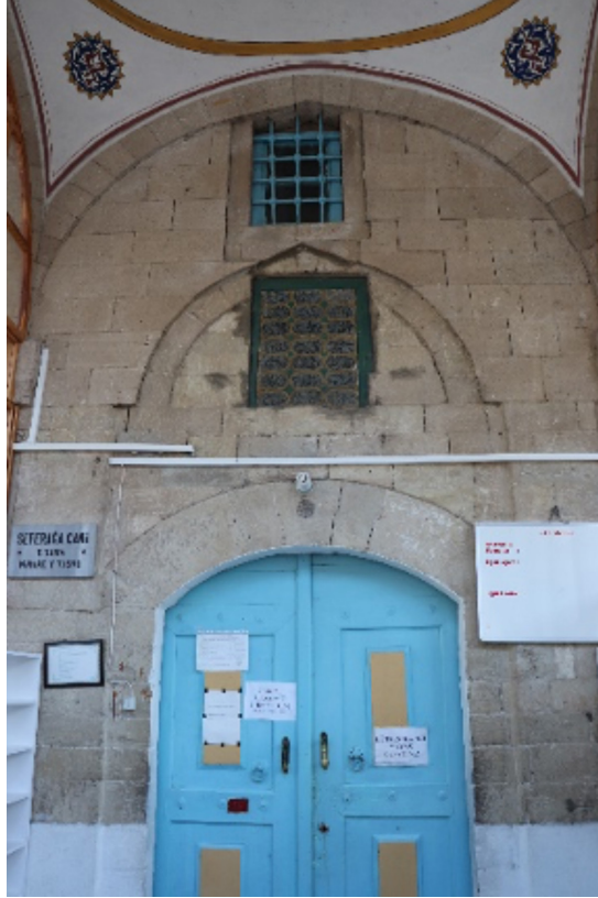
Resim 23: Seferaga Camii asıl giriş kapısı ve kitabe