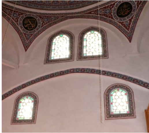
Resim 32: Seferağa Camii batı duvarındaki pencerelere