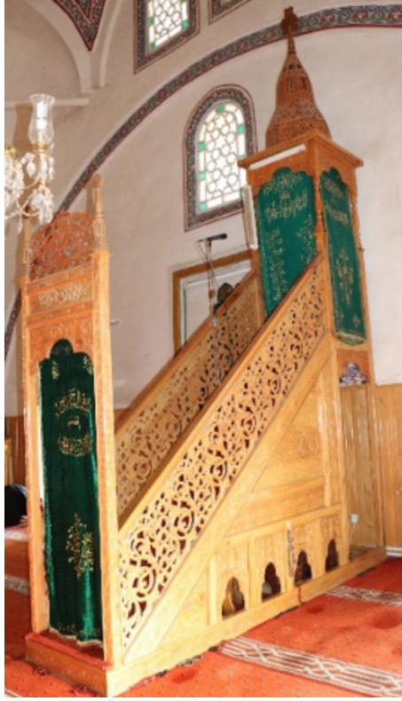
Resim 35: Seferağa Camii Minberi