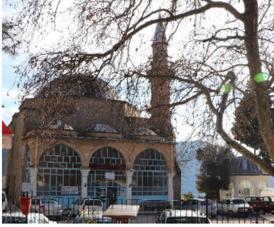
Resim 26: Seferağa Camii ve şadırvanı