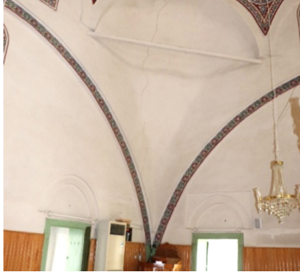
Resim 29: Seferağa Camii iç mekânda duvar yüzeyindeki friz kuşağı