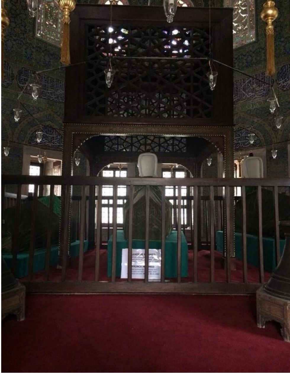
Ek 3- Şehzade Mehmed Türbesi. Ortada Şehzade Mehmed, sağda Şehzade Cihangir, solda Hümaşah Sultan