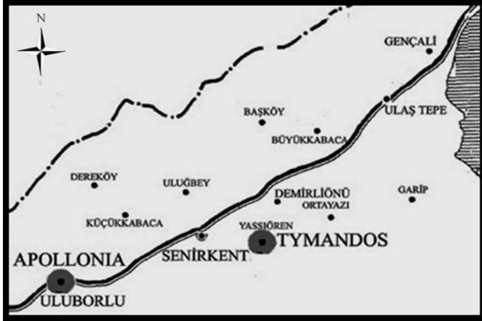
Harita 2- Kuzeybatı Pisidia Haritası-Tymandos/Yassıören (IAS Arşiv)