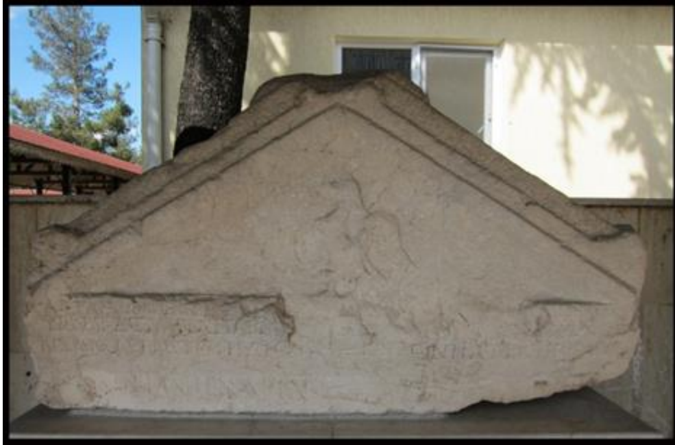
Resim 1- Yassıören Kasabası Mezar Steli (IAS Arşiv, Isparta Arkeoloji Müzesi-Müze Env. No. 13.2.03)