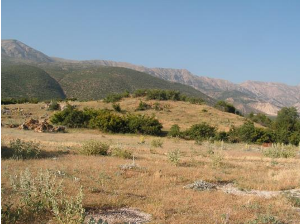
Resim 3- Delipınar Tümlüsü