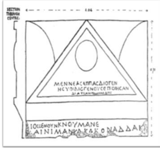
Resim 2- Yassıören Kasabası Kapı Tipi Mezar Steli (MAMA IV, fig. 240)