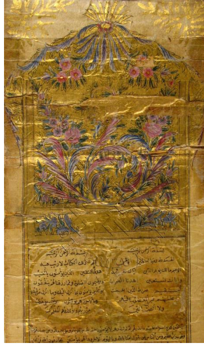
Görsel 4. 6800 Envanter No'lu Eserin Tezhibi (Süleymaniye Kütüphanesi).

Yapraklar cetvelin dışına çıkarak cetveli saracak şekilde tasarlanmıştır. Desenin üst kısmında kalan boşluklarda yalnızca altın kullanılarak tasarımda bütünlük sağlanmıştır. Mushâf-ı Şerîf'te yazının iki yanına altın cetvel çekilmiş, 3552 satırdan oluşan kitapta her satır arası da altın cetvellidir. Bazı satırlarda is mürekkebinin yanı sıra altında kullanılmıştır. XIX. yüzyıl özelliklerini taşıyan serlevha tezhibinde sayfa düzeni, kullanılan renk ve motifler bakımından rokoko etkileri görülmektedir (Görsel 4).