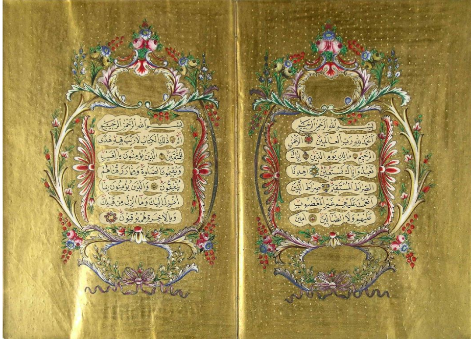
Görsel 2. 03787 Envanter No'lu Eserin Serlevha Tezhibi (Süleymaniye Kütüphanesi).

Klâsik dönem tezhibinde bulunan koltuk tezhibi ve cetvel gibi bezeme unsurları XIX. yüzyıla ait olan bu Kur'ân-ı Kerîm de bulunmamaktadır. Yazı alanında beyne's sutur 4 yapılmış, satır arası tezhibi yalnız altınla doldurulup is mürekkebi ile tahrir çekilmiştir. Duraklarda altının yanı sıra mavi, kırmızı, yeşil ve mor gibi serlevha tezyinatındaki renklerin kullanıldığı görülür. Serlevha tezhibi karşılıklı iki sayfada aynı olacak şekilde tezyin edilmiştir.