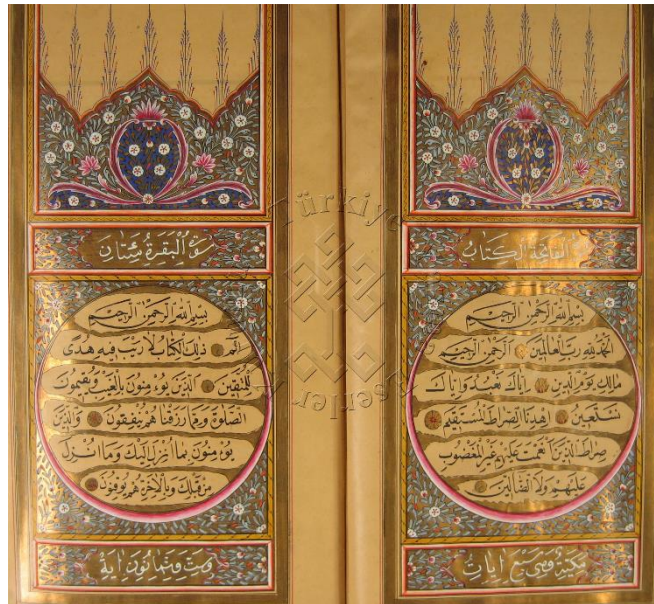
Görsel 6. 00798 Envanter No'lu Eserin Serlevha Tezhibi (Süleymaniye Kütüphanesi).

Taç kısmı ½ ölçülerinde hataî grubu motif, dilimli yaprak ve stilize edilmiş natüralist üslupta çiçekler kullanılarak tasarlanmıştır. Tasarımın tam ortası buket şeklinde gül motifleri ile tezyîn edilerek, zemin ayrımı yapraklarla yapılmış, zemin rengi olarak altın ve lacivert kullanılmıştır. Motiflerde pembe, mavi, yeşil renkler hâkim olmakla birlikte motifler üzerine yapılan gölgelendirme tekniğiyle motiflere boyut kazandırılmıştır. Renklerde rokoko etkileri olarak bilinen pastel tonlar kullanılmıştır. Sülyen renkte dendanlar üzerine yapılan tığlarda mavi ve kırmızı renk hâkimdir. Tığların yapılmasıyla tezhipten boşluğa geçiş sağlanmıştır.