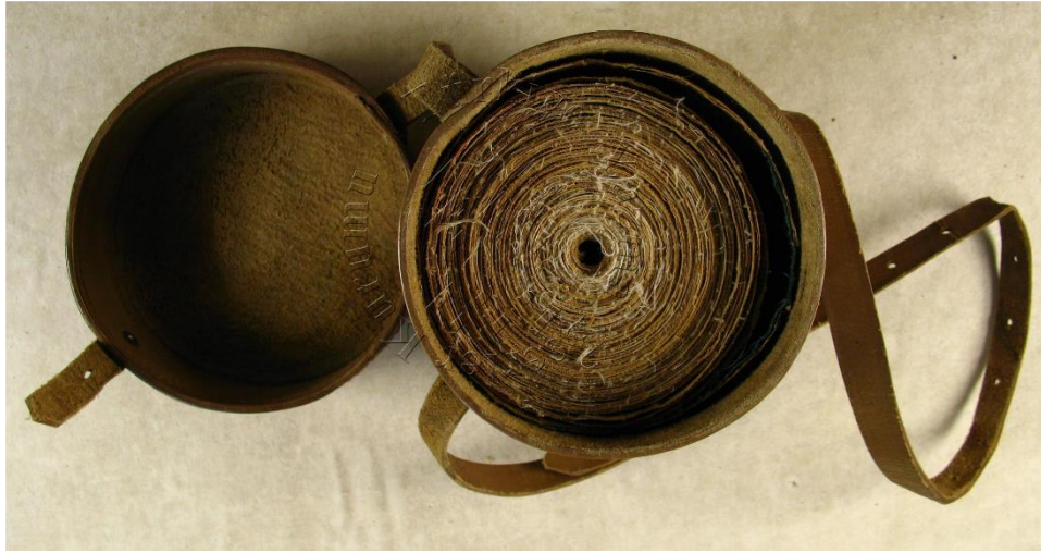
Görsel 3. 6800 Envanter No'lu Eserin Rulo Şeklindeki Görüntüsü (Süleymaniye Kütüphanesi).

İkinci eser; ferağ kaydında, Seyyid Halîl Rif'âtî tarafından yazıldığı ibaresi bulunan tomar halindeki Kur'ân-ı Kerîm, kütüphanenin Yazma Bağışlar Bölümünde 06800 Envanter numarasıyla yer almaktadır. 1271/1856 tarihli eserin ebadı 13150x90 mm. dir. Aharlı kâğıt üzerine düzgün bir nesih hat ile yazılmış eserde zahriye sayfası bulunmamaktadır. Kur'ân-ı Kerîm kâğıtların birbirine eklenmesiyle elde edilen yekpare bir zemin üzerine yazılmıştır. Tomar halindeki Kur'ân-ı Kerîm kahverengi yuvarlak formda deri bir çantada muhafaza edilmektedir(Görsel 3).