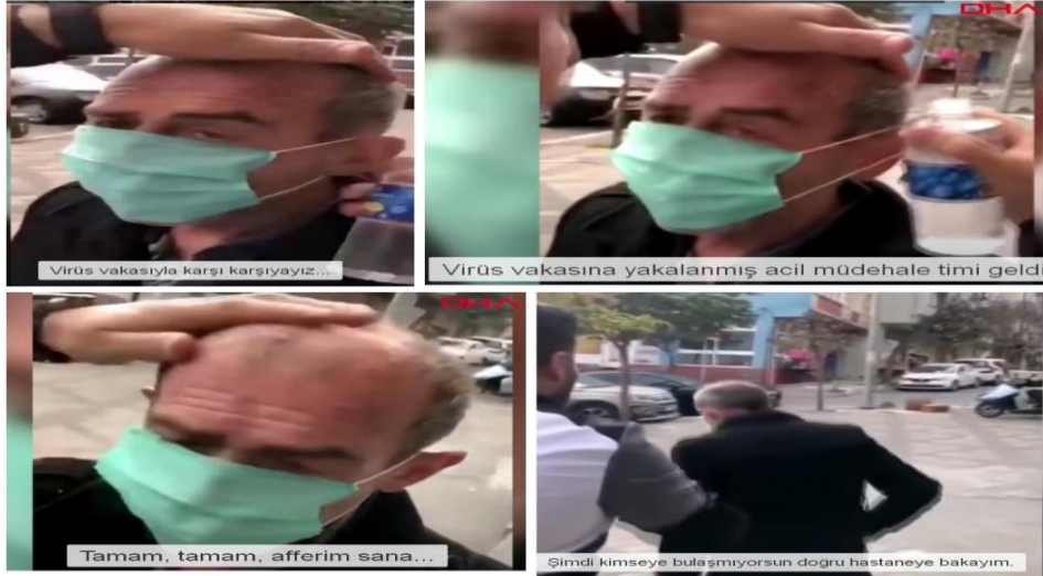
Görsel 2. Örnek Olay 2'nin Görseli