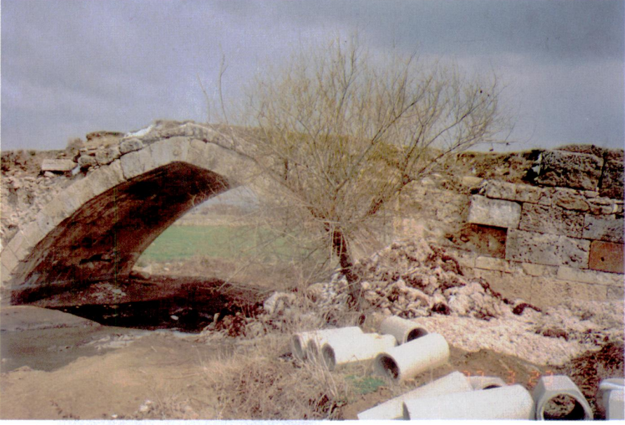
Res. 3 – Uşak, Çanlı-köprü, 1997 Martı'nda, Mansab tarafından görünüş: Kitabe yeri boş.