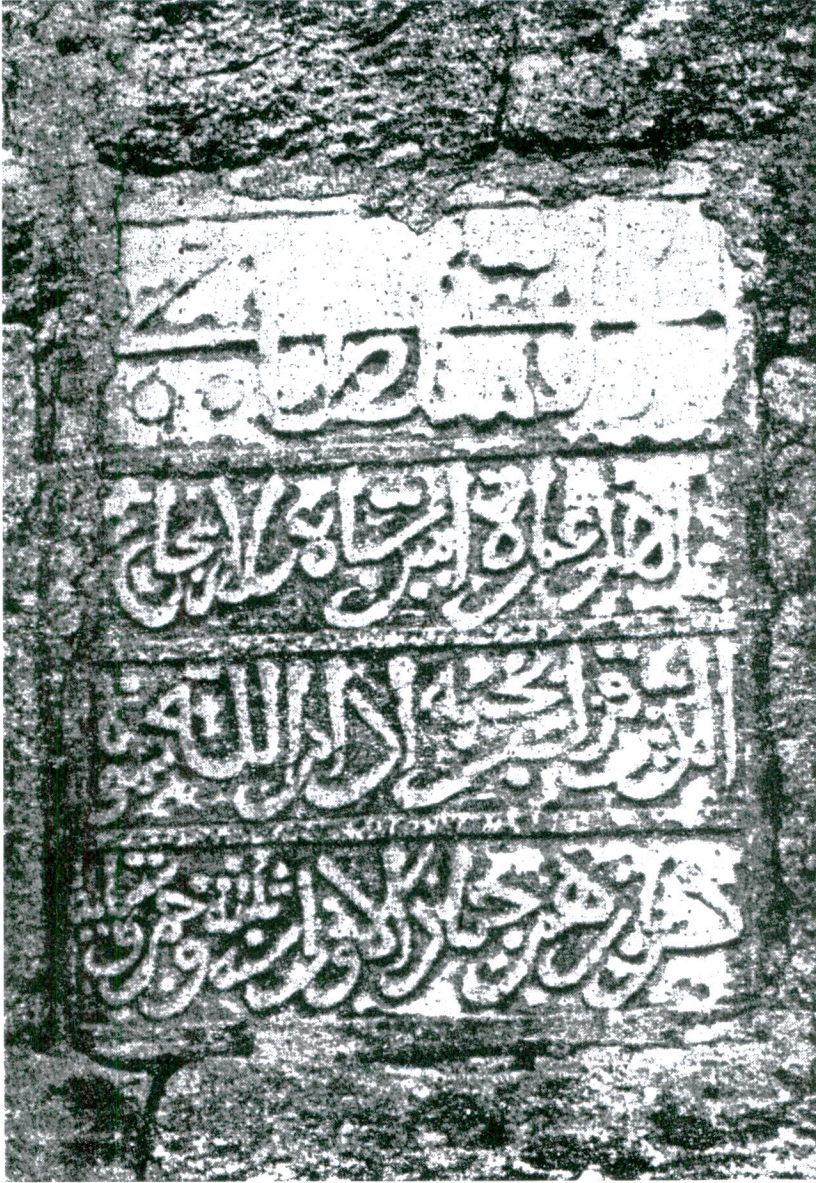
Res. 1 - Uşak-Çanlı Köprü kitâbesi (Orhan Dengiz'den).