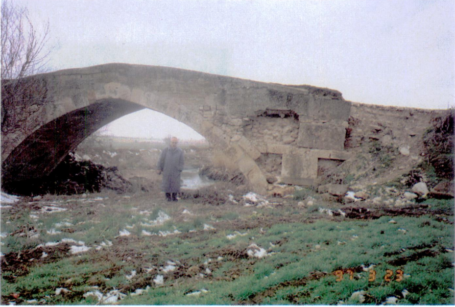
Res. 4 – Uşak, Çanlı-köprü, 1997 Martı'nda, Kaynak tarafından görünüş.