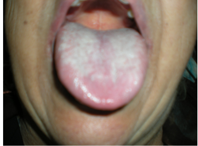
Şekil III: Hastanın 3. ayındaki kontrolünde dildeki hematoma'nın tamamen iyileşmesi