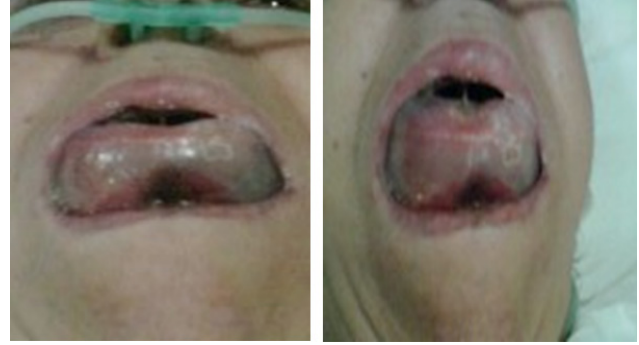
Şekil II: Alteplaz infüzyonundan 4 saat sonra gelişen masif dil hematoma

neden olan masif lingual hematoma gelişti ( şekil II ). Orotrakeal entübasyon mümkün olmadığından nazotrakeal olarak entübe edilip genel anestezi altında trakeostomi açıldı. İşlemden 3 gün sonra lingual hematoma geriledi ve trakeostomi kapatıldı. Hastanın 3. ve 6. ay kontrollerinde herhangi bir patoloji saptanmadı ( şekil III ).