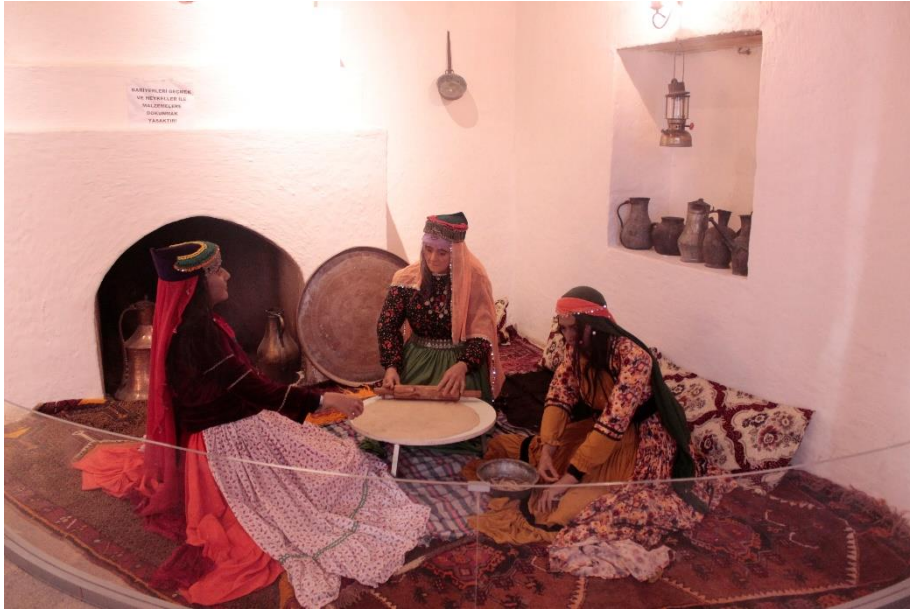
Fotoğraf 7: Eski Bayezid Evi Teşhir salonlarından Biri (Ekmek Pişiren Kadınlar).