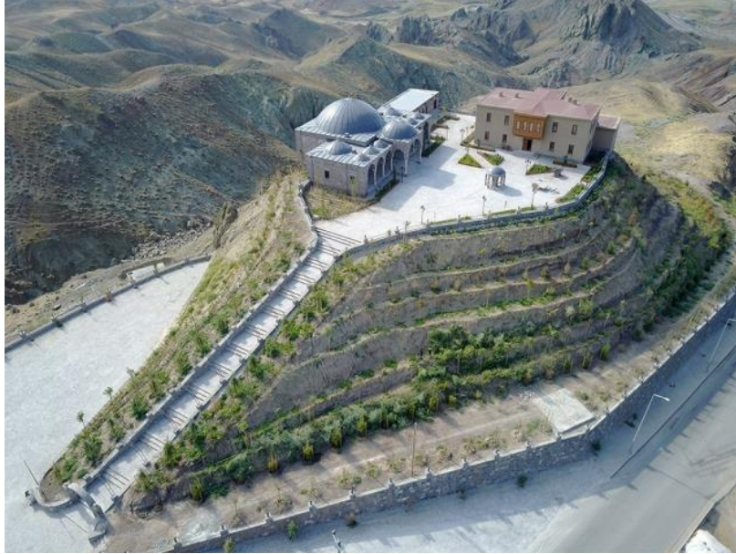
Fotoğraf 1: Ahmed-i Hani Kent Müzesinin İnşa edildiği Alanın Genel Görünümü.