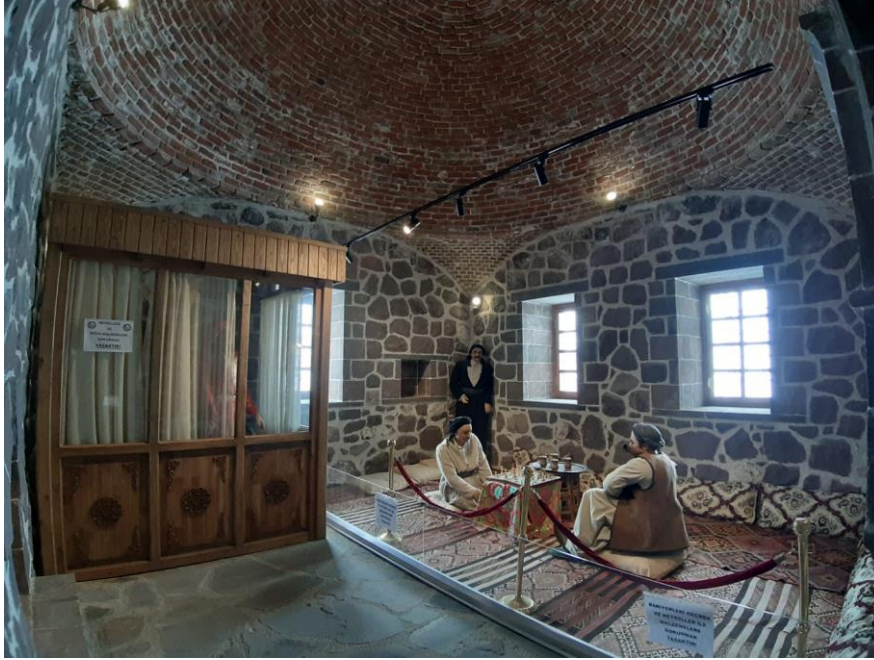
Fotoğraf 5: Müzenin Medrese Binası, Ahmed-i Hani'nin, "Mem –u Zin" Adlı Eserinin Canlandırılması.