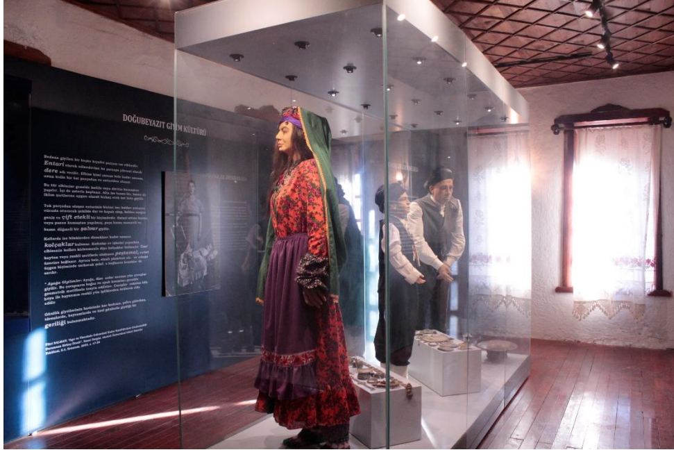
Fotoğraf 11: Eski Bayezid Evi Teşhir Salonlarından Biri Olan Yöresel Kıyafetler Seksiyonu.