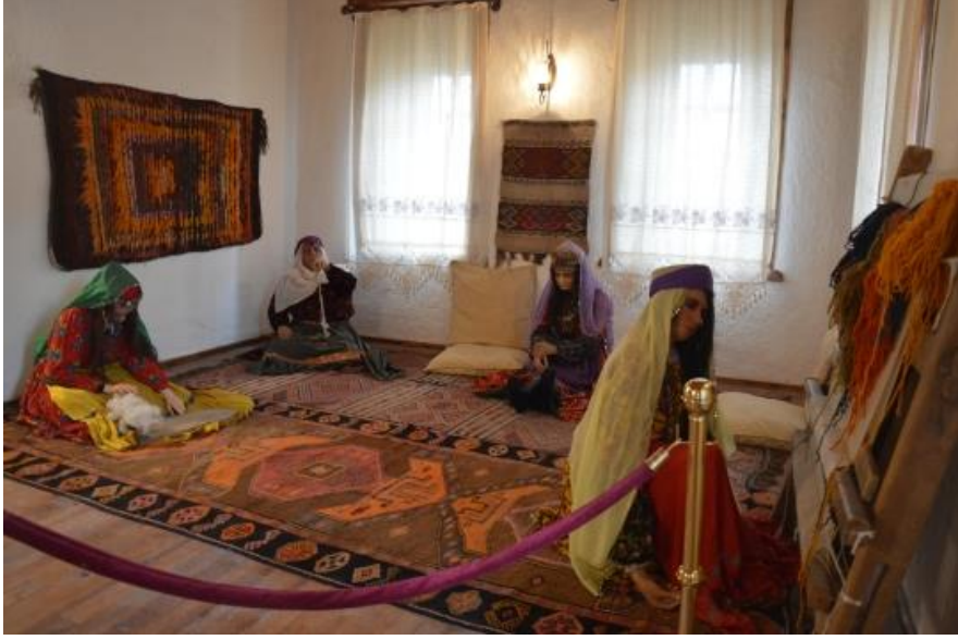
Fotoğraf 8: Eski Bayezid Evi Teşhir Salonlarından Biri (Halı, Kilim Dokuyan Kadınlar).