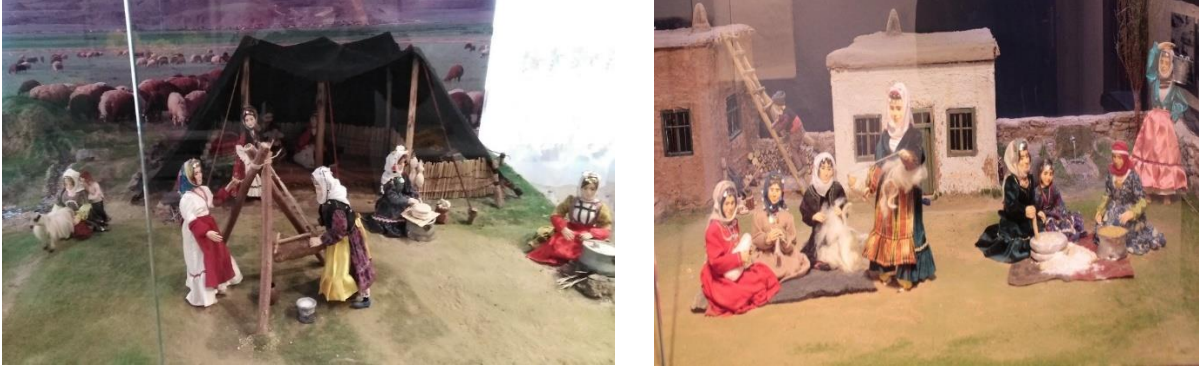
Fotoğraf 14: Eski Bayezid Evi; Köy Hayatının, Yaylacılığın Canlandırıldığı Maketlerden Bir Görünüm.