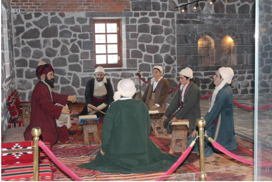
Fotoğraf 3: Müzenin medrese binası Ahmed-i Hani'nin "Akide-i İman" Adlı Eserinin Canlandırılması.