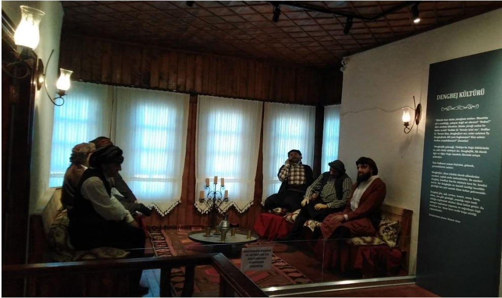
Fotoğraf 9: Eski Bayezid Evi Teşhir salonlarından Dengbej salonu.