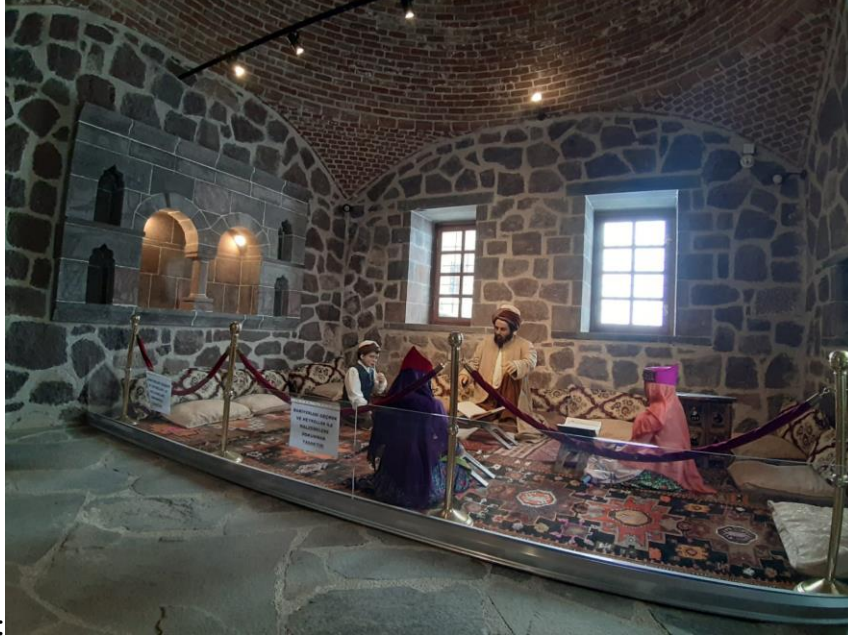
Fotoğraf 4: Müzenin Medrese Binası Ahmed-i Hani'nin "Nubahar-ı Biçukan" (Çocukların Baharı) Adlı Eserinin Canlandırılması.