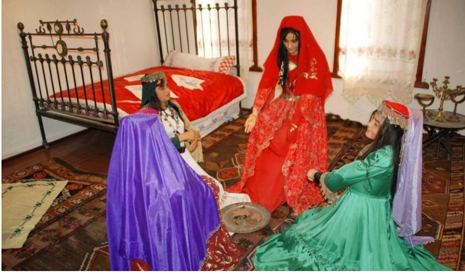
Fotoğraf10: Eski Bayezid Evi Teşhir Salonlarından Biri Olan Kına Gecesi Salonu.