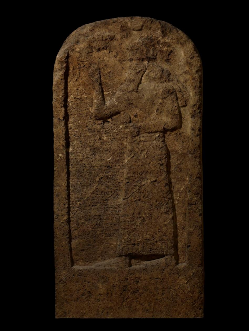
Fotoğraf 1: II. Aurnasipal'in M.Ö. 879 tarihli Yukarı Dicle Bölgesi'ne düzenlediği seferinin anısına diktirilen Kurkh Steli.