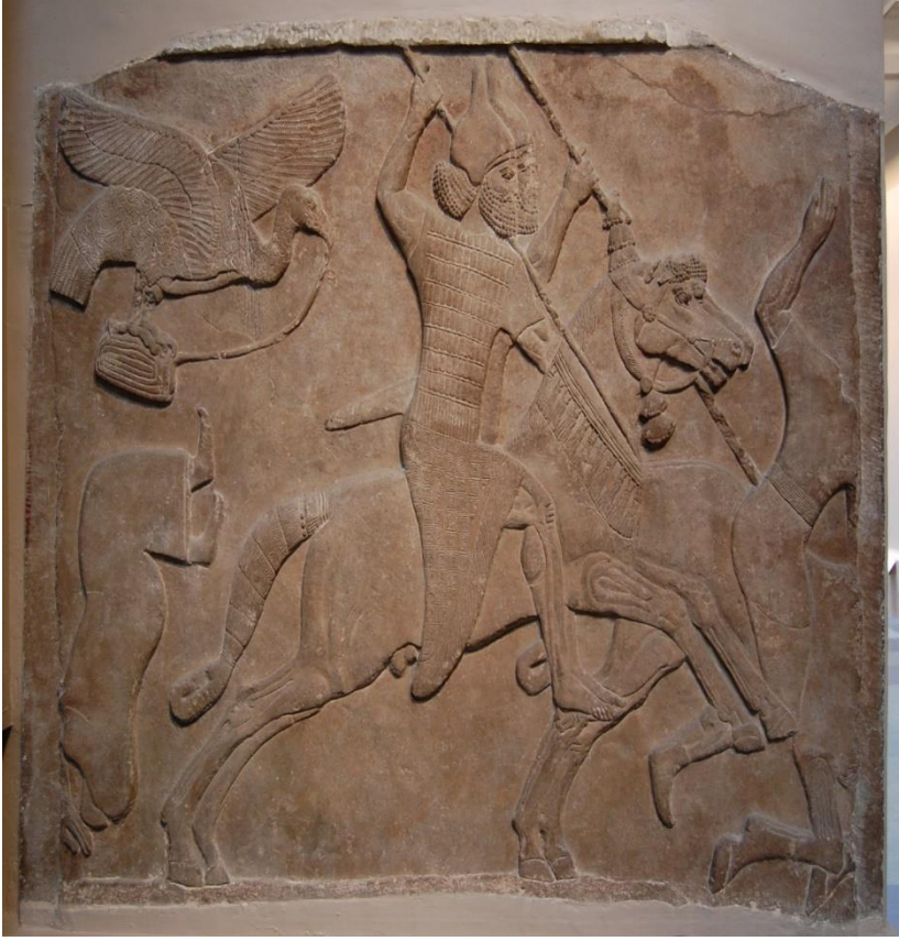
Fotoğraf 2: Yeni Asur İmparatoru III. Tiglat-pileser Dönemi'ne, yaklaşık M.Ö. 728'e tarihlenen düşmana saldıran iki Asurlu atlı askeri temsil eden kabartma propaganda tasviri. Görüntü: © The Trustees of the British Museum lisansı ile korunmaktadır.

British Museum. Müze Numarası: 118907. Kayıt Numarası: 1849,0502.10. Buluntu Yeri: Nimrud, Güneybatı Sarayı. Hafir: Sir Austen Henry Layard, Yıl: 1849.