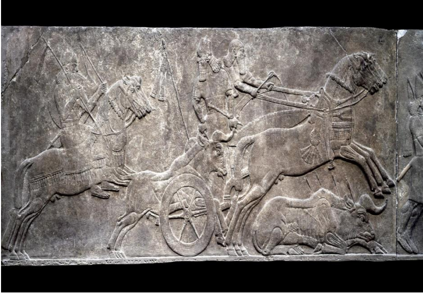
Fotoğraf 4: Asur Kralı II. Aurnasirpal'in boğa avını temsil eden ve M.Ö. 875-860 yılları arasına tarihlenen bir kabartma tasvir.

British Museum. Müze Numarası: 124532. Kayıt Numarası: 1847,0623.12. Buluntu Yeri: Nimrud, Kuzeybatı Sarayı. Hafir: Sir Austen Henry Layard, Yıl: 1846.