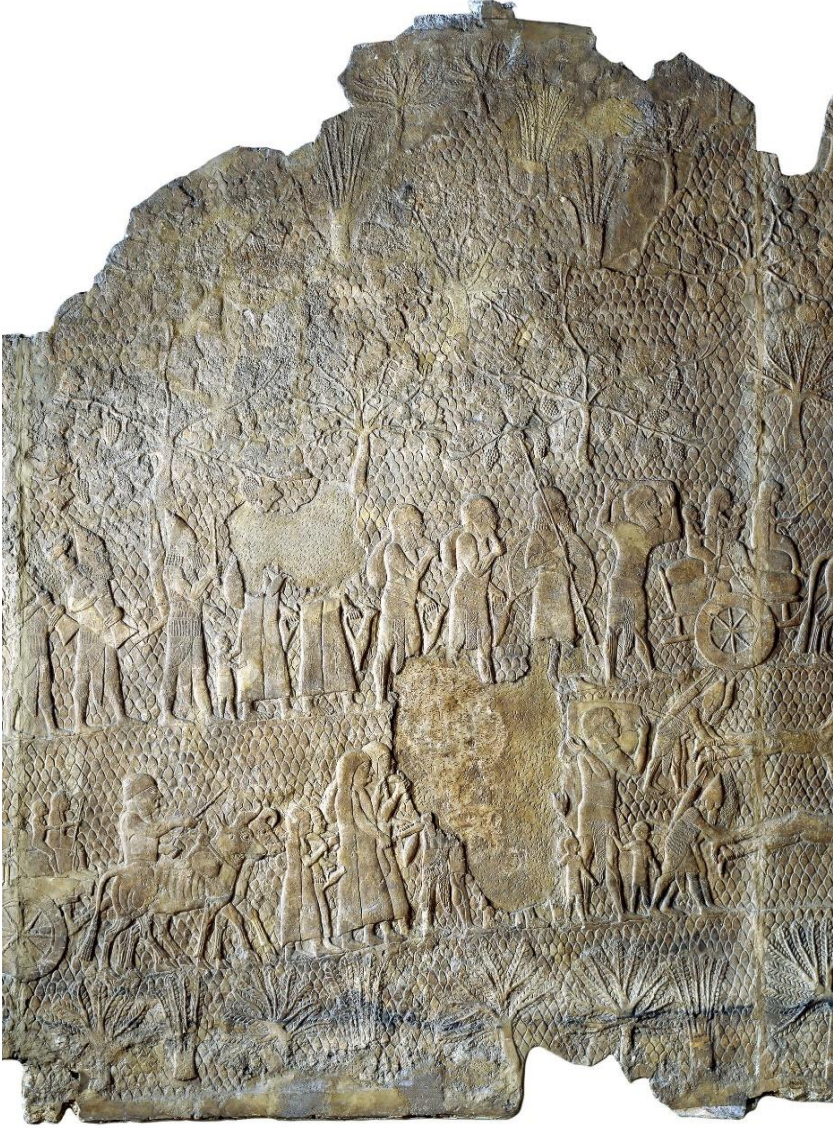
Fotoğraf 3: Yeni Asur İmparatoru Sanherib Dönemi'ne, yaklaşık M.Ö. 700-692'ye tarihlenen Lakiş Şehri kuşatmasını tasvir eden duvar paneli kabartması. Görüntü: © The Trustees of the British Museum lisansı ile korunmaktadır.

British Museum. Müze Numarası: 124907. Kayıt Numarası: 1856.0909,14. Buluntu Yeri: Ninive, Güneybatı Sarayı. Hafirler: Hormuzd Rassam, William Kennett Loftus, Sir Henry Creswicke Rawlinson, John George Taylor, Yıl: 1856.