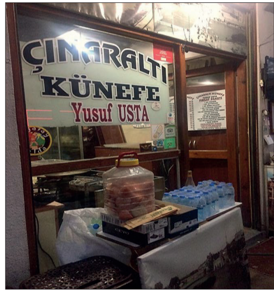
Şekil 3: Antakya’da künefe üretim mekanlarından biri: Çınaraltı Künefe (Yeni Cami Mahallesi).

Yemek ve kahvaltı dışında Antakya mutfağında tatlı kültürü de son derece gelişmiştir. Antakya mutfağının en ünlü tatlısını künefe oluşturmaktadır. Künefe yerel halkın en çok tükettiği tatlı olduğu için şehir genelinde hemen her mahallede bir yada iki künefeci bulunmaktadır. Şehri ziyaret edenlerin künefe yemek için en çok tercih ettikleri yer ise Uzun Çarşı’dır (Nesipoğlu, 2019).