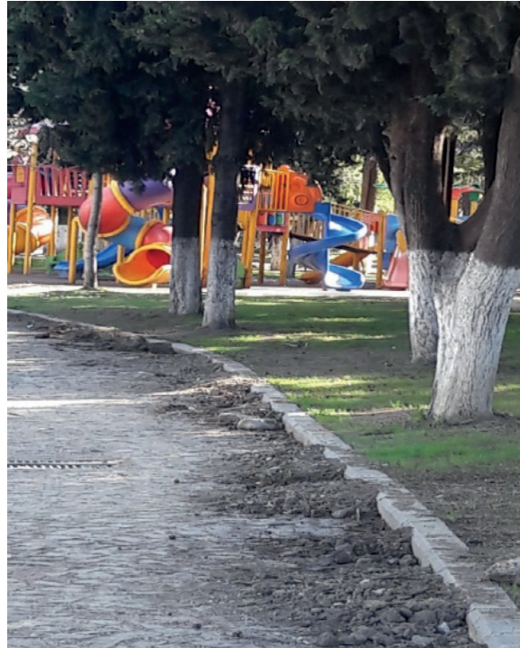
Şekil 10: Atatürk Parkı (çocuk oyun alanı). Figure 10: Ataturk Park (children's play area).