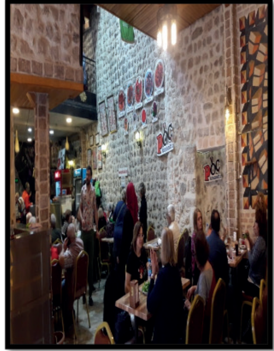
Şekil 6: PÖÇ Kebabçısı (Esnaf Lokantası). Figure 6: PÖÇ Kebab Restaurant.

Antakya'da yeme-içme olanağı sunan (lokanta, restoran, döner, köfte, kebab ve ciğer) 166 işletme bulunmaktadır. Bunların bir kısmını alkollü içecek de sunan meyhaneler oluşturmaktadır. Bunlar dışında şehirde pastane, cafe, kafeterya, kahvehane, kırathanane, çay ocağı ve fast food gibi yeme içme olanağı sunan 78 işletme daha faaliyet göstermektedir (Antakya Ticaret ve Sanayi Odası:2018).