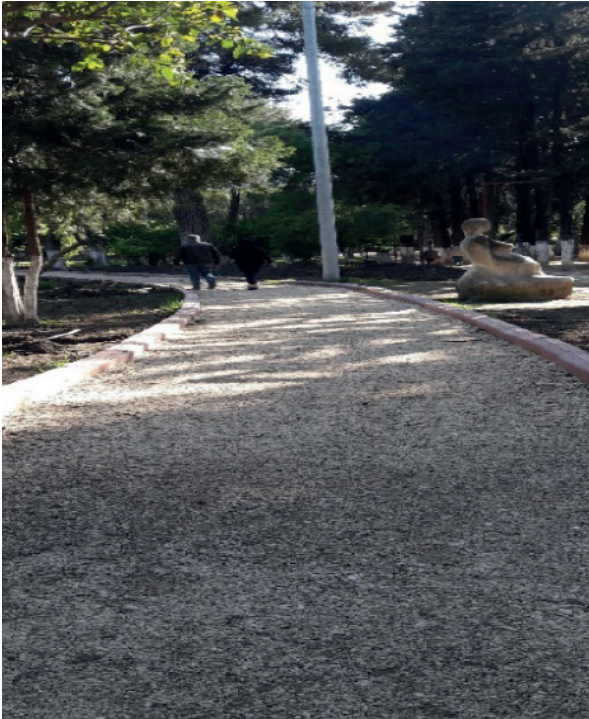
Şekil 9: Atatürk Parkı (yürüyüş yolu). Figure 9: Ataturk Park (walking).

Parklar, şehir halkının en çok ziyaret ettikleri rekreasyon alanları arasında yer almaktadırlar. Her yaş grubundan kişilere doğayla baş başa kalma olanağı sunan parklara olan ilgi yıl boyunca sürmekte, özellikle yaz aylarında daha da artmaktadır. İlginin fazla olmasına rağmen dünyanın pek çok şehrinde olduğu gibi Antakya’da da kişi başına düşen yeşil alan miktarının yeterli olduğu söylenemez. Ancak Antakya şehirdeki yeşil alan miktarının artırılması yönünde önemli bir potansiyele sahiptir. Özellikle şehrin yakınında yer alan doğal ormanlık alanların rekreasyonel kullanımının sağlanmasıyla şehirdeki kişi başına düşen yeşil alan miktarı artırılabilir.