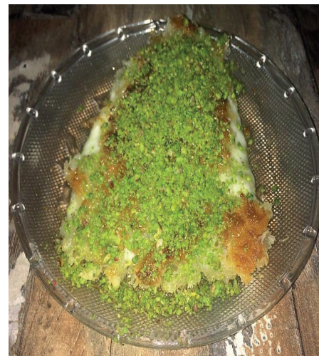
Şekil 4: Künefe.

Figure 3: One of the places producing künefe in Antakya: Çınaraltı Künefe.