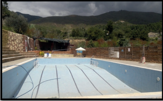
Şekil 11: Tulpar Tesisi. Figure 11: Tulpar.

Antakya’da açık alan rekreasyonel faaliyetlerinin gerçekleştirildiği mekanlar arasında parklar dışında çeşitli spor tesisleri de bulunmaktadır.