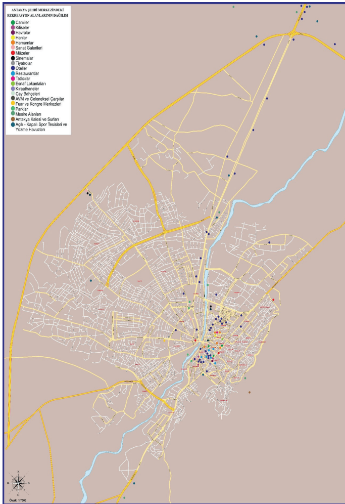
Şekil 8: Antakya'da Rekreasyonel Alanların Dağılışı. Figure 8: Distribution of Recreational Areas in Antakya.

Şehirlerde kapalı rekreasyon alanları yanında açık havada dinlenme ve eğlenme olanağı sunan mekanlar da mevcuttur. Bu alanların başında da parklar gelmektedir. Antakya'da parklar rekreasyonel anlamda en çok talep gören yerlerdir. Şehirde halkın rekreasyonel ihtiyaçlarını karşılamak için çeşitli büyüklükte 129 adet park bulunmaktadır (Hatay Belediyesi Park Bahçe ve Yeşil Alanlar Dairesi Başkanlığı, 2018). Şehir halkının en çok ilgi gösterdiği parkları şu şekilde sıralamak mümkündür; Antakya şehir merkezinde yer alan Atatürk Parkı (Cumhuriyet Mahallesi'nde), DSİ 1. Etap Parkı yeni adıyla 15 Temmuz Milli İrade Parkı (Kanatlı Mahallesi'nde), Vali Ürgen Parkı (Kanatlı Mahallesi'nde), Yunus Emre Parkı (Kışlasaray Mahallesi'nde) ve 100. Yıl Parkı (Haraparası Mahallesi'nde) dir.