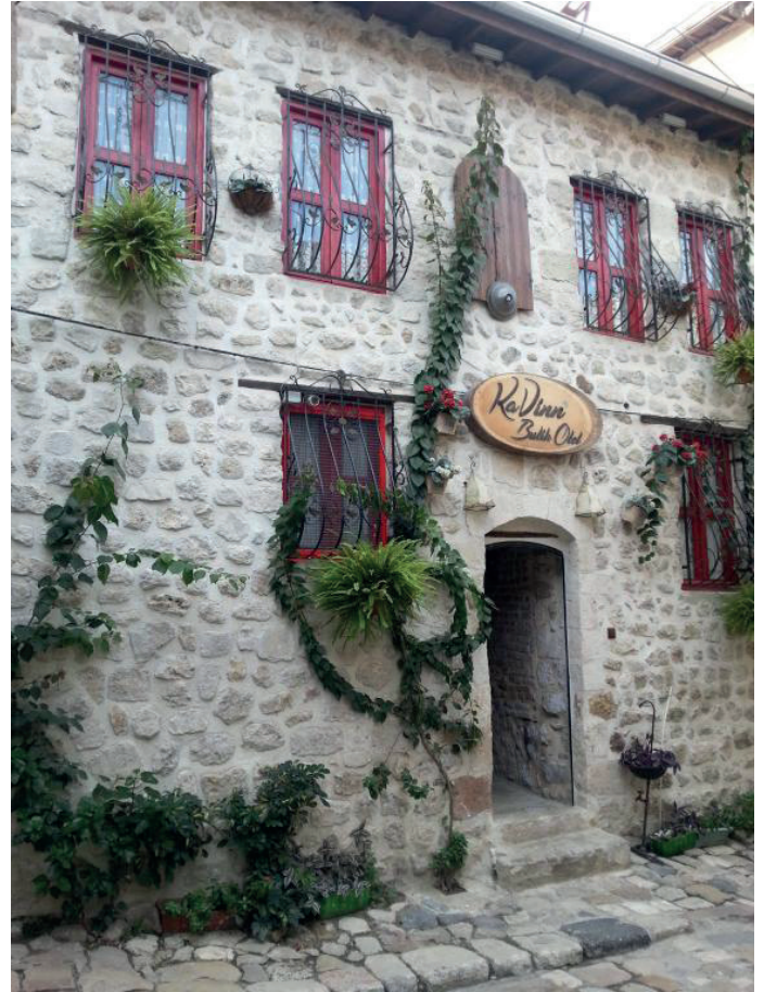
Şekil 2: Kavinn Butik Otel. Figure 2: Kavinn Boutique Hotel.

Antakya’da tarihi değere sahip mekânlar arasında eski mahalleler ve caddeler, dini yapılar (camiler, kiliseler, havralar), çarşılar ve hamamlar bulunmaktadır. Bunlardan eski mahalleler (Zenginler Mahallesi, Yeni Cami Mahallesi) Antakya’nın doğusunda yer almaktadırlar. Bu mahalleler geleneksel mimari örneği Antakya evleri ve dar sokaklarıyla Antakya’nın en çok ilgi gören rekreasyonel alanlarını oluşturmaktadırlar. Mahallelerdeki eski Antakya evleri, bölgenin geleneksel mimarisi ve yaşayış tarzını yansıtmaları açısından son derece önemlidirler. Dar sokaklarla birbirlerinden ayrılan evler, aile mahremiyetini sağlayan yüksek duvarlarla çevrilidirler (Cengiz, 2014). Genellikle tek ya da iki katlı olarak inşa edilen, avlulara sahip bu evlerin hemen hepsinin avlusunda Akdeniz iklimine özgü portakal ve limon ağaçlarının yanı sıra, süs havuzları evlerden bağımsız olarak inşa edilen mutfak, banyo ve tuvaletleri bulunmaktadır (Çelebi, 1982). Evlerin bazıları sıvaları dökülmüş kapıları kırık ve bakımsız durumda iken, bazıları ise restore edilerek butik otel (Çiçekli Konak, Jasmin Konak Butik Otel, Kavinn Butik Otel vb.) lüks restaurant-meyhane (Konak Restaurant, Müzeyyen Restaurant, Avlu Restaurant, Leban Restaurant vb.), kahvaltı evi (Antakya Kahvaltı Evi, Hatay Sultan Sofrası), cafe, hediyelik eşya dükkânı ve müze (Hatay Tıbbi ve Aromatik Bitkiler Müzesi) olarak kullanılmaktadırlar (Sargın ve Dinç, 2017).