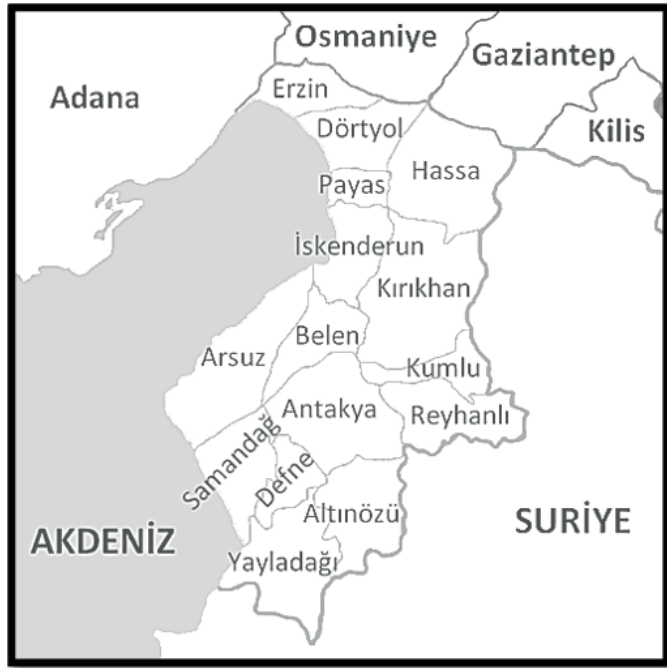
Şekil 1: Antakya'nın Konumu. Figure 1: Location of Antakya.

Makedon Kralı Büyük İskender'in ölümünden sonra imparatorluk toprakları dört komutanı arasında paylaşılmış ve Antakya şehrinin üzerinde kurulduğu topraklar Komutan I. Selevkos Nikator'a düşmüştü. Komutan bu topraklar üzerinde oğlu I. Antiokhos Soter'in adına ithafen Antiokeia (Antakya) şehrini kurmuştur. Şehir, zamanla büyüyerek Selevkosların merkezi olmuştur. M.Ö. 64'te Roma topraklarına katılan şehir, Roma dönemi