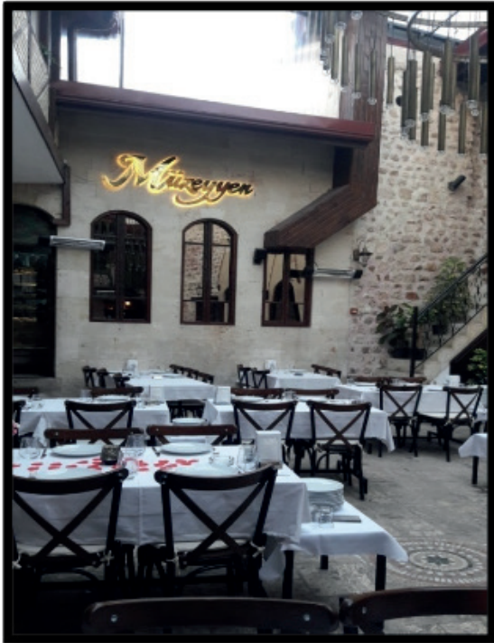
Şekil 5: Müzeyyen Restoran. Figure 5: Müzeyyen Restaurant.

Antakya'nın geleneksel mutfak kültürünün yaşatılmasında, şehirde faaliyet gösteren fırıncılar, kasaplar, taticılar ve lokantacıların rolü büyüktür. Özellikle şehir genelinde yayılmış olan kasaplar ve fırınlar geleneksel mutfağın yaşamasında çok önemli görev üstlenmiş durumdadırlar. Bunlar kendi hazırladıkları geleneksel yemeklerin satışı yanında, yerel halkın öğle ve akşam yemekleri siparişlerini alarak koordineli bir şekilde çalışmaktadırlar. Örneğin Antakya'nın en ünlü yemeklerinden olan "kâğıt kebabı" yada "tepsi kebabı" siparişi alan kasaplar, sipariş için hazırladıkları kebabı kendilerine en yakın fırına gönderirler. Fırın kasapların hazırladığı kebabları geleneksel olarak odun ateşinde pişirir ve istenilen saate hazır hale getirir, siparişi veren kişi kebabı fırından alır. Kasap ve fırıncılar arasındaki bu işbirliği kebablar dışında Antakya mutfağının diğer geleneksel yiyeceklerinin (lahmacun, biberli ekmek, pide vb) hazırlanmasında da sürdürülmektedir. Bu işbirliğinin varlığı geleneksel Antakya mutfağının günümüzde de yaşamasını sağlamaktadır (Nesipoğlu, 2019).