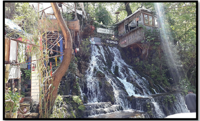
Şekil 12: Harbiye Şelaleleri. Figure 12: Harbiye Waterfalls.

Antakyalıların şehir merkezi dışında rekreasyonel anlamda en çok ziyaret ettikleri yer Harbiye (Daphne) Mesire Alanı ’dır (Şekil:12). İçerisinde şelalelerin de bulunduğu Harbiye mesire alanı antikçağda Selevkoslar döneminden beri, doğal, tarihsel ve kültürel çekiciliği nedeniyle dinlenme alanı olarak kullanılmaktadır (Kaymaz ve Özşahin, 2015). Antakya’nın güneyinde şehir merkezine 8 km uzaklıkta olan Harbiye, bol oksijenli temiz havası, kızılçam ormanları, irili ufaklı şelaleleri ile ilgi çekmektedir. Şelaleler yakınında yer alan çok sayıda cafe, restoran ve piknik alanlarıyla Harbiye, yerel halkın yanı sıra Antakya’yı ziyarete gelen yerli ve yabancı turistlerin de mutlaka ziyaret ettikleri yerler arasındadır. Harbiye’deki restoranlar sundukları geleneksel Antakya yemekleri ile bölgenin çekiciliğini daha da arttırmaktadırlar.