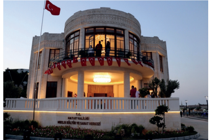
Şekil 7: Meclis Kültür ve Sanat Merkezi (Kanatlı Mahallesi).

Sanat Merkezi ” (Kanatlı Mahallesi) dir (Şekil:7). Bunlardan Meclis Kültür ve Sanat Merkezi olarak kullanılan yapı, geçmişte Hatay Devletinin parlamento binası olarak kullanılmaktaydı. Yakın zamanda gerçekleştirilen restorasyon çalışmasıyla özgün haline dönüştürülen yapı, 23 Temmuz 2021’de gerçekleştirilen açılış töreniyle sadece kültür ve sanat etkinliklerinin gerçekleştirildiği bir kullanıma sahiptir. Bu iki merkez dışında Güngör Ottoman Palace (Akçaova Mahallesi), Mozaik Otel (İstiklal Caddesi) ve Narin Hotel (Cumhuriyet Mahallesi) gibi bazı oteller de kongre ve konferanslar için kullanılmaktadırlar. Antakya’da yılın belli dönemlerinde fuarlar düzenlenmektedir. Şehirdeki tek fuar alanı ise Akasya Mahallesi’nde bulunmaktadır. 2015 yılında yapımına başlanan ve 2016’da faaliyete geçirilen fuar alanında, pek çok ulusal ve uluslararası fuar (yapı malzemeleri, tarım makineleri, mobilya ve kitap gibi) gerçekleştirilmiştir (Elka Fuar, 2021).