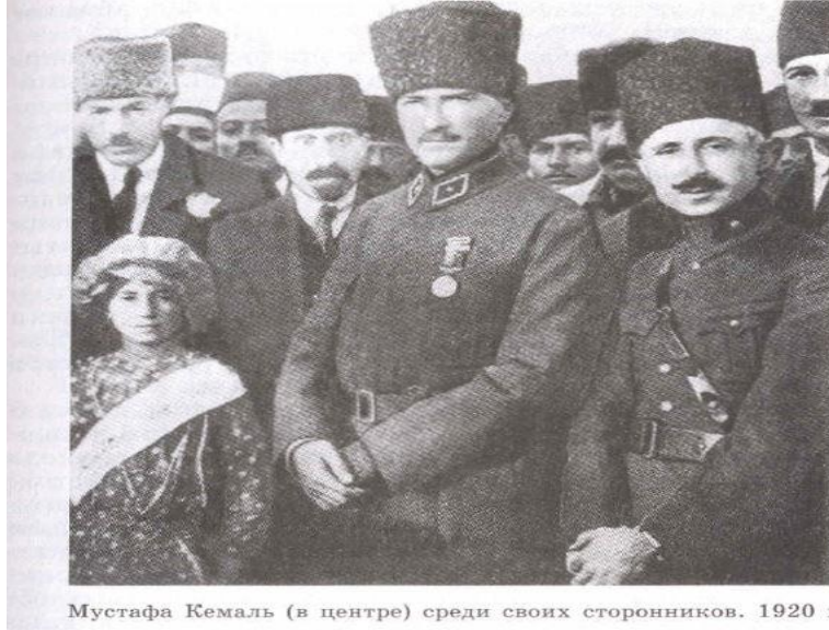
Мустафа Кемаль (в центре) среди своих сторонников. 1920 г.

Şekil 11. Mustafa Kemal (Merkezde) Yandaşları ile Beraber 1920. (9. Sınıf Genel Tarih S.111)