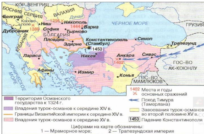
Şekil 1. XIV-XV Yüzyıllarda Osmanlı İşgallerini Gösteren Bir Harita

Yayıma, genişleme, işgal, istila gibi kavramların tarih öğretiminin perspektif oluşturan araçlar olduğu göz önüne alınırsa, buradaki Osmanlı yayılışının özellikle Balkanları işaret eden bir haritada işgal olarak tanımlanması Rusya’nın konuya resmi bakışını gösterir gibidir. Benzer bir biçimde Çek, Polonya ve Slovak tarih kitabı yazarları da genelde Osmanlı askeri avantajları, yayılması ve Türklere karşıtlık üzerine odaklanmışlardır (Biricky, 2013: 114).