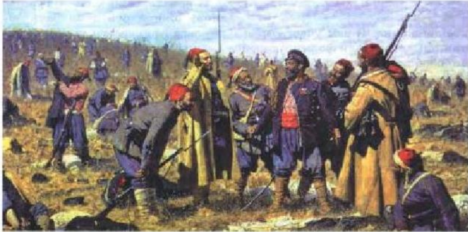
Турецкие солдаты после боя (русско-турецкая война 1877—1878 гг.). Художник В. В. Верещагин

Şekil 9. Türk Askerleri Savaştan Sonra (1877-1878 Rus-Türk savaşı) (Ressam V. V.Vereshagin)