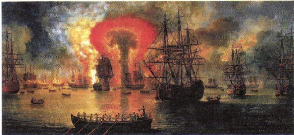
Сожжение турецкого флота в Чесменской бухте. Художник Я. Хаккерт

Şekil 8. Çeşmede Türk filosu nasıl yakıldı (Ressam Y. Hakkert)