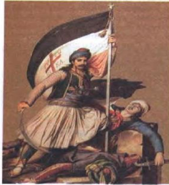
Греки в борьбе за свободу

8. sınıf Genel Tarih kitabında (s.54) bu resimde bir Türkü katlettikten sonra bayrağını kaldırmış ve elinde kılıcıyla halk kahramanı görüntüsü veren bir Yunan savaşçısı var. Bu tür simgesel olarak bir topluluğu aşağılaması sebebiyle resimlerin ders kitaplarında kullanılması doğru değildir. Zira “resimler sloganlara benzer ve belleğin bir bölümü hatırlaması için anahtar işlevi görebilir” (Pingel, 2003: 14). Benzer biçimde Slovak ders kitaplarında yer alan bazı görsellerin de Osmanlı ve Türkler