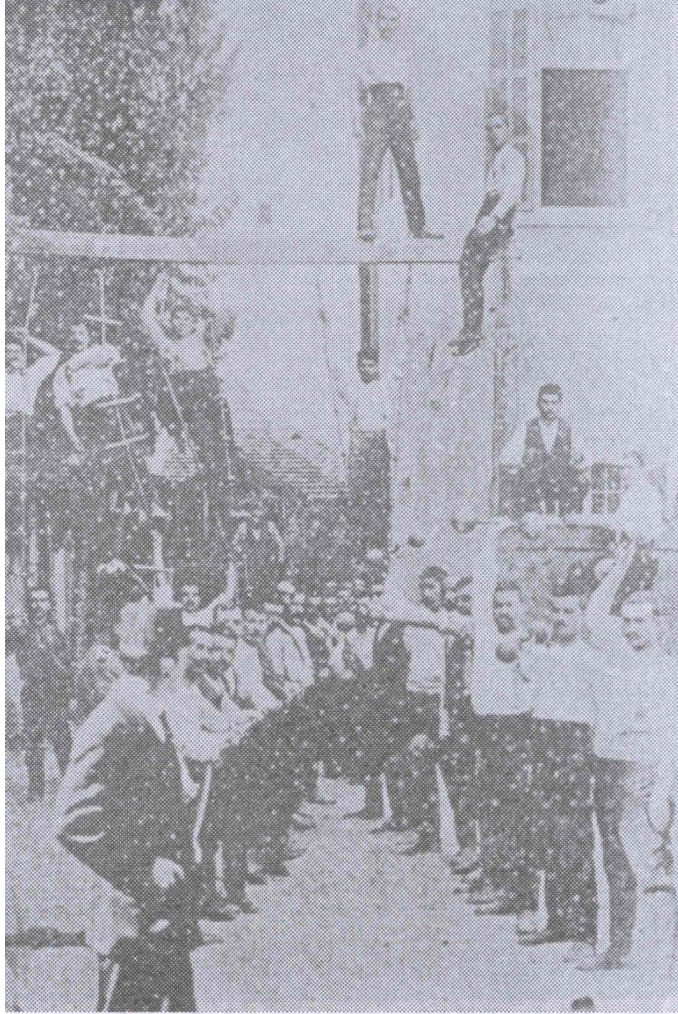
Beyrut Polis Okulu'nda beden eğitimi çalışmaları

Bu çalışmalardan Osmanlı polisinin görev esnasında önüne çıkabilecek fizikî engelleri aşmaya büyük önem verdiği anlaşılmaktadır.