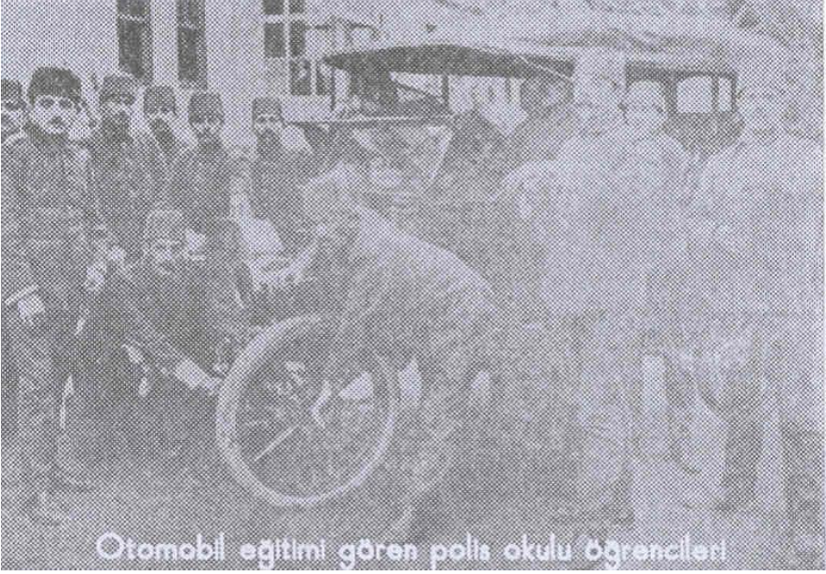
Otomobil eğitimi gören polis okulu öğrencileri