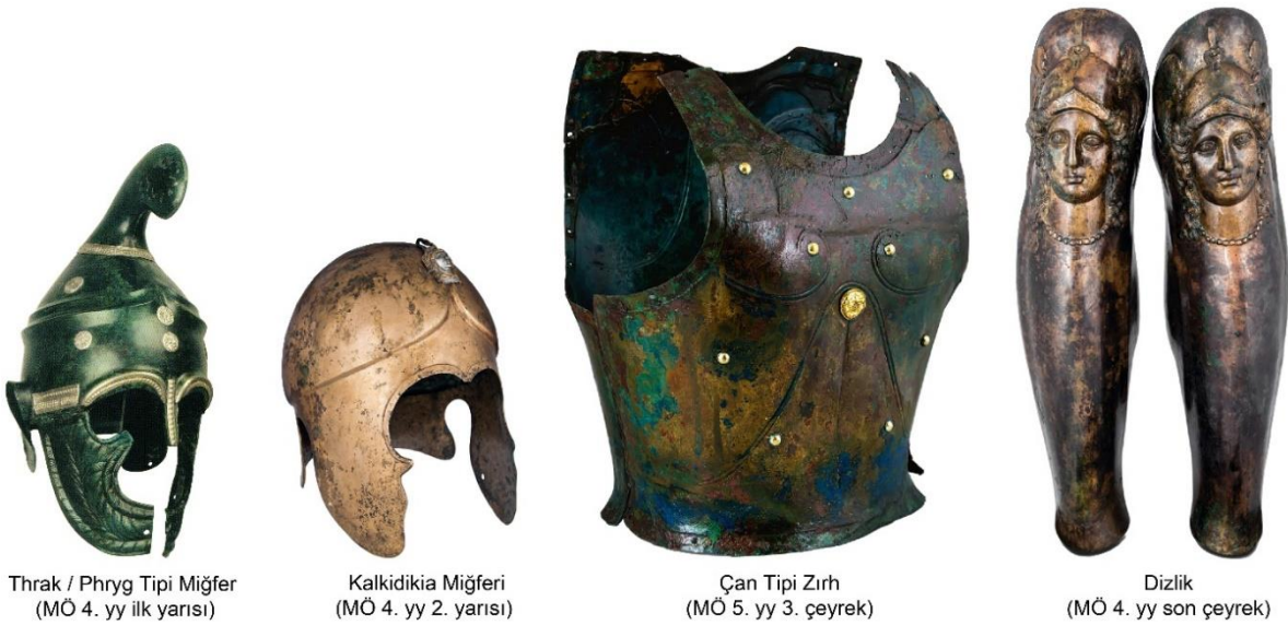
Thrak / Phryg Tipi Miğfer (MÖ 4. yy ilk yarısı)