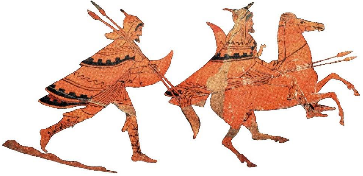
Figür 1 Kırmızı Figür Pelike Üzerinde Thrak Piyade (Peltast) ve Süvarisi (MÖ 430-425)