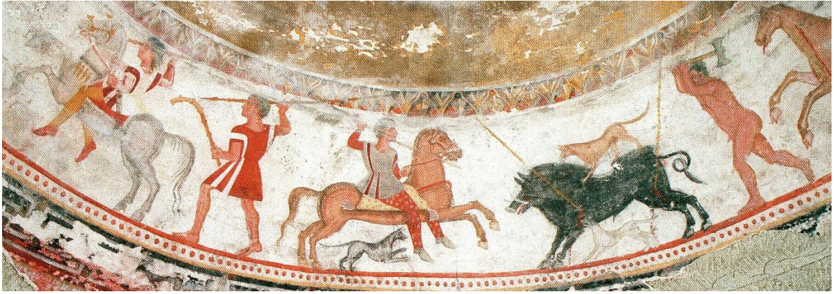
Figür 2 Aleksandrovo Tümlüsü, Thrakların Av Sahnesi (MÖ 4. yüzyıl)