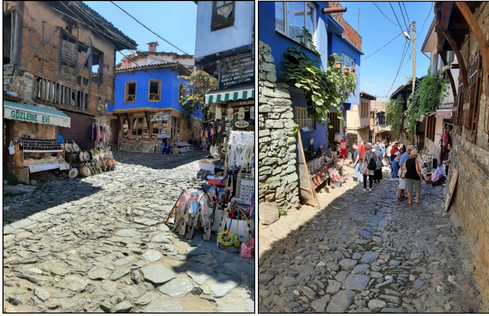
Şekil 4. Cumalıkızık köyü konutlarda meydana gelen bozulmalar ve yeni yapılaşma

Cumalıkızık köyü doğal miras olarak günümüze ulaşan önemli yerleşmelerden olmasına rağmen alanda yeni yapılaşma ya da dokuya uygun olmayan eklemeler yapıldığı gözlemlenmiştir. Özellikle köyün bazı kesimlerinde bulunan mahallelerde betonarme iskelet veya tuğla duvar ile yapılan yeni binalar ve kırsal evlere plastik esaslı pencerelerin yapıya eklenmesi mimari kimliğe zarar veren değişimlerdir. Kırsal bölgede mimari anlamda bozulmalar ve bakımsızlıktan doğan eskimeler gözle görülebilir biçimdedir (Şekil 5). Ayrıca geleneksel ahşap konutların ziyaretçilere açılmasıyla ortaya çıkan altyapı sorunları ve mutfak birimlerine eklenen ya da elektrik tesisatı sonradan artırılan tarihi yapıların yangın riski ortaya çıkmaktadır. Bunun yanında geleneksel konutlara tabela veya tanıtım amaçlı asılan levhaların estetik açıdan yörenin genel görünümüne zarar vermektedir. Cumalıkızık köyü önceleri daha çok tarıma dayalı ekonomiye sahipken son zamanlarda turizm faaliyetlerinin artmasıyla beraber ekonomi gelirleri de artmıştır. Ancak köydeki birçok evin benzer işlev ile turizme yönelmesi sonucu ziyaretçilerden gelen ekonomik kaynağın bölünmesine neden olmaktadır. Buna bağlı olarak maddi sıkıntı yaşayan aileler evlerini boşaltmakta ya da gerekli bakımı yaptıramamaktadır.