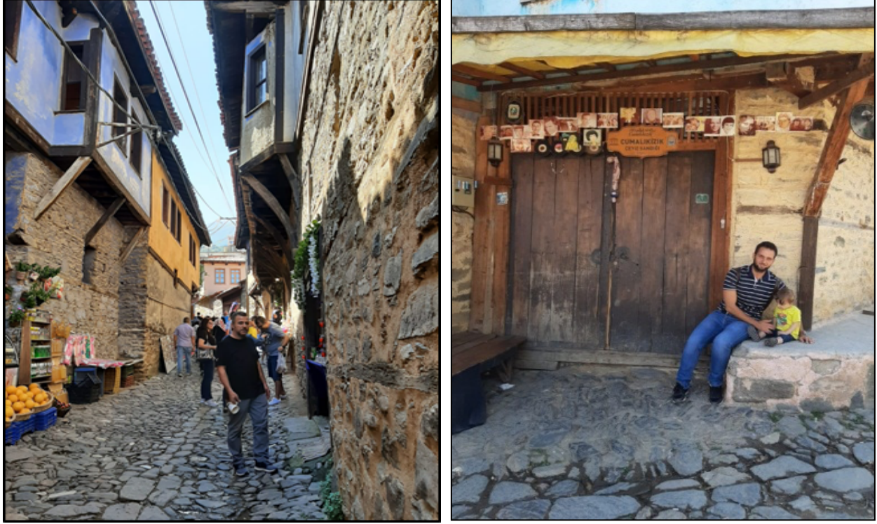
Şekil 3. Cumalıkızık köyü geleneksel konutları