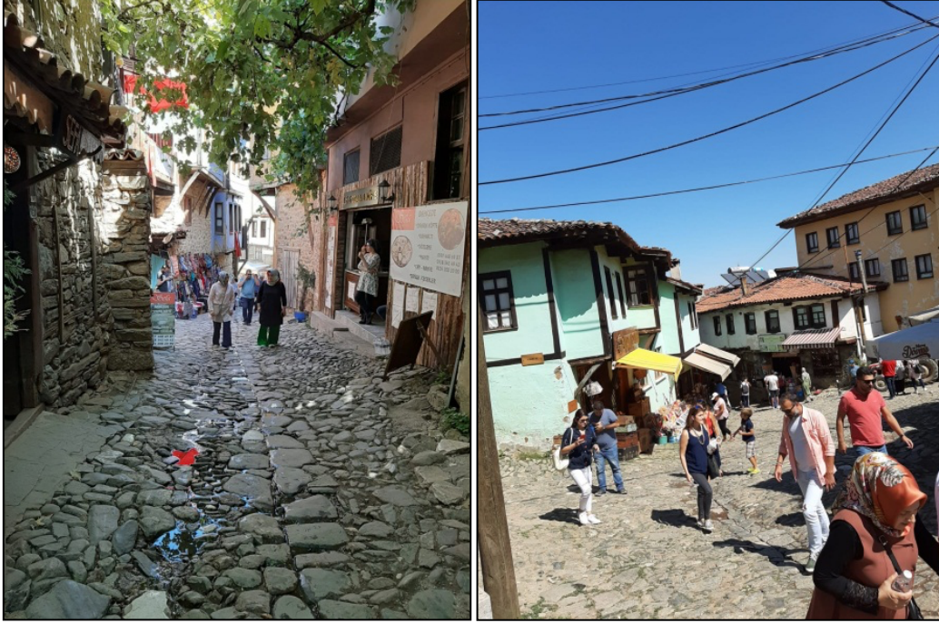
Şekil 5. Çevrede bulunan konutlardaki fiziksel eskimeler ve yeni yapılaşma etkileri