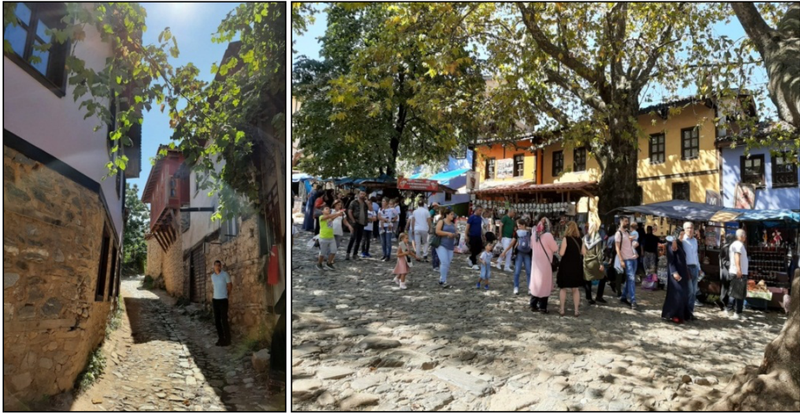
Şekil 2. Cumalıkızık köyü geleneksel evleri ve meydanı

Cumalıkızık köyünde bulunan geleneksel konutlar, Osmanlı sivil mimarisinin özelliklerini gösteren ve aynı zamanda yöre kültürünün de yansıması niteliğini taşıyan evlerdir. İki veya üç katlı olan geleneksel konutların zemin katları ahşap hatıllı moloz taş duvar, üst katları ise kerpiç dolgu ahşap iskelet sistem ile yapılmıştır (Şekil 2). Geleneksel konutların zemin katlarında ahır, depo, samanlık, wc ve mutfak gibi mekânlar bulunmaktadır. Geleneksel konutların üst katlarında ise yapının nitelikli mekânları yer almaktadır. Oda ve sofa birimlerinden oluşan bu katlar kerpiç dolgu ahşap iskelet yapım sistemi ile oluşmaktadır (Perker ve Akıncıtürk, 2011). Günümüzde özellikle zemin katta mutfak ve ıslak hacimler üst katlarda ise ziyaretçilere yönelik odalar ile ev sahiplerinin yatma bölümleri bulunmaktadır. Ziyaretçiler kahvaltı veya kafeterya olarak iletilen konuta girdiğinde onlara yer sofralarıyla yeme-içme imkânı ve dinleme için ayrılan oda veya sofalarda vakit geçirmeleri sağlanmaktadır. Geleneksel konutların kapı önlerinde yerel halk tarafından ziyaretçilere yöresel ürünlerin ve yiyeceklerin tanıtımı ile satışı yapılmaktadır. Bu bakımdan kırsal bölge yerel halkıyla yaşamına devam ettiği ve kültürlerini turizme açtıkları görülmektedir.