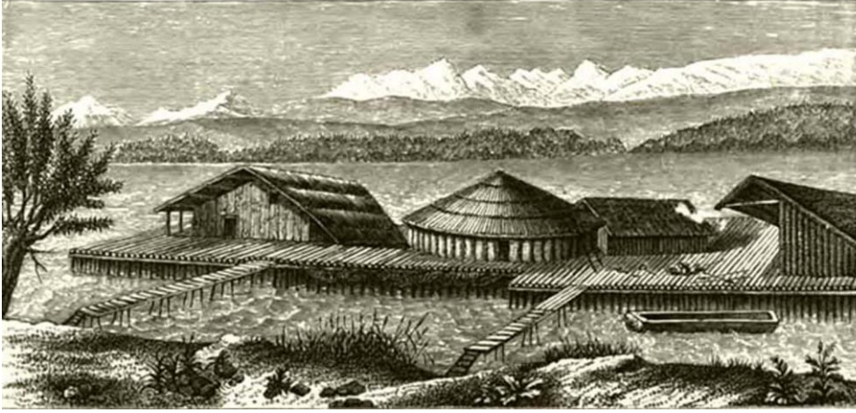
Şekil 1. Ferdinand Keller 1854 tarihli göl evleri restitüsyon çizimi.