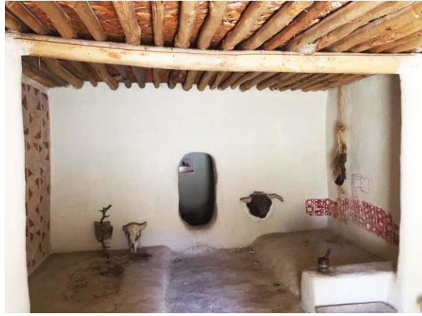
Şekil 17. Çatalhöyük evi canlandırması.

2000’li yılların başında Kırklareli Aşağı Pınar kazı alanında tarihöncesi kazı alanlarında koruma ve sergileme konusu farklı bir yaklaşımla ele alınmıştır. Kazı çalışmalarıyla açığa çıkarılan mimari buluntuların iz niteliğinde olması ve görsel açıdan algılanabilirliğinin zorluğu sebebiyle; kazıda saptanan mimariye uygun ahşap yapıların inşa edildiği bir açık hava köy müzesinin kurulmasına karar verilmiştir. Müze içinde inşa edilen ahşap evler ile içlerinde yer alan canlandırmalar ve bilgilendirme panolarıyla, kazı çalışmalarını ve tarihöncesi yaşamını topluma aktarmak amaçlanmıştır (Eres ve Özdoğan, 2016; Kırklareli Projesi, 2020) (Şekil 18).