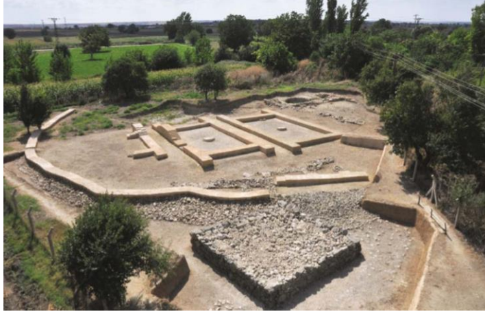
Şekil 16. Kanlıgeçit yerleşimi koruma – sergileme uygulaması (Kaynak: Arı, Eres ve Demirtaş, 2010, s.240).