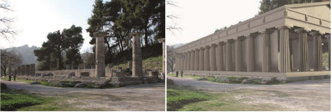
Şekil 8. Hera Tapınağı'nın çıplak gözle ve ArcheoGuide uygulaması aracılığıyla görünümü.

uygulama, ziyaretçilere gerçek ve sanal dünyaya ait görüntü katmanlarını bir arada aktarmaktadır. Antik kentin en önemli yapılarından olan Hera Tapınağı'na aynı bakış noktasından çıplak gözle bakan bir ziyaretçi yalnızca mevcut kalıntıları görmekte iken, ArcheoGuide uygulaması aracılığıyla alanı deneyimleyen ziyaretçi mevcut yapı ve doğal çevre içerisinde Hera Tapınağı'nın rekonstrüksiyonunu görmektedir. Benzer şekilde; ArcheoGuide uygulaması aracılığıyla ziyaretçiler antik stadyumda sanal atletlerin yarışını deneyimleme olanağı bulmaktadırlar. Bu sunum yöntemi; mevcut kalıntılara herhangi bir müdahalede bulunmadan, ziyaretçilere kalıntıların özgün hallerini sunma ve kentin Olimpiyat Oyunları'yla olan kültürel bağlamını aktarma imkânı sağlamaktadır (Archeoguide, 2001) (Şekil 8).