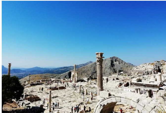
Şekil 20. Sagalassos antik kenti (Kaynak: Müge Cengiz Kişisel arşivi).

2018 Troya Yılı'nda inşası tamamlanan Troya Müzesi ve Troia ören yerinin hemen yanında yer alan Tevfikiye köyünde gerçekleştirilen Arkeo-Köy projesi; yerleşim ölçeğinde tarihsel bağlam üzerinden gerçekleştirilen yenileme, restorasyon, peyzaj düzenlemeleri, satış alanlarının oluşturulması, köy müzesi kurulması vb.