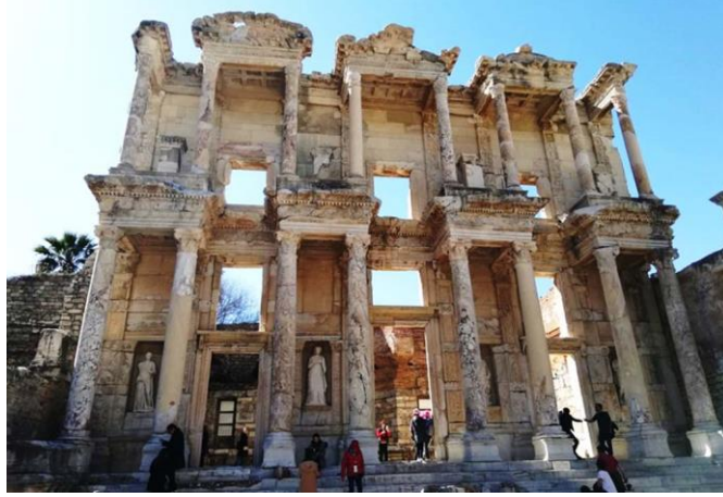
Şekil 12. Efes Celsus Kütüphanesi