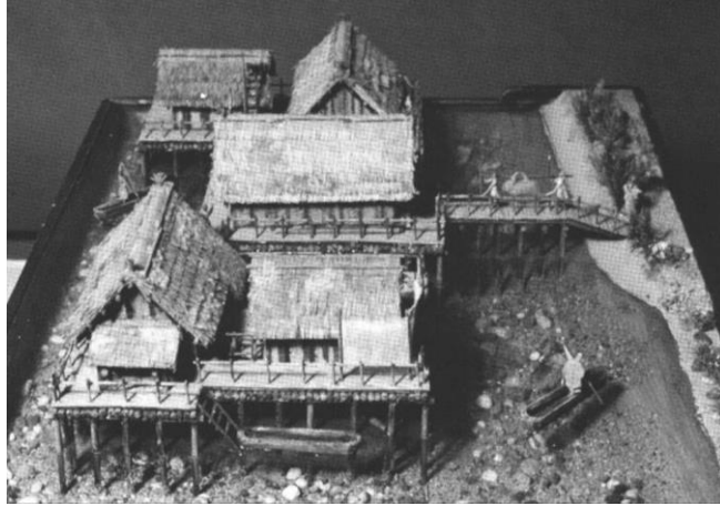
Şekil 2. Ferdinand Keller'in restitüsyon çizimlerinden yararlanarak 1870'li yıllarda yapılan göl evleri maketi ( Kaynak: Bandi, 1979).

19. yüzyılın ikinci yarısında tarihöncesi dönem kültürleri müze ortamında restitüsyon çizimleri ve maketlerle sergilenirken; dünya fuarlarında da 'geleneksel yaşamın sergilenmesi'ne yönelik çalışmalar önemli bir yer edinmiştir. 1873 yılında Viyana Dünya Fuarı'nda ilk kez Avrupa'nın farklı bölgelerinden çiftçi evlerinin 1/1 ölçekli modelleri sergilenirken; 1878 yılı Paris Dünya Fuarı'nda ilk defa bir İsveç çiftçi evinin iç mekânı canlandırılmıştır. Geleneksel kültüre ait bu canlandırma ziyaretçilerin evin açık kısmından geleneksel bir çiftçi evinde olması gereken tüm nesnelere özgün yerlerinde görebilmelerine olanak sağlamış ve oldukça ilgi çeken bir sunum yöntemi olmuştur (Eres, 2009).