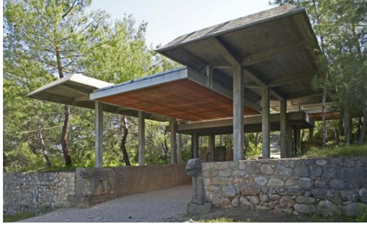
Şekil 10. Karatepe – Aslantaş koruma çatısı.

Karatepe-Aslantaş'taki koruma çatısı uygulamasına eş zamanlı biçimde, 1960'ların başında gerçekleştirilen bir diğer uygulama; Konya Alaeddin Köşkü'ne ait kerpiç duvar kalıntılarının üzerine inşa edilen koruma çatısıdır. Kent içinde yer alan kalıntıların yerinde korunarak sergilenmesi amacıyla yapılan çatı; hem kent arkeolojisi bağlamında hem de erken dönem koruma çatısı uygulamalarından biri olarak öncü bir çalışmadır (Eres ve Özdoğan, 2016). Koruma çatısı 2018 yılında yıkılma tehlikesi bulunduğu gerekçesiyle kaldırılarak yerine; doğrudan kalıntıların üzerine betonarme tamamlamaların yapıldığı, tartışmalı bir restorasyon uygulaması gerçekleştirilmiştir (Arkeofili, 2018) (Şekil 11).