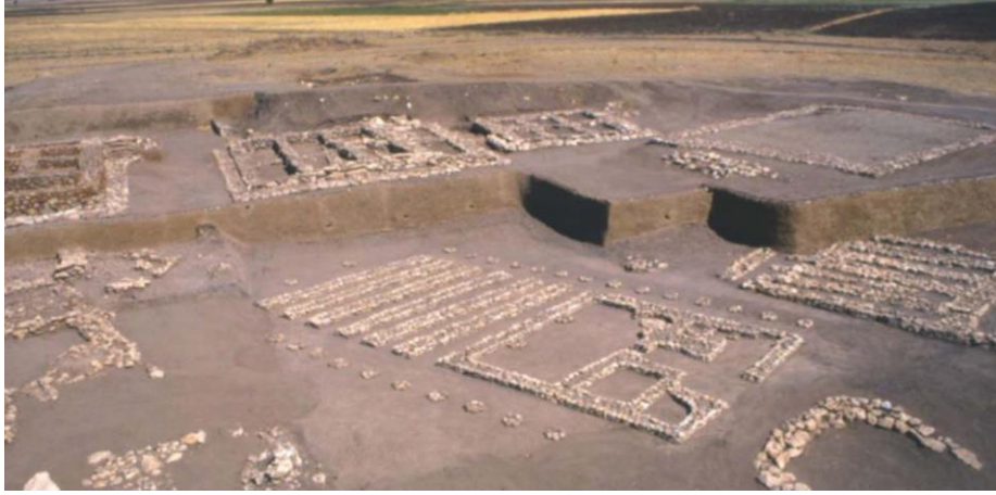
Şekil 15. Çayönü Yerleşimi sergileme yaklaşımı (Kaynak: Özdoğan, 2010, s.152).

Peter Neve'nin uygulamalarındaki yaklaşımı temel alan başka bir yorum da; 1990'ların başında Mehmet Özdoğan tarafından Çayönü yerleşiminde uygulanmıştır. 2000 yıl boyunca kesintisiz iskân görmüş Çayönü, Neolitik Dönem'de yuvarlak planlı kulübe tipi mimariden dörtgen biçimli gelişkin köy evine geçiş sürecini ortaya koyan nadir yerleşimlerden biridir. Uzun yıllar süren çalışmalar sonucu açılan derin sondajlar ve 50'ye yakın yapı katının olması, kalıntıların korunmasını ve algılanmasını zorlaştırmıştır. Bu sebeple mevcut kalıntıların üzeri toprakla örtülerek, Boğazköy – Hattuşa'dan farklı bir yorumlamayla, yerleşimdeki kültürel değişimi anlatan dört yapı evresi belirlenmiş ve üzerlerine temel seviyesinde modelleri yapılmıştır. Koruma çatısı yerine yerleşimi doğal çevre ortamı ile bütünleştirecek bir sergileme düzeni uygulanmıştır (Eres ve Özdoğan, 2016; Özdoğan, 2010) (Şekil 15).