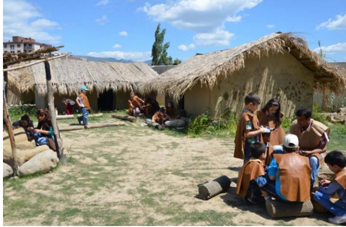
Şekil 19. Yeşilova Höyüğü'nde gerçekleştirilen zaman yolculuğu uygulaması.

Son yıllarda Türkiye'de farklı disiplinlerden araştırmacıların yer aldığı, yerel yönetimlerin destek verdiği, miras alanını çevresiyle birlikte korumayı hedefleyen, toplumun koruma sürecine dâhil edildiği farklı koruma-sergileme yaklaşımları gelişmiştir. Sagalassos Projesi; farklı anastilosis uygulamalarının ve tamamen pitoresk görüntüsüyle bırakılan buluntuların doğal peyzaj ile bir arada korunarak, yerleşim boyunca oluşturulan bir gezi güzergahı ile ziyaretçiye sunulmasıyla; yerleşim ölçeğinde gerçekleştirilen planlı bir koruma-sergileme yaklaşımı olarak önemli bir örnektir (Şekil 20). Sagalassos antik kenti aynı zamanda; bulunduğu Ağlasun yerleşiminde oluşturulan doğa yürüyüşü - bisiklet rotaları ve kültür rotalarının da bir parçasını oluşturmaktadır (Sagalassos Vakfı, 2020). Benzer şekilde; Hattuşsa ve diğer Hitit yerleşimlerini kapsayan Hitit Yolu Projesi ve 19 Likya şehrini kapsayan, Antalya'dan Fethiye'ye uzanan, farklı rotalardan oluşan Likya Yolu Projesi farklı yaklaşımlarıyla öne çıkmaktadır (Hitit Yolu, 2020; Likya Yolu, 2020).