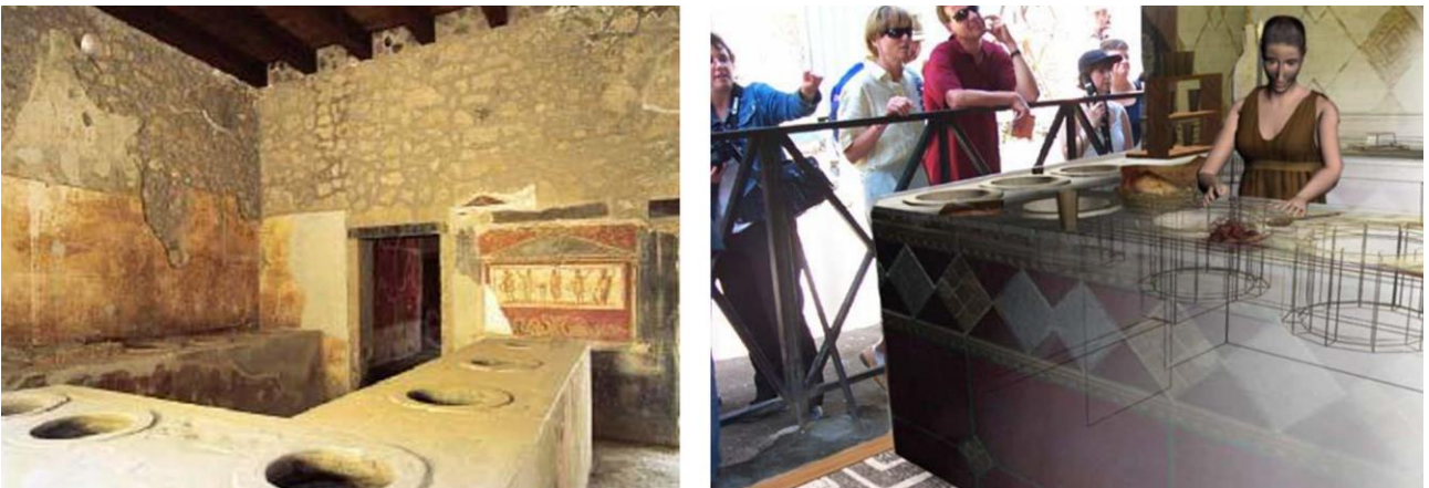
Şekil 9. Thermopoliumun mevcut durumu ve sanal gerçeklik uygulaması aracılığıyla görünümü.

Antik Pompeii Kenti'nde yapılan benzer bir çalışma antik fresk ve boyamalar ile sanal karakterlerin bölgedeki doğal çevreyle birlikte yeniden canlandırılmasına dayanmaktadır. Ziyaretçiler Antik Pompeii'de ayaküstü yeme-içme mekânları olarak tanımlanabilecek thermopoliumu sanal gerçeklik gözlükleriyle gözlemlediklerinde; mekânın rekonstrüksiyonunu, fresk ve boyamaların tamamlanmış hallerini ve o döneme ait kıyafetler giymiş bir kadını çalışırken görme ve mekânsal kullanımı da deneyimleme imkânı bulmaktadırlar (Papagiannakis, Schertenleib, O'Kennedy, Arevalo-Poizat, Magnenat-Thalmann, Stoddart ve Thalmann, 2005)(Şekil 9).