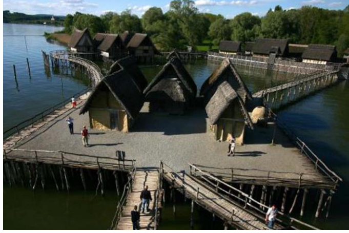
Şekil 3. Unteruhldingen Kazıklı Yapı Açık Hava Müzesi - Neolitik Dönem'den Tunç Çağı'na farklı dönem konutlarının bir arada sergilendiği köy canlandırması ( Kaynak: Leobw, b.t.).

Geçmiş dönem kültürlerine ait ilginin artmasıyla, anıt yapılar ve bu yapıların bulunduğu ören yerlerine yapılan turistik geziler yaygınlaşmış, buna paralel olarak 19. yüzyılın başından itibaren antik ören yerlerindeki anıt yapıların sağlamlaştırıldığı ve etrafta dağınık bulunan mimari öğelerin bir araya getirilerek görünür kılındığı uygulamalar başlamıştır. İlk uygulamalar yapıların sağlamlaştırmak yerine neredeyse tümüyle yenilenmesi üzerine biçimlenmiştir. Anıt yapıların kapsamlı şekilde onarılmasına ilişkin ilk örnekler 1809 yılında Roma Colosseum'unda gerçekleştirilen kapsamlı onarım çalışması ve 1812-1824 yılları arasında Titus Kapısı'nda gerçekleştirilen özgün kalıntıların da kullanıldığı rekonstrüksiyon çalışmasıdır. Ziyaretçilerin kapının tümünü algılayabilmeleri amacıyla gerçekleştirilen rekonstrüksiyon müdahalesinde farklı malzeme ve sadeleştirilmiş formların kullanıldığı özgün olmayan ekler, süreç içerisinde edindiği patinaya rağmen günümüzde halen kapının özgün parçalarından ayırt edilebilmektedir (Eres, 2013; Özdoğan, 2013; Schmidt, 1997) (Şekil 4).