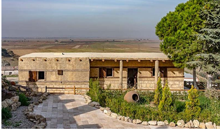
Şekil 21. Tefikiye köyünde yer alan Troya evi (Kaynak: Opet, 2021).

çalışmalarla; arkeolojik mirası yerel topluluklarla buluşturma, antik ve kırsal yerleşimdeki kültürel birlikteliğin sürekliliğinin sağlanması bağlamında son yıllarda öne çıkan uygulamalardandır (Opet Tefikiye Arkeo-Köy Projesi, 2018) (Şekil 21).