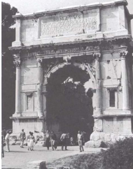
Şekil 4. Titus Kapısı rekonstrüksiyonu.

Geçmiş dönem kültürlerine ait ilginin artmasıyla, anıt yapılar ve bu yapıların bulunduğu ören yerlerine yapılan turistik geziler yaygınlaşmış, buna paralel olarak 19. yüzyılın başından itibaren antik ören yerlerindeki anıt yapıların sağlamlaştırıldığı ve etrafta dağınık bulunan mimari öğelerin bir araya getirilerek görünür kılındığı uygulamalar başlamıştır. İlk uygulamalar yapıların sağlamlaştırmak yerine neredeyse tümüyle yenilenmesi üzerine biçimlenmiştir. Anıt yapıların kapsamlı şekilde onarılmasına ilişkin ilk örnekler 1809 yılında Roma Colosseum'unda gerçekleştirilen kapsamlı onarım çalışması ve 1812-1824 yılları arasında Titus Kapısı'nda gerçekleştirilen özgün kalıntıların da kullanıldığı rekonstrüksiyon çalışmasıdır. Ziyaretçilerin kapının tümünü algılayabilmeleri amacıyla gerçekleştirilen rekonstrüksiyon müdahalesinde farklı malzeme ve sadeleştirilmiş formların kullanıldığı özgün olmayan ekler, süreç içerisinde edindiği patinaya rağmen günümüzde halen kapının özgün parçalarından ayırt edilebilmektedir (Eres, 2013; Özdoğan, 2013; Schmidt, 1997) (Şekil 4).