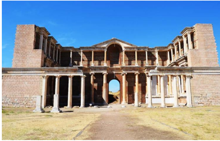
Şekil 13. Sardes Gymnasium