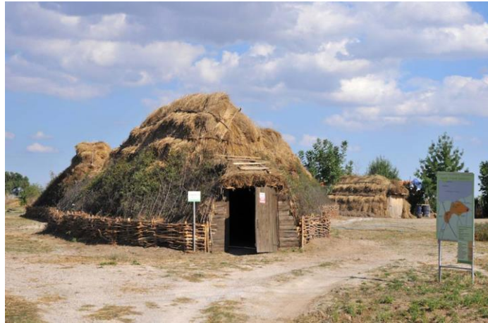
Şekil 18. Kırklareli Aşağı Pınar Açık hava Müzesi.

2000’li yılların başında Kırklareli Aşağı Pınar kazı alanında tarihöncesi kazı alanlarında koruma ve sergileme konusu farklı bir yaklaşımla ele alınmıştır. Kazı çalışmalarıyla açığa çıkarılan mimari buluntuların iz niteliğinde olması ve görsel açıdan algılanabilirliğinin zorluğu sebebiyle; kazıda saptanan mimariye uygun ahşap yapıların inşa edildiği bir açık hava köy müzesinin kurulmasına karar verilmiştir. Müze içinde inşa edilen ahşap evler ile içlerinde yer alan canlandırmalar ve bilgilendirme panolarıyla, kazı çalışmalarını ve tarihöncesi yaşamını topluma aktarmak amaçlanmıştır (Eres ve Özdoğan, 2016; Kırklareli Projesi, 2020) (Şekil 18).