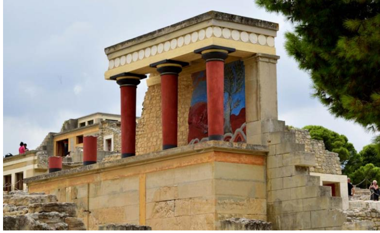
Şekil 5. Knossos Sarayı restorasyonu (Kaynak: German, 2018).

1922-1930 yılları arasında Atina Parthenon’unda dağılmış durumda olan sütunların yeniden bir araya getirilmesiyle, yapının güney cephesinin ayağa kaldırılarak görünür kılındığı bir anastilosis uygulaması gerçekleştirilmiştir. Anastilosis uygulamasında sütunlar yeniden dikilirken; arşitrav ve frizler değiştirilmiş ve eksik kısımlar tamamlanmıştır (Schmidt, 1997) (Şekil 6).