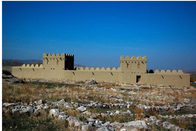
Şekil 14. Boğazköy Hattuşa koruma-sergileme uygulaması.

Karatepe – Aslantaş projesinden etkilenen Peter Neve, 1980’lerin başında Boğazköy Hattuşa’da farklı bir yaklaşımı örnekleyen bir koruma – sergileme projesi geliştirir. Görkemli taş mimariye sahip, Hititlerin başkenti olan çok katmanlı yerleşimde imparatorluk dönemine ait yapı katının sergilenmesi uygun bulunur. Açık hava koşullarının kalıntıların uzun süre korunması için uygun olmaması sebebiyle; farklı katmanlara ait duvar kalıntılarının üzeri toprakla kapatılarak, sergilenmek istenen Hitit İmparatorluk Dönemi’ne ait yapı temelleri üzerine bire bir modelleri yapılır. Bu yeniden inşa sürecinde hem kazı çalışanları hem de yerel taş ustalarından yararlanır. Bu sergileme biçimiyle özgün yapı temelleri toprak altında koruma altına alınırken; ziyaretçilerin yapıyı bir bütün olarak algılaması amaçlanmıştır (Eres ve Özdoğan, 2016; Eres ve Yalman, 2016) (Şekil 14).