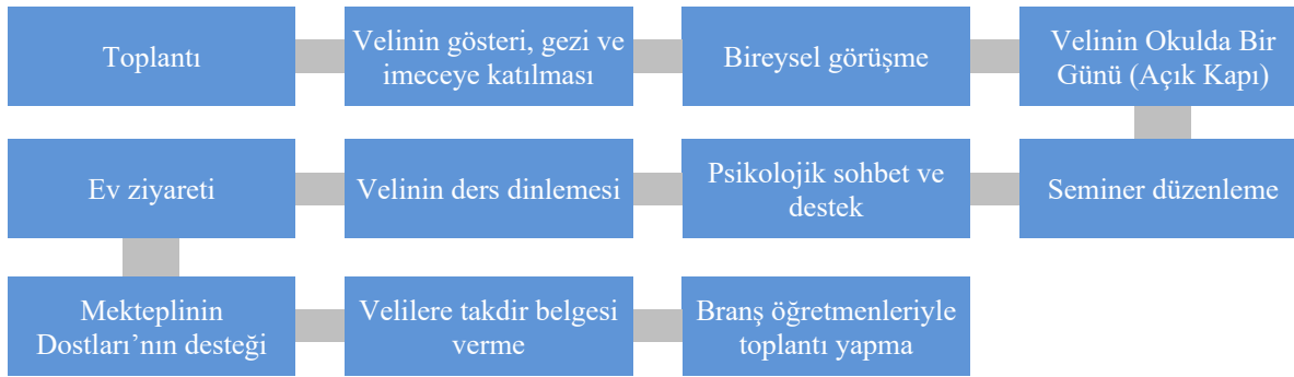
Şekil 3. Okul-Aile İş Birliği Uygulamaları

OD kodlu okula ilişkin doküman analizi sonucunda, Kasım 2019'da sınıf veli toplantılarının düzenlendiği, toplantıda öğrencilerin devamsızlık yapmasını ve hoş olmayan davranışlarda bulunmasını önlemek ve velilerin bilinçli bir şekilde iş birliği kurmasını temin etmek için velilere okul yönetimi ve öğretmenler tarafından öğrencilerin okul devamlılığı, okulun disiplin kuralları, veli ve öğrencilerin hak ve sorumlulukları hakkında bilgi verildiği bulgusuna ulaşılmıştır.