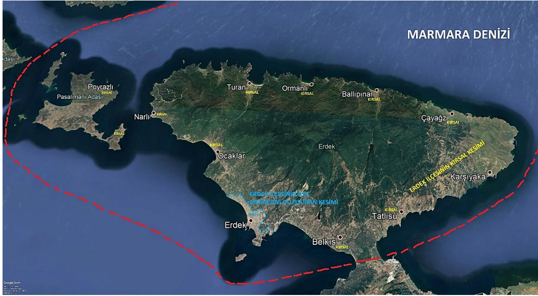
Foto 5. Erdek Büyükşehir İlçesi Mülki İdari Sınırları