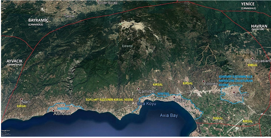
Foto 3. Edremit Büyükşehir İlçesi İdari Sınırı ve Çevresi