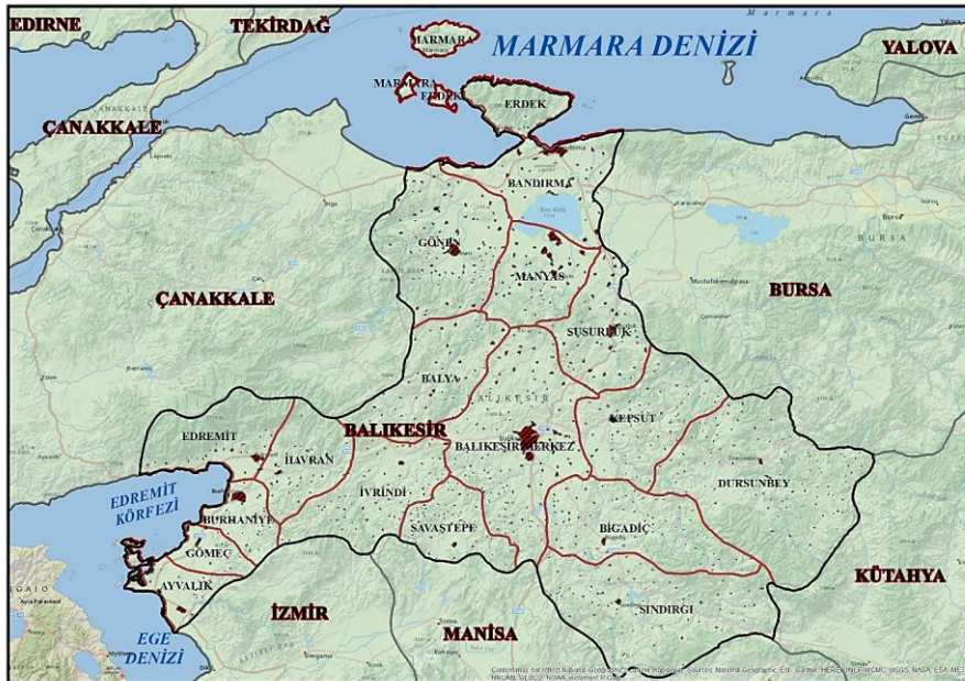
Harita 1. Balıkesir İlinin Lokasyonu

Balıkesir ili, Anadolu Yarımadasının kuzeybatısında yer almaktadır. Balıkesir ili kuzeyden Marmara Denizi, güneybatısından Edremit Körfezi, batısında Çanakkale, doğusunda Bursa, güneydoğuda Kütahya, güneyde Manisa ve İzmir illeri ile sınırlandırılmıştır. Edremit Körfezini bir at nalı gibi kuşatan Edremit, Havran, Burhaniye, Gömeç ve Ayvalık ilçeleri Kıyı Ege Bölümünde; Dursunbey ilçesi, İç Ege Bölümünde; Marmara, Erdek, Bandırma, Gönen, Manyas, Balya, Balıkesir Metropol ilçeleri (Karesi, Altıeylül), Kepsut, İvrindi, Savaştepe, Bigadiç, Sındırgı ilçeleri ise Güney Marmara Bölümünde yer almaktadır (Harita 1).