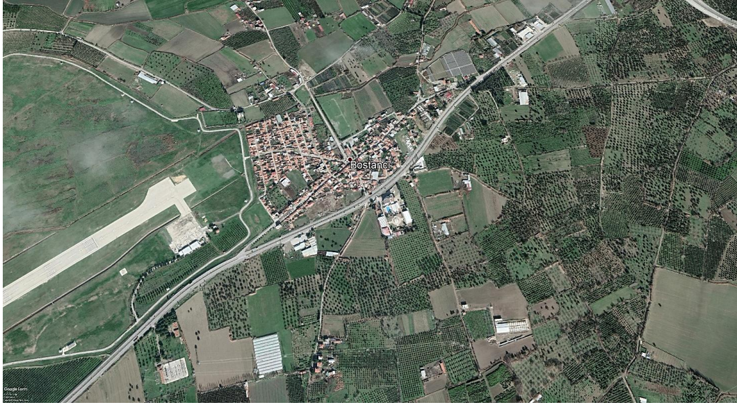
Foto 4. Edremit İlçesi Kırsal Mahallelerinden Bostancı