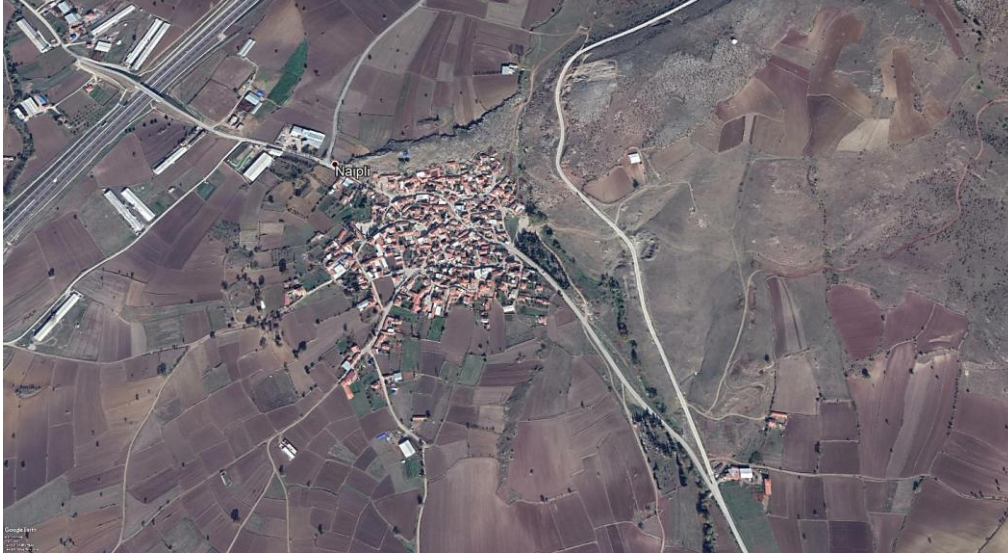
Foto 2. Karesi Metropol Merkez ilçesinin kırsal mahallelerinden Naipli