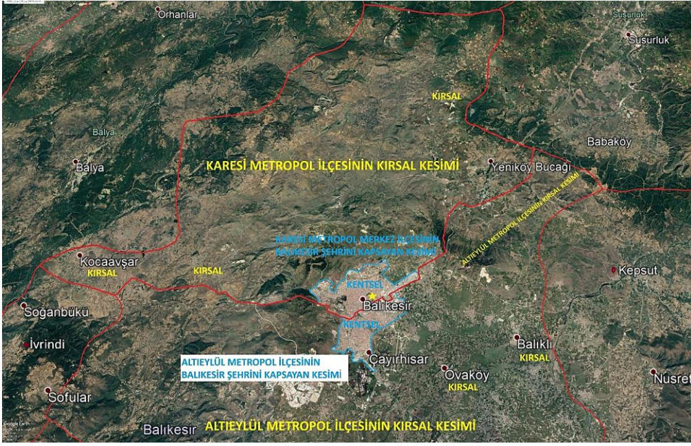
Foto 1. Karesi Metropol Merkez ve Altieylül ilçeleri