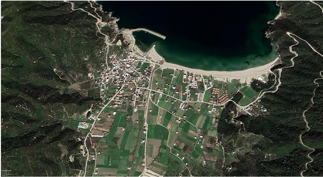
Foto 6. Erdek İlçesi Kırsal Mahallerinden Turan mahallesi