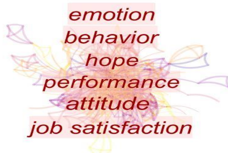
Şekil 1. Pozitif Psikolojik Sermaye’nin Kelime Analizi

Citespace II aracılığıyla yapılan kelime analizi sonucunda Pozitif psikolojik sermaye konusunda yapılmış olan çalışmalar içerisinde en çok kullanılan kelimeler kullanım sayısı ve merkezilik derecelerine göre şekil 1’de olduğu gibi görünmektedir.