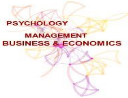
Şekil 5. Pozitif Psikolojik Sermaye'nin Alan Ağı Analizi

Pozitif psikolojik sermaye alanında yapılan çalışmaların en çok hangi alanlarda yapıldığını tespit etmek üzere alan ağı analizi yapılmıştır. Alan ağı analizinin sonucuna göre çalışmalar sırasıyla İşletme ve ekonomi alanında, Yönetim alanında ve Psikoloji alanında önderlik yapmaktadır. Yayınların ağı analizi Şekil 5'te yer almaktadır.