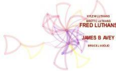
Şekil 2. Pozitif Psikolojik Sermayenin Yazar Ağı Analizi

Pozitif psikolojik sermaye alanında çalışan yazarların en çok hangi araştırmacıdan yararlandığını gösteren yazar ağı analizinde araştırmacılar en çok 15 atıf ile Fred Luthans adlı yazara atıf vermişlerdir. James B. Avey adlı yazar bu alanda 13 atıf ile en çok atıf alan 2. yazar olmuştur. Kyle W. Luthans adlı yazar ise 4 atıf ile 3. Sıradadır. Yazar ağına yönelik şekil, Şekil 2’de yer almaktadır.