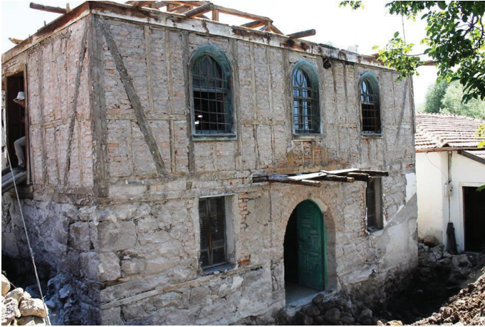
Resim 6. Son cemaat yeri onarım çalışmaları.