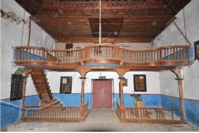
Resim 28. Kadınlar mahfilinin onarım öncesi durumu (2013). Kaynak: VGMA, Çukurören Eski Cami dosyası.