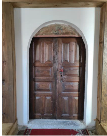
Resim 13. Harim kapısı onarım sonrası.