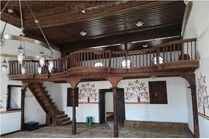
Resim 15. Harim mekânına güneyden bakış.