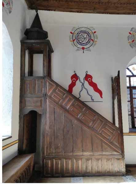
Resim 32. Minberin onarım sonrası durumu.