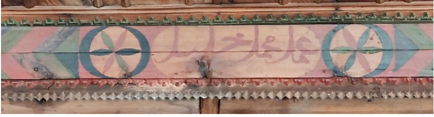
Resim 17. Harim tavanı kuzey kenarındaki yazı panosu.