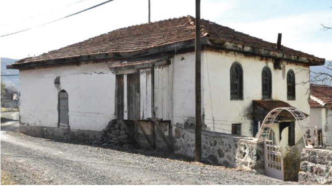
Resim 4. Kuzeydoğudan bakışla onarım öncesi durumu (2013).