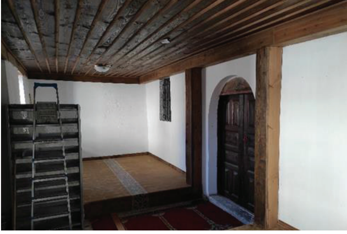
Resim 11. Son cemaat yeri onarım sonrası mevcut durumu.