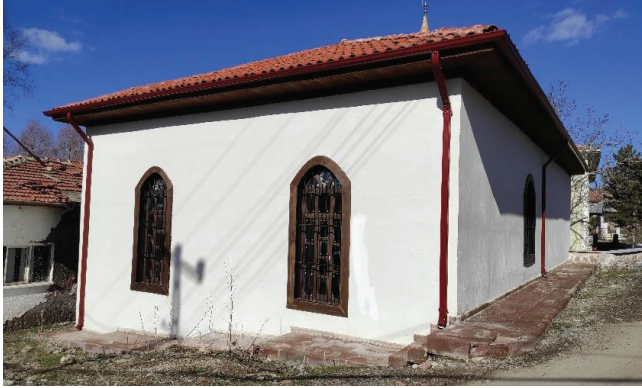
Resim 2. Güneydoğudan görünüş.