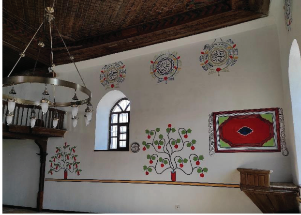
Resim 24. Harim doğu duvarı ve süslemeleri.