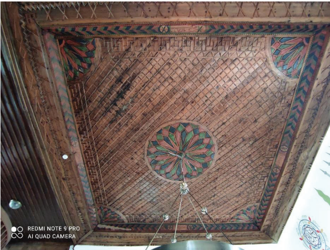
Resim 16. Harim tavanı.