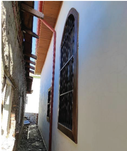
Resim 3. Batı cephe.