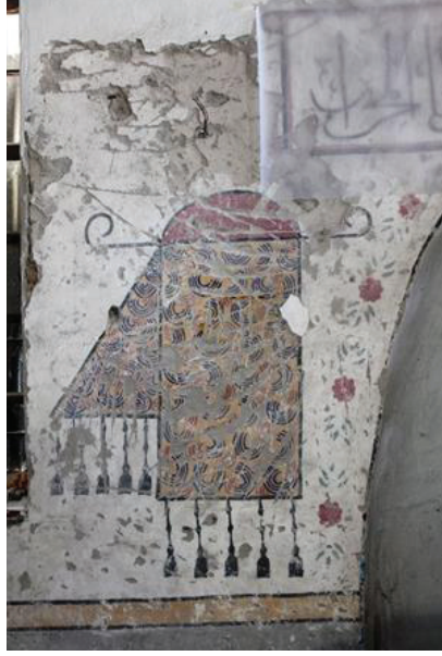
Resim 26. Harim güney duvarı, raspalama sırasında çıkan süslemeler.