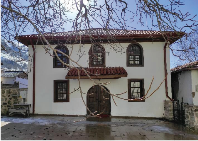
Resim 8. Son cemaat yeri kuzey cephe, onarım sonrası.