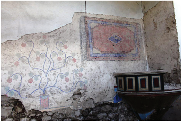
Resim 25. Harim doğu duvarı, onarımlarda ortaya çıkarılan süsleme programı.