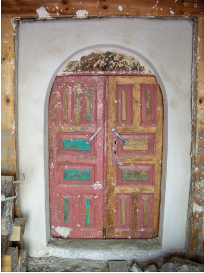
Resim 12. Harim kapısı onarım öncesi. (2019)