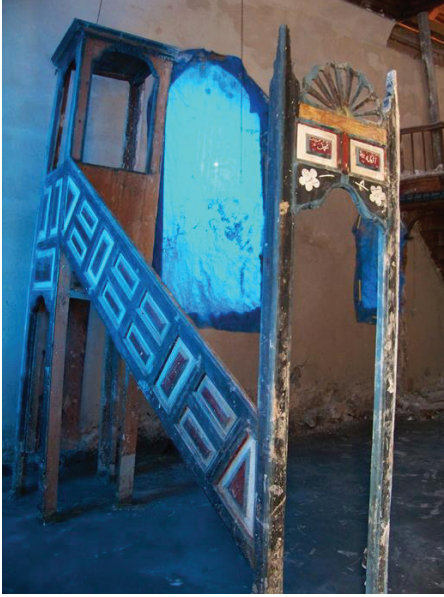
Resim 31. Minberin onarım öncesi durumu.