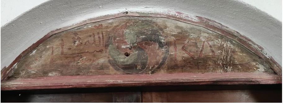
Resim 14. Harim kapısı üzerindeki kitabe panosu.