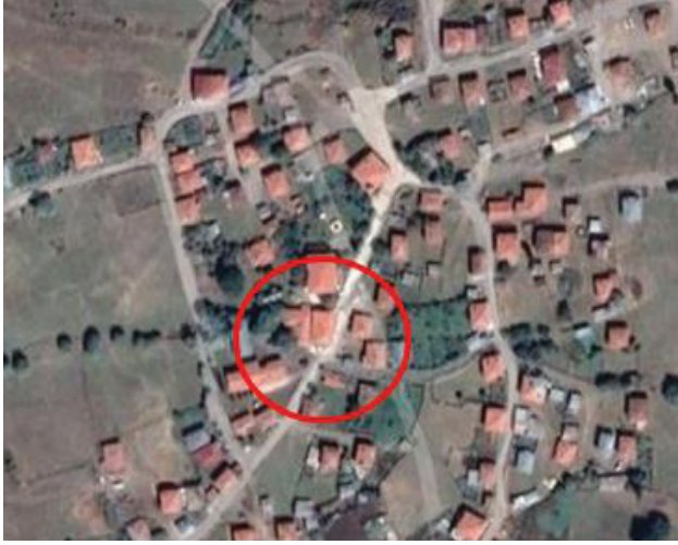
Harita 1. Çukurören Mahallesi uydu görüntüsü. Kaynak: nufusune.com. Erişim 01 Mart 2021.