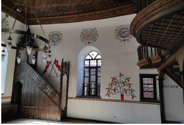
Resim 23. Harim batı duvarı ve süslemeleri.