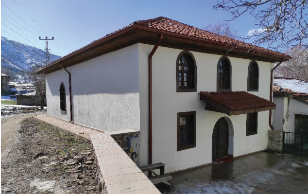
Resim 1. Kuzeydoğudan görünüş.