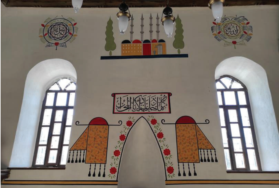
Resim 27. Harim güney duvarı ve süslemeleri.