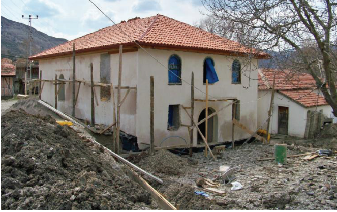
Resim 5. Onarım çalışmaları, kuzeydoğudan görünüş (2019).