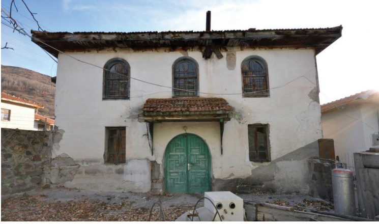
Resim 7. Son cemaat yeri kuzey cephe, onarım öncesi görünüş (2008).