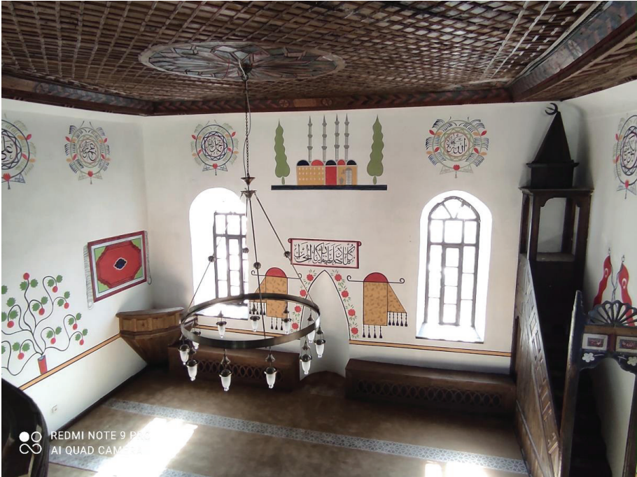
Resim 22. Kuzeyden bakışla onarım sonrası harim mekânı.