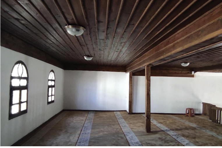
Resim 30. Mahfilin onarım sonrası görünüşü.