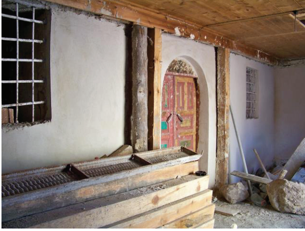
Resim 10. Son cemaat yeri, onarım çalışmalarındaki durumu (2019).