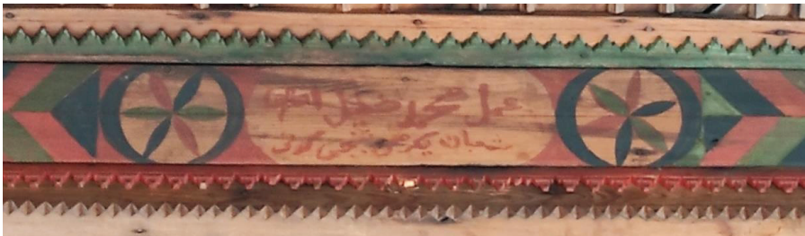
Resim 20. Harim tavanı doğu kenarındaki yazı panosu.