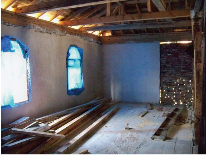
Resim 29. Mahfilin onarım sırasındaki durumu.