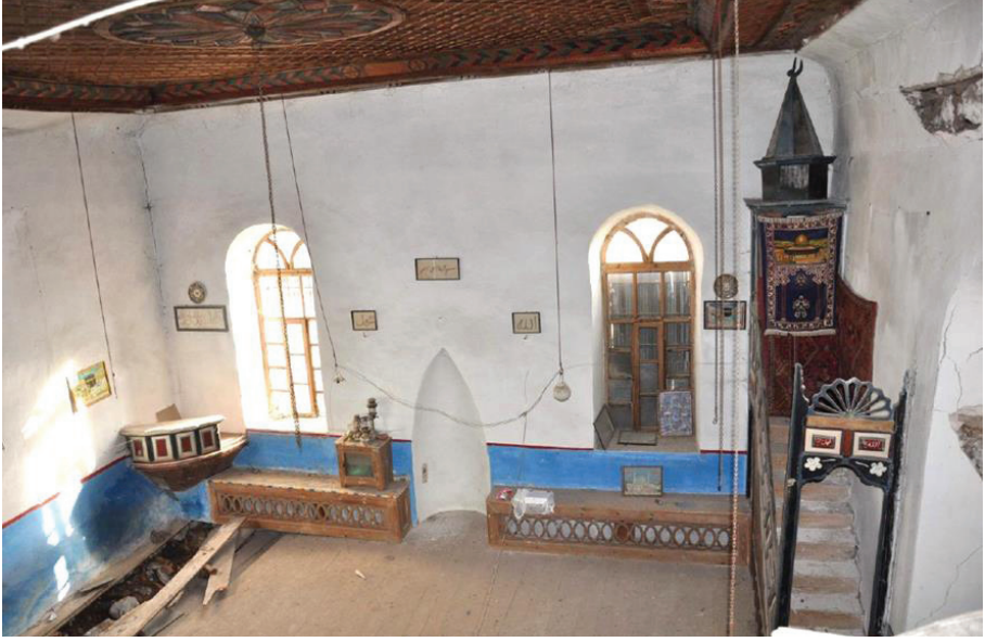
Resim 21. Kuzeyden bakışla onarım öncesi harim mekânı (2013).