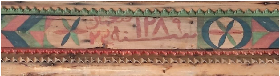
Resim 19. Harim tavanı batı kenarındaki yazı panosu.