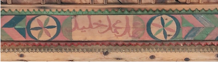
Resim 18. Harim tavanı güney kenarındaki yazı panosu.