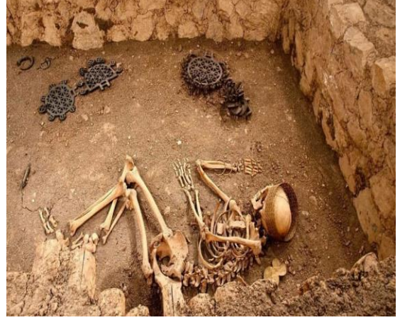
Foto 3: Çorum Müzesi Alacahöyük Oda Mezar Örneği Foto 4: Alacahöyük Kral Mezar Örneği