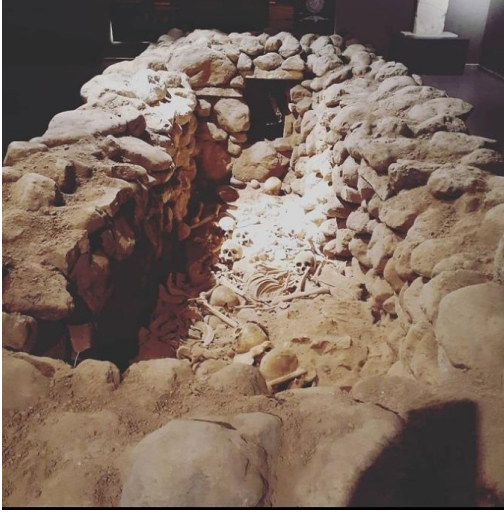
Foto 9: Açık Sergileme Biçimli Oda Mezar Örneği Kalıntıları Örneği