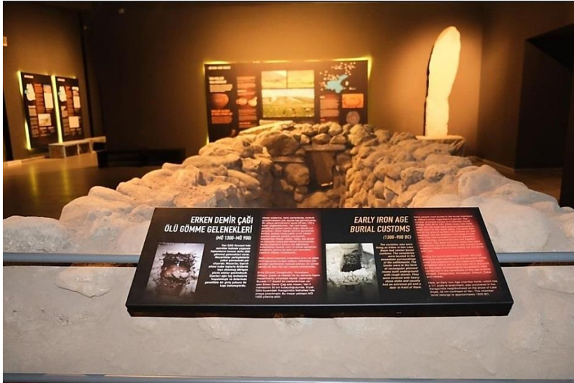
Foto 8: Van Müzesi Urartu Dönemi Kalecik Nekropolünden Mezar Temalı Sergileme