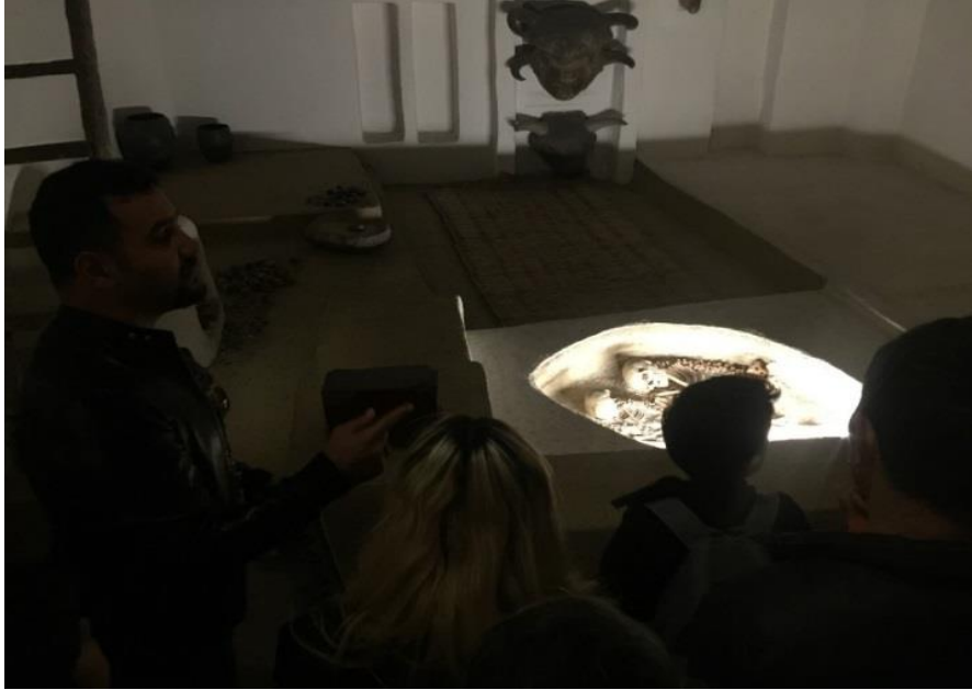
Foto 5: Anadolu Medeniyetleri Müzesi Çatalhöyük Nekropolünden Mezar Temalı Sergileme