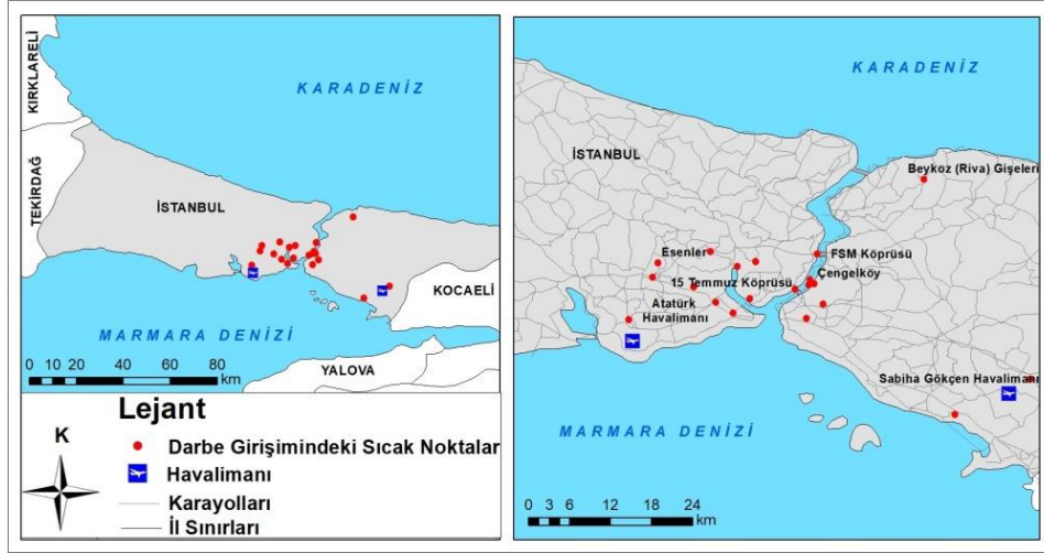
Şekil 3: İstanbul’da 15 Temmuz darbe girişiminin sıcak alanları

Darbe başarılı olmamıştır. Bu durum gazete başlıklarına farklı şekillerde yansdı. Temel vurgu, darbe, demokrasi, destan ve milli irade şeklinde yapıldı. Milli irade adı (Milli İrade Caddesi-Nevşehir, Milli İrade Meydanı-Balıkesir, Kahramanmaraş, Kocaeli) şehirsel toponimide de kullanıldı. Bu başlıklar aşağıdaki gibidir: