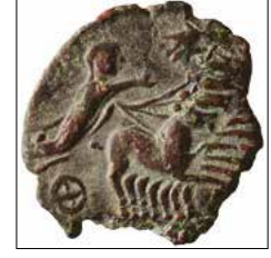
Kat. No: 2b