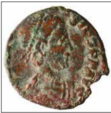
Kat. No: 29a