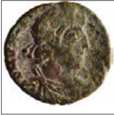
Kat. No: 9a