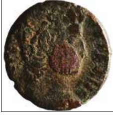
Kat. No: 3a