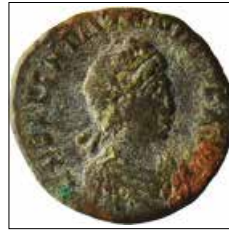
Kat. No: 23a