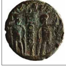
Kat. No: 3b