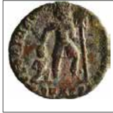
Kat. No: 9b