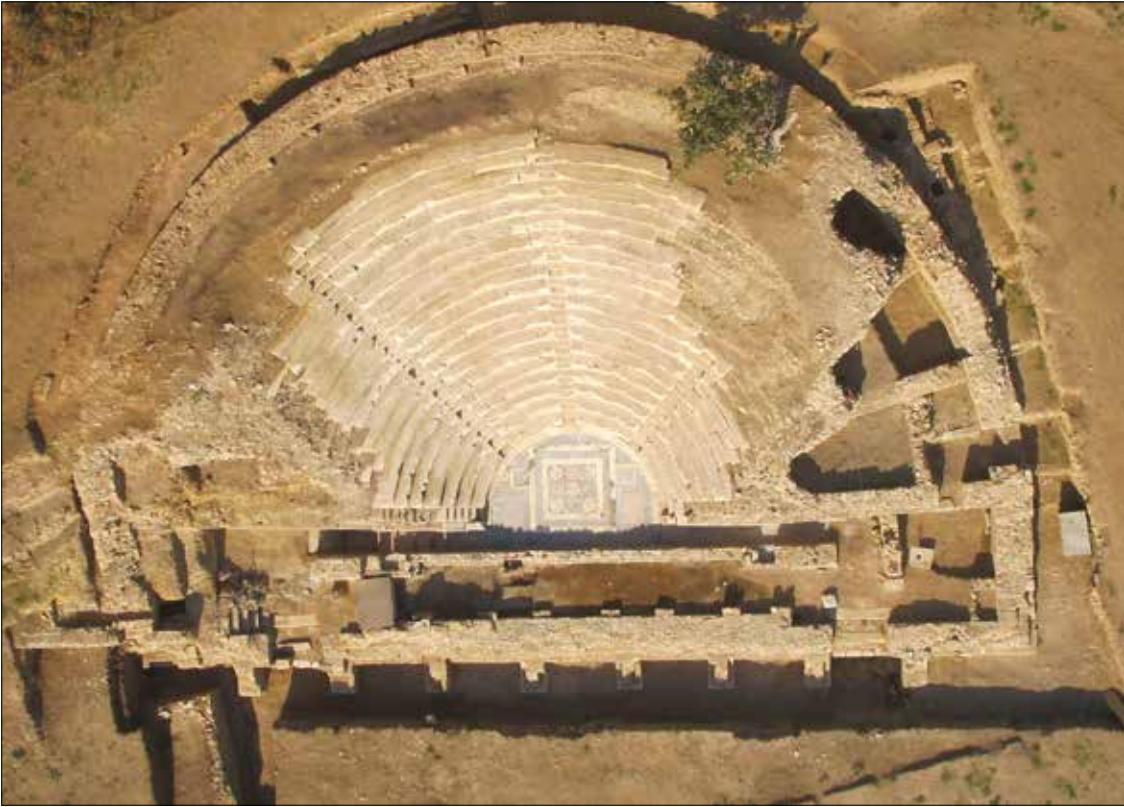
Figür 1: Parion Odeionu Hava Fotoğrafi. / Parion Odeion Aerial Photo.