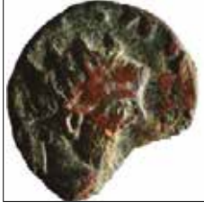
Kat. No: 1a