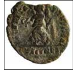
Kat. No: 10b