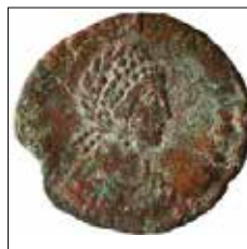
Kat. No: 80b