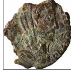
Kat. No: 2a