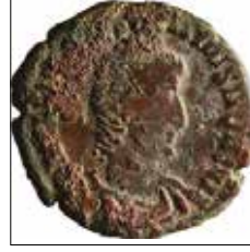
Kat. No: 7a