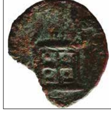
Kat. No: 1b