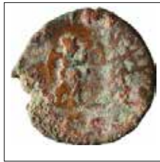
Kat. No: 29b