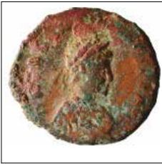
Kat. No: 19a