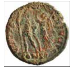
Kat. No: 42b