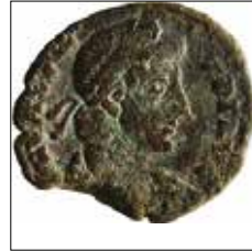
Kat. No: 10a