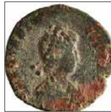
Kat. No: 42a