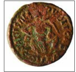
Kat. No: 23b