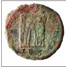
Kat. No: 19b