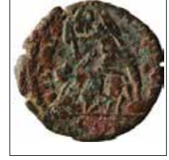
Kat. No: 7b