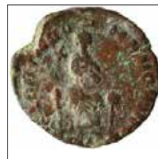
Kat. No: 81b