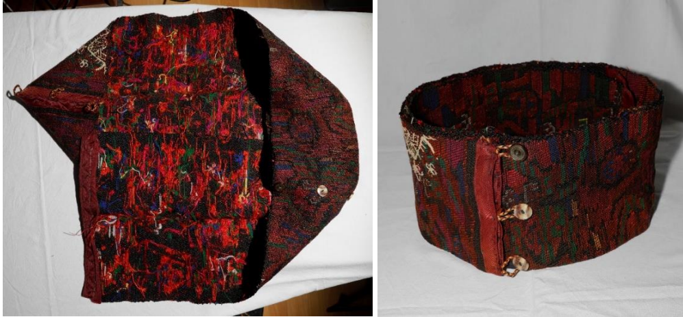
Görsel 10. Şal, Piştbenk Dokuması, Hakkâri, 2021.