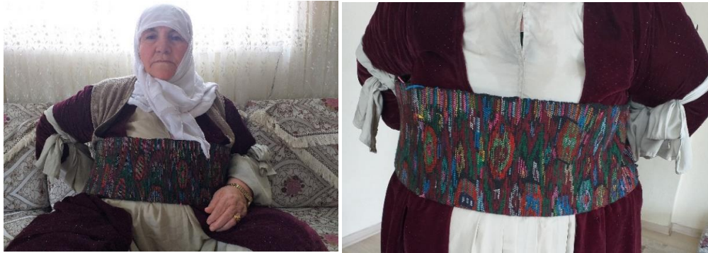
Görsel 1. Hakkâri Yöresel Kadın Kıyafeti “Giraz Fistan” ve “Piştbenk” Dokuması, Fotoğraf: Asiye Akdağ, Pehlivan Mahallesi, Hakkâri, 2021.

Çalışma konusu olarak Hakkâri dokumaları içinde az bilinen fakat önemli bir yere sahip olan Şal dokumaları belirlenmiştir. Şal dokuması erkeklerin giydikleri şel şepik, şelü şepik ve kadınların giydikleri kıras, giraz fistan denilen yerli kıyafetin üzerine bağladıkları tamamen yünden yapılan el dokuması bir kuşak çeşididir. Yöresel olarak erkeklerin bellerine bağladıkları kuşak “Şal”, kadınlarınkı ise “Piştbenk, Pişt bêng” (Akan, Görüşme:2021) ya da “Acem Şalı” (Aslan, Görüşme:2021) olarak adlandırılır (Görsel 1).