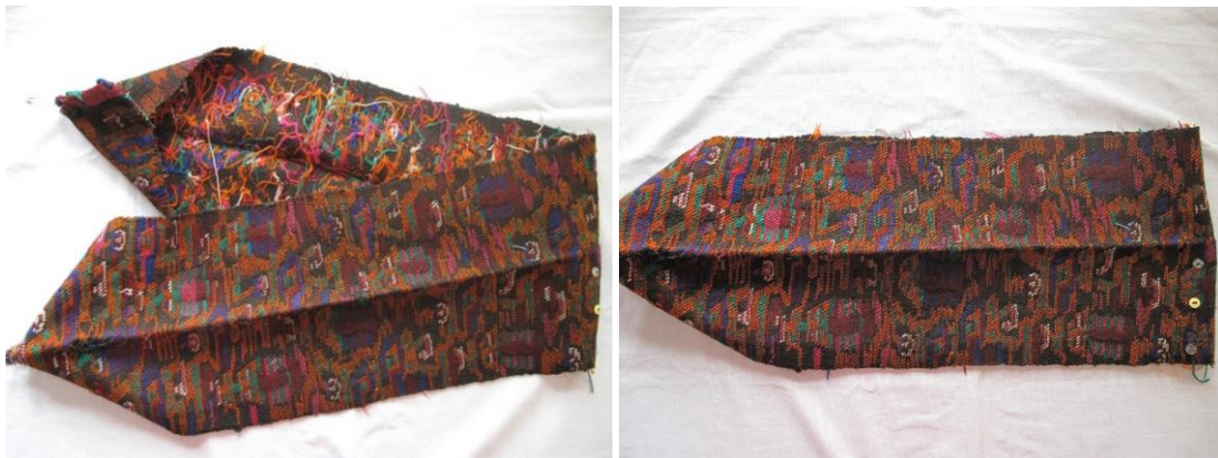
Görsel 9. Şal, Piştbenk Dokuması, Fotoğraf: Gülşen Öztürk, Halil İbrahimoglu'un Evi, Yeni Mahalle, Hakkâri, 2013.