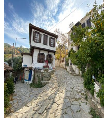
c. Şirince'nin tarihi yapılarından bir örnek