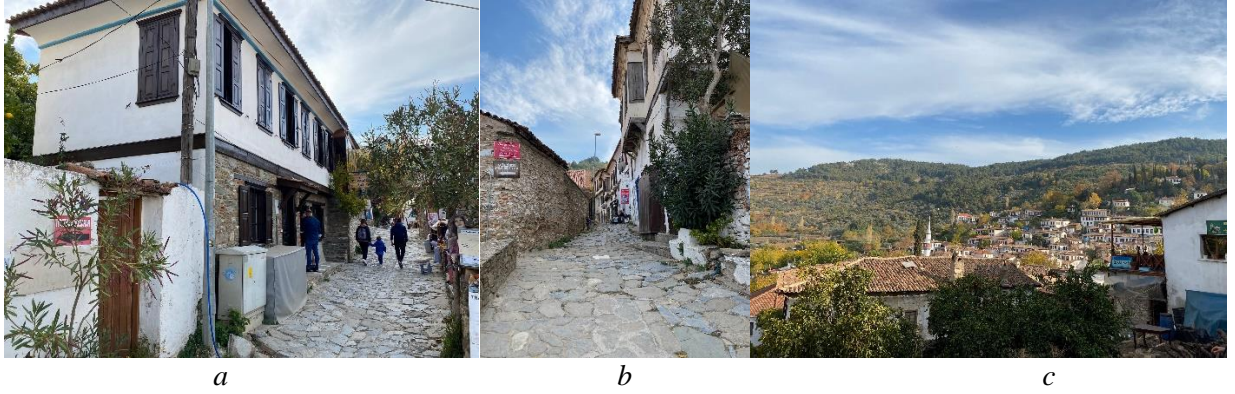
Şekil 3.Şirince'nin güçlü yönlerinden geleneksel yapım tekniklerine sahip konutlar (a), kırsal dokusu (b) ve panoramik özelliği (c) (Orijinal 2020)