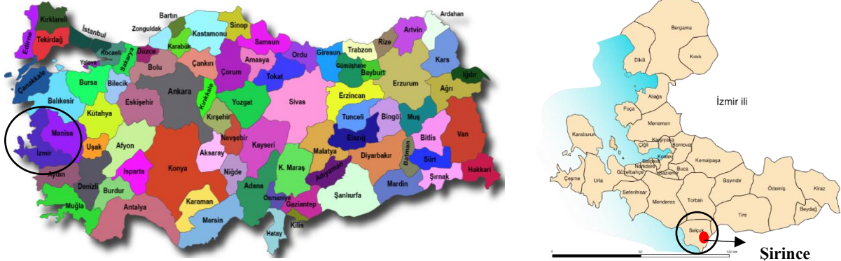
Şekil 1. Şirince'nin Türkiye'deki coğrafi konumu (Anonim, 2019-2021)