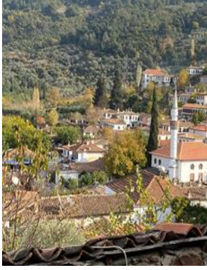
a. Şirince'nin genel görünümü