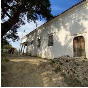
d. Şirince'nin dini tarihi yapılarından örnekler