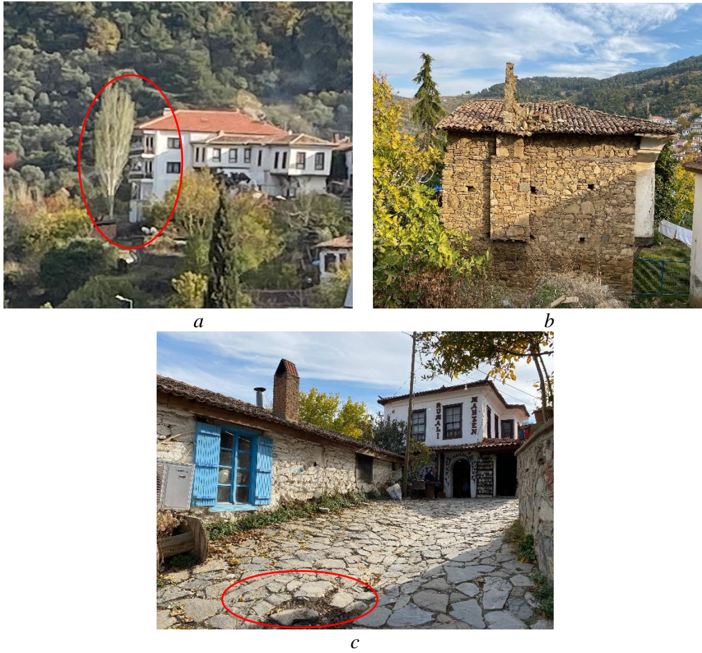
Şekil 4.Şirince'nin zayıf yönleri; geleneksel yapılara ve yakınına modern yapılar ve eklentiler eklenmesiyle orijinalliğinin bozulması (a), bakımsızlık nedeniyle bozulan atıl yapılar (b) ve bozulan geleneksel yer döşemeleri (c) (Orijinal 2020)

şeklini deęiřtirmiřtir. Yerel halk tamamen turizm faaliyetlerine odaklanarak, geleneksel yařantılarından ve tarımsal üretimden kopmuřtur. Ayrıca turizmden kaynaklanan konaklama ihtiyacının karřılanmasına yönelik geleneksel konutlara yapılan bazı modern müdahale ve uygulamalar da alanın sürdürülebilirliğini olumsuz yönde etkilemeye bařlamıřtır. Bu nedenle köy kültürel peyzaj