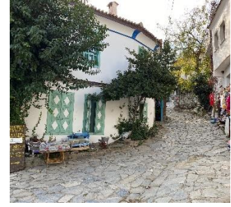
e. Şirince'nin geleneksel konutlarından oluşan tarihi sokak dokusu