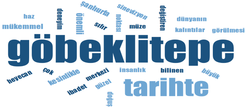
Şekil 1: Çevrimiçi Yorumlardan Elde Edilen Sözcük Bulutu

Şekil 1'de Göbekli Tepe Açık Hava Müzesi ziyaretçilerinin çevrimiçi yorumlarından en çok vurgulanan sözcüklerin oluşturduğu kelime bulutunun son şekli görülmektedir. Belirlenen en sık kullanılan 25 sözcük dağılımı aşağıdaki tabloda yer almaktadır. Sözcük bulutu oluşturma aşamasında aynı anlamı taşıyan kavramlar birleştirilmiştir. (etkileyici, muhteşem, çekici, olağanüstü=mükemmel; tarihi, tarihin, tarihsel= tarihte; görülesi, görülmeli, görmek= görülmesi; alan, merkezinde, merkezde= merkezi vb.). Analiz sürecinde, ziyaretçilerin olumlu ve olumsuz deneyimlerine yönelik 255 yorum belirlenmiştir. Toplam sözcük sayısı 6545'tir. En çok tekrar eden 25 sözcük toplam sözcük sayısının %21,41'ini oluşturduğu belirlenmiştir (n= 6545). Ziyaretçi yorumlarında en çok kullanılan ifade 'Göbekli Tepe'dir (n=210,%3,21). Olumlu ifadelerin çoğunda öncelikle kullanılan kelimedir.