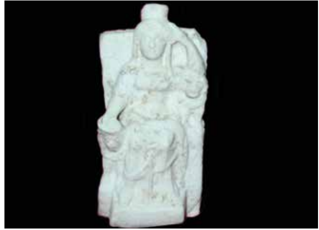
Fotoğraf 11: Kybele Figürini, Roma Dönemi, Kocaeli (Kocaeli Müze Müdürlüğü Arşivi) / Figurine of the Cybele, Roman Period, (Archive of Kocaeli Museum Directorate)

yatay çentiklerle yapılarak ahşap görünümü verilmeye çalışılmıştır (Foto. 10b). Tanrıça üçgen alınlıklı evinde yeniden oturmaktadır. Anadolu'da bu tür düzenlemeler Arkaik Dönem'de sık bir şekilde kullanılmış olsa da Klasik Dönem'de terk edilmiştir. Arşitrav üzerindeki yazıt, tapınak illüzyonunu pekiştirmektedir. Tanrıça kısa kollu bir khiton üzerine hymation giymektedir. Başında polos ya da surlu tacı vardır. Hymation, surlu tacı üzerinden baş örtüsü gibi aşağıya doğru dökülmektedir. Sağ yanında sağrıları üzerine oturmuş bir aslan yer alır. Tanrıça sağ elinde tuttuğu phialeyi aslanın başına yaslamaktadır. Heykeltıraş tympanonu yerleştirmek için bir yükseltiye ihtiyaç duyduğundan tahtın sol yanına küçük bir sütun (tahtın kolçağı?) ya da küçük dar bir sunak yerleştirmiştir. Sol kolunun dirseğini tympanona yerleştiren tanrıça sol eliyle başına uzanmaktadır. Bu eser Pergamon ve ayrıca Arkaik-Phryg karışımı bir karaktere sahiptir. Naiskos biçimindeki bu adak steli Phryg tarzındadır. Üçgen geison ve iki antenin üzerindeki yazıt da bu izlenimi doğrulamaktadır (Naumann, 1983, s. 257). MS 2. yüzyıla ait bu naiskos adağında Kybele'nin