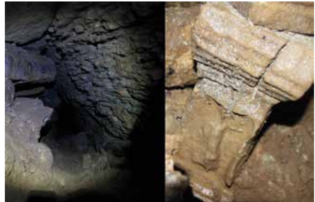
Fotoğraf 15: Mağara içerisindeki sunaklar, Kandıra-Yağbolu Mağarası / Altars in the cave, The Cave of Kandıra-Yağbolu