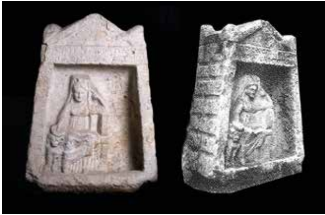
Fotoğraf 10a-10b: Kybele Kabartması, MS 2. yy, İstanbul Arkeoloji Müzesi (İstanbul Arkeoloji Müzesi Arşivi / Naumann 1983: Lev. 44, fig. 4) / Relief of the Cybele, 2nd century AD, İstanbul Archaeology Museum (İstanbul Archaeology Museum Archive / Naumann 1983: Pl. 44, fig. 4)

zamanda Naumann'ın Bithynia Tipi olarak adlandırdığı eserdir (Naumann, 1983, s.256). Kybele yüksek arkalıklı taburesiz bir taht üzerinde oturmaktadır. Başında polos ya da surlu tacı olan tanrıça kendisini saran bir khiton ve başını da örten bir hymation giymektedir. Tanrıça sol kol dirseğini, sol yanında bulunan aslanın üzerine koymuştur. Sol eliyle başını desteklemektedir. Aslan bir sütun kaidesi üstünde oturmaktadır. Aslanın yüzü tam karşıya doğru bakmaktadır. Roma Dönemi'ne tarihlenen heykelcik İstanbul Arkeoloji Müzesi'nde korunmaktadır (Vermaseren, 1987, s.257). Naumann'ın Bithynialı dediği bir başka eserde yine İstanbul Arkeoloji Müzesi'nde korunan naiskos içerisinde yer alan Kybele kabartmasıdır (Foto. 10a). Eser kireçtaşındandır ve Kocaeli-Kandıra'da bulunmuştur. Tanrıça naiskos içinde hafif eğimli oturmaktadır. Naiskosun yan duvarları paralel