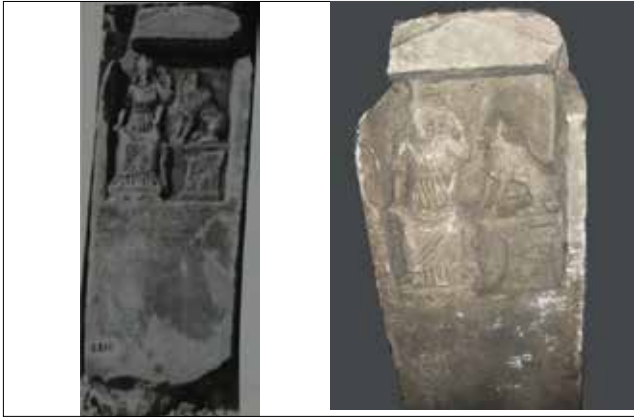
Fotoğraf 7a-7b: Kybele Kabartmalı Stel, Roma Dönemi, Bursa Arkeoloji Müzesi (Bursa Arkeoloji Müzesi Arşivi/Vermaseren 1987: Lev. LII; fig. 253) / Stele Relief of the Cybele, Roman Period, Bursa Archaeology Museum (Bursa Archaeology Museum Archive/Vermaseren 1987: Pl. LII; fig. 253)

Tanrıçanın sol yanında alt-üst profilli sunağın üzerinde sağrıları üzerine oturmuş aslan bulunmaktadır. Aslanın yüz ifadesi yumuşaktır ve kükrer gibi tasvir edilmiştir. Yelesi ise alnın hemen üst kısmında dört parçadan oluşarak, hacimli bir şekilde arkaya doğru işlenmiştir. Aslanın yelesi buradan başının arka kısmına doğru dikey oyuklar ile devam etmektedir. Başın sağ kısmından aşağıya doğru bir dalga şeklinde inen yele, aslanın ön bacaklarına doğru dökülmektedir. Tüm bunlar incelendiğinde tanrıçanın ikonografik stilinden dolayı Kandıra Kybelesi'nin Roma Dönemi'ne ait olduğu düşünülmektedir. Kandıra Kybelesi oldukça ünik bir eserdir. Eserin 'tam anlamıyla' bir benzeri bulunmamaktadır bu yüzden yerel bir ustanın elinden çıktığı düşünülmektedir.