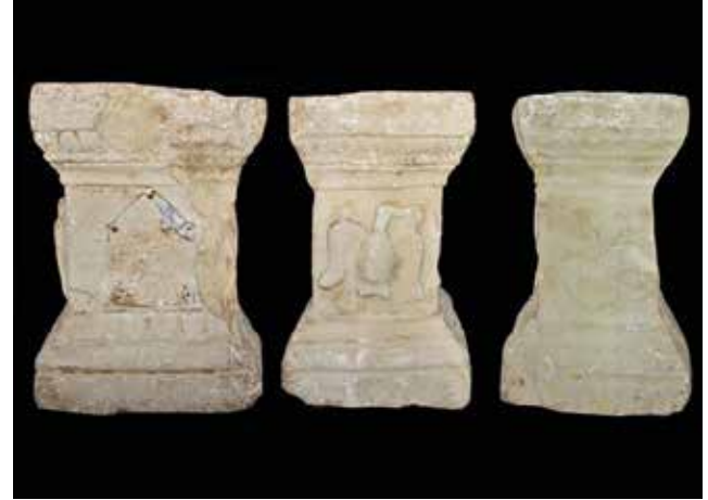
Fotoğraf 12a-12b-12c: Yazıtlı-Kurşun Levhalı Sunak, MS 122, Kandıra-Yağbolu Mağarası, Kocaeli Müzesi / Inscribed-Lead Plate, The Cave of Kandıra-Yağbolu, Kocaeli Museum

Mağaranın içerisinde bulunan diğer buluntular arasında kandiller ve defneciler tarafından çalınan, farklı eser grubuyla müzeye getirilen ve müzenin Yediemin deposunda muhafaza edilen yazıtlı bir sunakta yer almaktadır. Yapılan araştırmalar neticesinde eserin Yağbolu Mağarası'ndan çıkartıldığı anlaşılmıştır. Yerel sarı kumtaşından yapılmış adak sunağının alt ve üstü profillidir. Sunağın üç tarafı da işlenmiştir (Foto. 12a-12b-12c). Ön kısımda tapınak formunda kurşundan bir naiskos motifi levha yer almaktadır. Kurşun levhanın bazı kısımları korunabilmiştir. Sol yan yüzde ağzında yılan tutan bir kartal/şahin bulunmaktadır. Yuvarlak formu bir cisme pençeleriyle tutunan yırtıcı kuş kanatlarını iki yana doğru açmış bir vaziyette avını yakalamanın haklı gururunu yaşamaktadır. Kanatlarının iç kısmında ve gövdesinde matkap izleri mevcuttur. Sağ yan yüzde ise bir çiçek rozeti; en üstte ise ion-kymationun hemen altında da inci-boncuk dizisi motifi yer almaktadır. Bu bezeme muhtemelen sunağın dört cephesinin de üst çerçevesini oluşturmaktadır. Ancak yazıtlı ve yırtıcı kuşun olduğu cephelerde daha fazla korunabilmiştir. Çiçek rozetinin olduğu cephede neredeyse tamamen silindiğini gözlemlemekteyiz. Sunağın üstünde kenet delikleri yer almaktadır. Bu kenet delikleri sunağın aynı zamanda kaide olarak, üzerinde bir heykel taşımış olabileceğini akla getirmektedir.