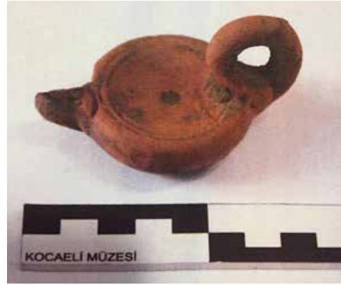
Fotoğraf 13: Diskusu Bezemesiz Kandil, Roma Dönemi / Lamp with Plain Discus, Roman Period

ve tahrip olmuştur. Bezemenin kenarında dairesel bir yağ deliği bulunmaktadır. Diskustan omuza geçişte iki adet yiv bulunmakta, yine dar olan omuz bezemesizdir. Kandilin burun kısmı basit ve yuvarlaktır. Yine burnun iç kısımlarında is izleri mevcuttur. Kulp kırıktır ve dairesel formu kaidesi bezemesizdir (Foto. 14). İki kandilin de Roma Dönemi'ne ait olduğu düşünülmektedir. Bu eserler dışında mağarada çökme sonucunda sıkışık kalmış