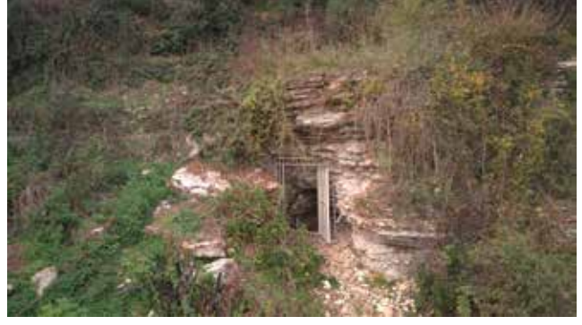
Fotoğraf 3: Yağbolu Mağara Ağız / Mouth of the Yağbolu Cave