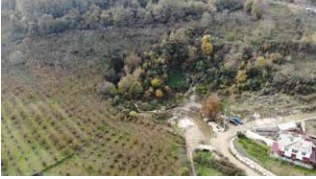
Fotoğraf 2: Yağbolu Mağarası / The Cave of Yağbolu