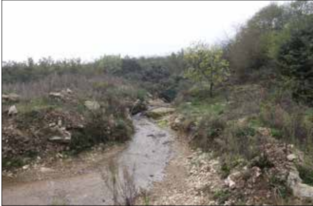
Fotoğraf 5: Mağara'nın doğusundaki dere / The Stream East of the Cave

mahallelerde yaşayan sakinlerin yakın zamana kadar içme suyunu bu mağaradan çıkan sudan karşıladığı bilinmektedir (Foto. 5). Mağaranın etrafında Yağbolu, Gebeşler ve Balaban mahalleleri arasında halk arasında “çukur” olarak tanımlanan çok sayıda dolin yer almaktadır. Bu dolinlerin bir kısmında küçük göller oluşmuştur. Bu dolinlerin ayrıca hem mağaradan çıkan suyun hem de mağara çevresinde çok sayıda gözlenen pınarın suyunun kaynağını oluşturduğu da düşünülmektedir (Ertek, 1995, s.150; Toprak, 2017, s.49).