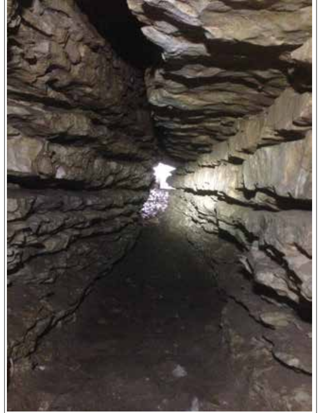
Fotoğraf 4a-4b: Mağara Koridoru (Kocaeli Müze Müdürlüğü Arşivi) / Corridor of the Cave (Archive of Kocaeli Museum Directorate)

Sarısu havzası, Karadeniz'e doğru tatlı bir eğimle yavaş yavaş alçalmakta ve kuzey güney yönlü uzanmaktadır. Sarısu Çayı'na bağlanan küçük dereler tarafından yoğun olarak aşındırılmıştır. Sarısu Çayı'nın ana kollarından biri olan Doğan çayı, kollarını oluşturan Koca Dere gibi küçük derelerle birlikte, Sarısu havzasının batı kesiminin sularını toplamaktadır. Bölgenin iklimi nemli iklimlere özgü özellikler sergilemektedir. Bitki örtüsü de bu iklim türüne göre şekillenmiştir. Gürgen ve meşe ağaçlarından oluşan nemli orman arazileri bölgede çok geniş alanlar kaplamaktadır (Uzun, 2017, s.119).