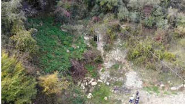
Fotoğraf 1: Yağbolu Mağarası / The Cave of Yağbolu