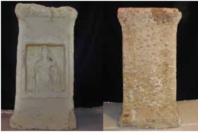
Fotoğraf 6a-6b: Kandıra Kybelesi, Roma Dönemi, Kandıra-Yağbolu Mağarası, Kocaeli Müzesi / Cybele of Kandıra, Roman Period, The Cave of Kandıra-Yağbolu, Kocaeli Museum

içerisinde gerçekleştirmişlerdir. Deneyin sonucunda dar geçitlerde ve tek geçişli alanlarda oksijen seviyelerinin çok kısa sürede %18'in altına düştüğünü ve bu seviyenin insanlarda hipoksiye ve değişen bilinç durumlarına neden olduğunu ortaya çıkarmışlardır. Hipoksi ve artan dopomin seviyeleri psikoaktif bitkiler veya diğer araçlar (davul çalma, dans etme, oruç tutma, duysal yoksunluk vb.) olmaksızın doğal olarak bilinç durumlarının değişmesini tetiklemektedir (Kedar vd., 2021, s.2-3). Bu nedenlerle Ana Tanrıça Kybele'nin gizli kült törenlerinde dansın ve müziğin de etkisiyle rahiplerin kendilerinden geçip, kendilerini hadım ettikleri ortamın mağara ya da mağara yakınlarında olması şaşırtıcı değildir.