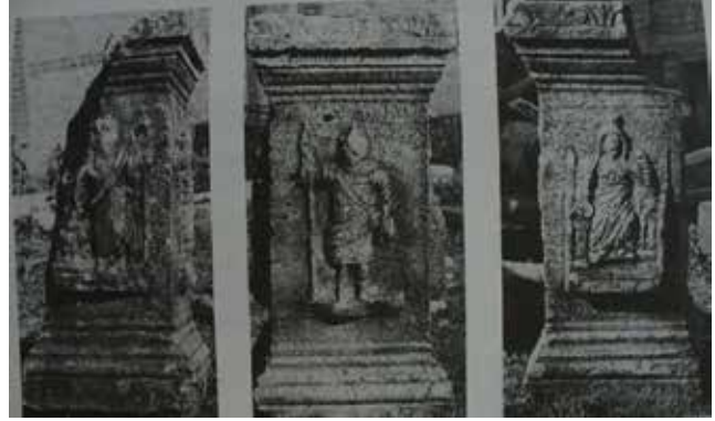
Fotoğraf 8: Kybele'ye Adanmış Sunak, MS 155-156, Kocaeli-Deli Mahmutlar (Vermaseren 1987: Pl. XLVII; fig. 239) / An Altar Dedicated to Cybele, 155-156 AD Mahmutlar (Vermaseren 1987: Lev. XLVII, fig. 239)

Kandıra Kybelesi oldukça yerel bir çalışma olduğunu göstermektedir. Eserde aslan, tahtın koluna kadar yükselmeyen ufak bir sunağın/kaidenin üzerinde karşı tarafa bakar bir şekilde sağrıları üzerinde oturmaktadır. Aslanın sunak üzerinde oturduğu örnekler mevcuttur. Bunlardan birisi Bithynia Bölgesi sınırları içerisinde bulunan Prusias ad Olympium/Bursa-Tahtalı Köyü'nde bulunmuş olan mermer bir stel üzerindeki Kybele kabartmasıdır (Foto. 7a-7b). Stelin üzerinde Kybele tapınak naiskosu içerisinde taburesi olan bir tahta oturmaktadır. Başında polos ve örtüsü ile bir khiton ve hymation giymektedir. Tanrıça sağ elini kucağına koymuş, sol eliyle de örtüsünü tutmaktadır. Solunda bir kaide/sunak üzerinde yönü Kybele'ye bakan bir aslan oturmaktadır. Sunağın gövdesinde ayakta duran bir hayvan (boğa ya da koç) ön ayakları arasında bir şey tutarken tasvir edilmiştir. Stelin alt kısmında bir yazıt da mevcuttur. Stel, Bursa Arkeoloji Müzesi'nde korunmaktadır (Vermaseren, 1987, s.82). Aslanın duruş pozisyonuna benzer bir diğer örnek ise yine Bithynia