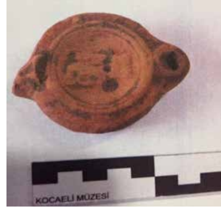
Fotoğraf 14: Diskusu Bezemeli Kandil, Roma Dönemi / Lamp with Decorated Discus, Roman Period