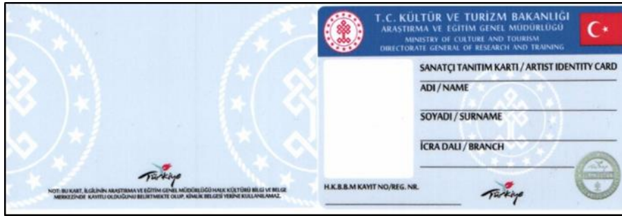
Görsel 1. Sanatçı tanıtma kartı

Bakanlığın düzenlediği Sanatçı Tanıtma Kartı (Görsel 1) ise Bakanlık Makamının 24/04/2014 tarihli onayıyla yürürlüğe giren “Somut Olmayan Kültürel Miras Taşıyıcılarının Tespit ve Kayıt İşlemlerine İlişkin Yönerge” çerçevesinde başvurulara verilmektedir. Bu yönergenin amaç başlıklı 1. maddesi şu şekildedir: “Bu Yönergenin amacı, somut olmayan kültürel miras taşıyıcılarının tespiti, değerlendirilmesi, belirli ölçütlere sahip olanların Halk Kültürü Bilgi ve Belge Merkezine kayıt edilmesi, üretimlerinin teşvik edilmesi ile geleneksel kültürün yaşatılmasına ilişkin usul ve esasları düzenlemektir.”