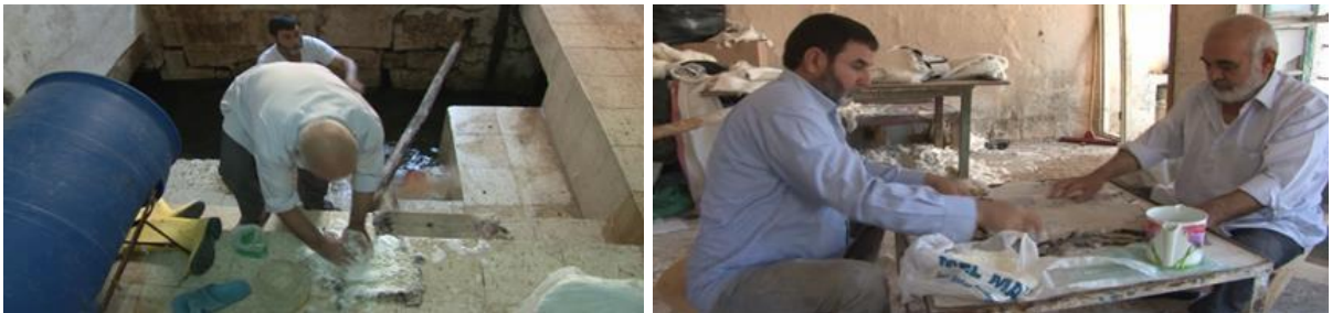
Görsel 4. Bir gün önce havuzda bekletilen derilerin krem deterjanla yıkama işlemi

Kürk yapılırken tımar, biçme-dikme ve üzleme (yüzleme) işlemi olmak üzere üç işlemden geçmektedir. Koyun, kuzu ve keçi derileri tuzlanmış ve kurutulmuş olarak satın alınır. Yakın zamana kadar yıkama işlemi, Debbaghâne Çarşısı civarında yer alan ve içerisinden Balıklı Göl'ün suyunun aktığı "Kelleci Çayı" denilen iki çayda yapılırdı. Son zamanlarda gerek Balıklı Göl suyunun azalması ve gerekse çaya kanalizasyon sularının karışması, burayı kullanılmaz hale getirmiştir. Günümüzde her esnaf, yıkama işlemini kendi evindeki özel havuzlarda yapmaktadır (Görsel 4). Deriler yıkandıktan sonra, asılarak süzülür ve üzerlerindeki artık etler "Kazak" denilen bir aletle alınır. Deri kısmına tuz ve "Şeb" (şap) karışımı sürülür. Buna "Şebleme Tımar" denilmektedir. Bundan sonra deri "Pişme payı" denilen 24 saat süreyle dinlendirilmeye alınır (Görsel 5).