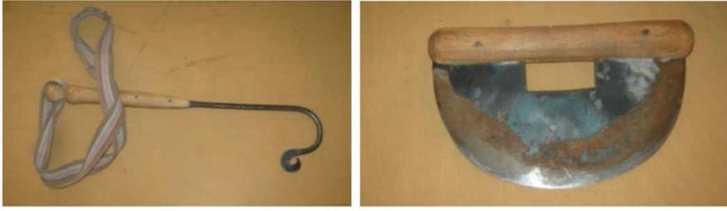
Görsel 2. Doğunluk