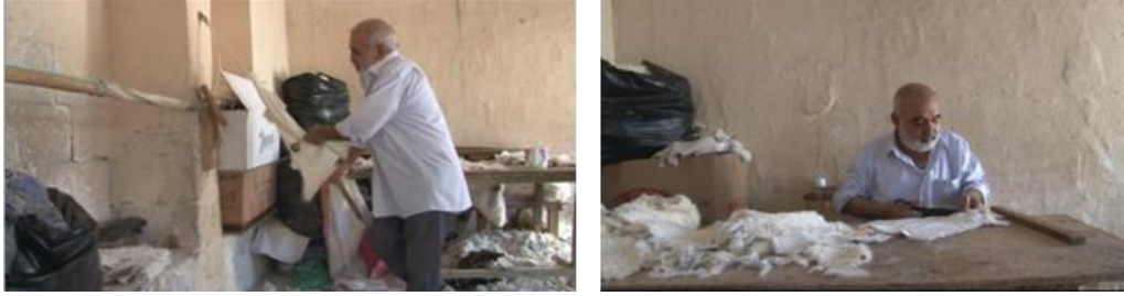
Görsel 8. Doğunluk denilen aletle deriyi yumuşatma

Bu aşamada derinin yüzü sert bir şekildedir. Deri uç kısmından doğunlanıp kendirle bağlanarak, duvar halkasına tutturulur. “Doğunluk” denilen, el ve ayakla çalışan bir aletle “yumuşatma-cilalama” işlemi yapılır (Görsel 8). Bıçkı işlemi (boy kesme) özel deri makası ile yapılır. Bu makasın en önemli özelliği deriyi keserken tüyleri kesmemesidir. Böylece yan yana dikilen derilerin tüylü kısımlarından bakıldığında dikiş izi görünmez (Görsel 9).