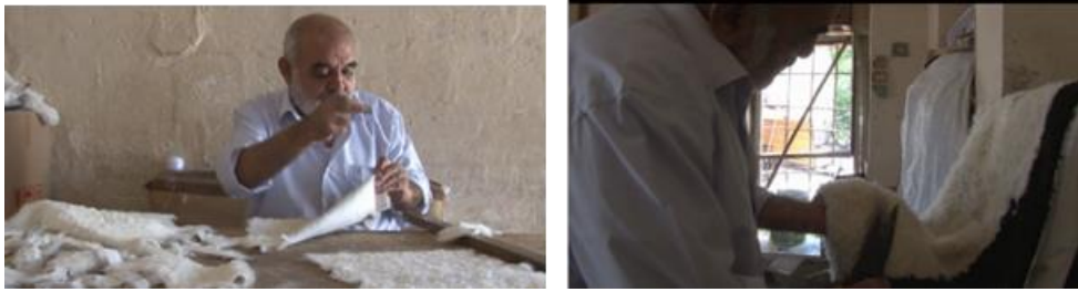
Görsel 10. Düzgün bir şekilde kesilen deri parçalarının birbirine dikilmesi, çatma işlemi