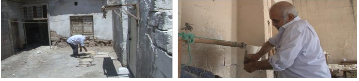
Görsel 6. Derilerin güneşte kurumaya bırakılması