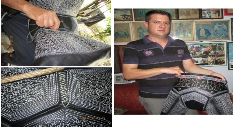
Görsel 19. Kispetin bitmiş hali