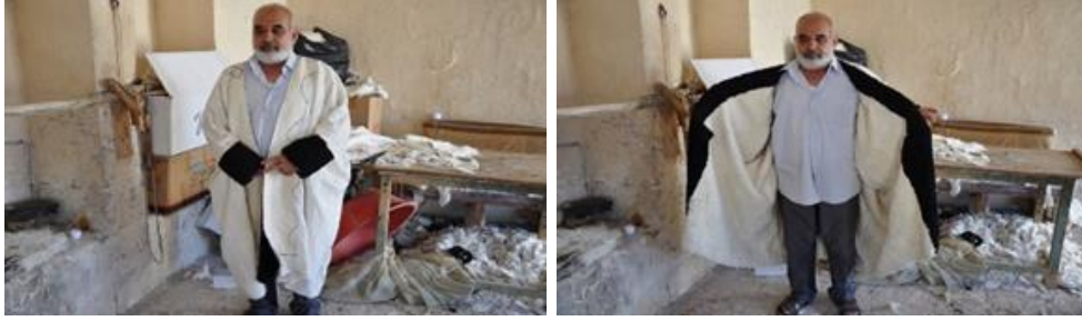
Görsel 12. Kürk dış görünüm Görsel 13. Kürk iç görünüm

satın alan kişiler terziye götürerek “şakaf” denilen siyah renkli özel kürk kumaşıyla dıştan kaplattırırılar. Buna üzleme denilmektedir. Böylece “kürk” denilen geleneksel kışlık giysi tamamlanmış ve kullanıma hazır olmuştur (Görsel 12, 13).