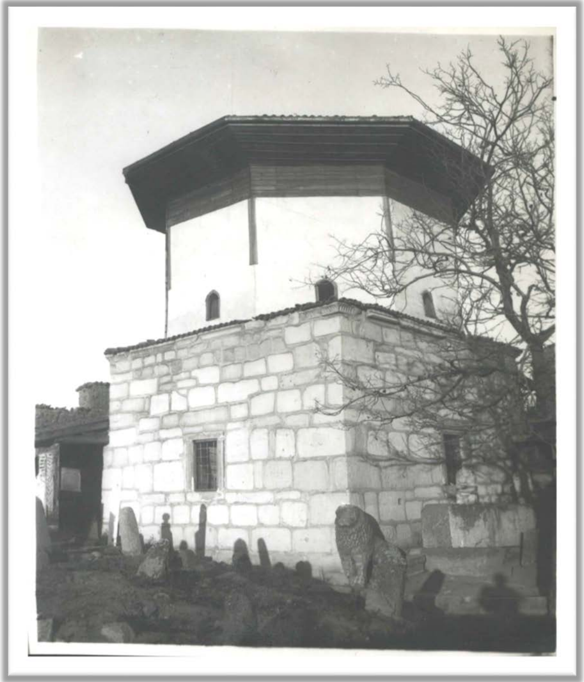
EK-4: TTK Arşivi, Osman Ferit Sağlam Koleksiyonu, Dosya No:67 Belge 9-1. Ankara: Ahi Şerefeddin Türbesi dışarıdan görünüşü.