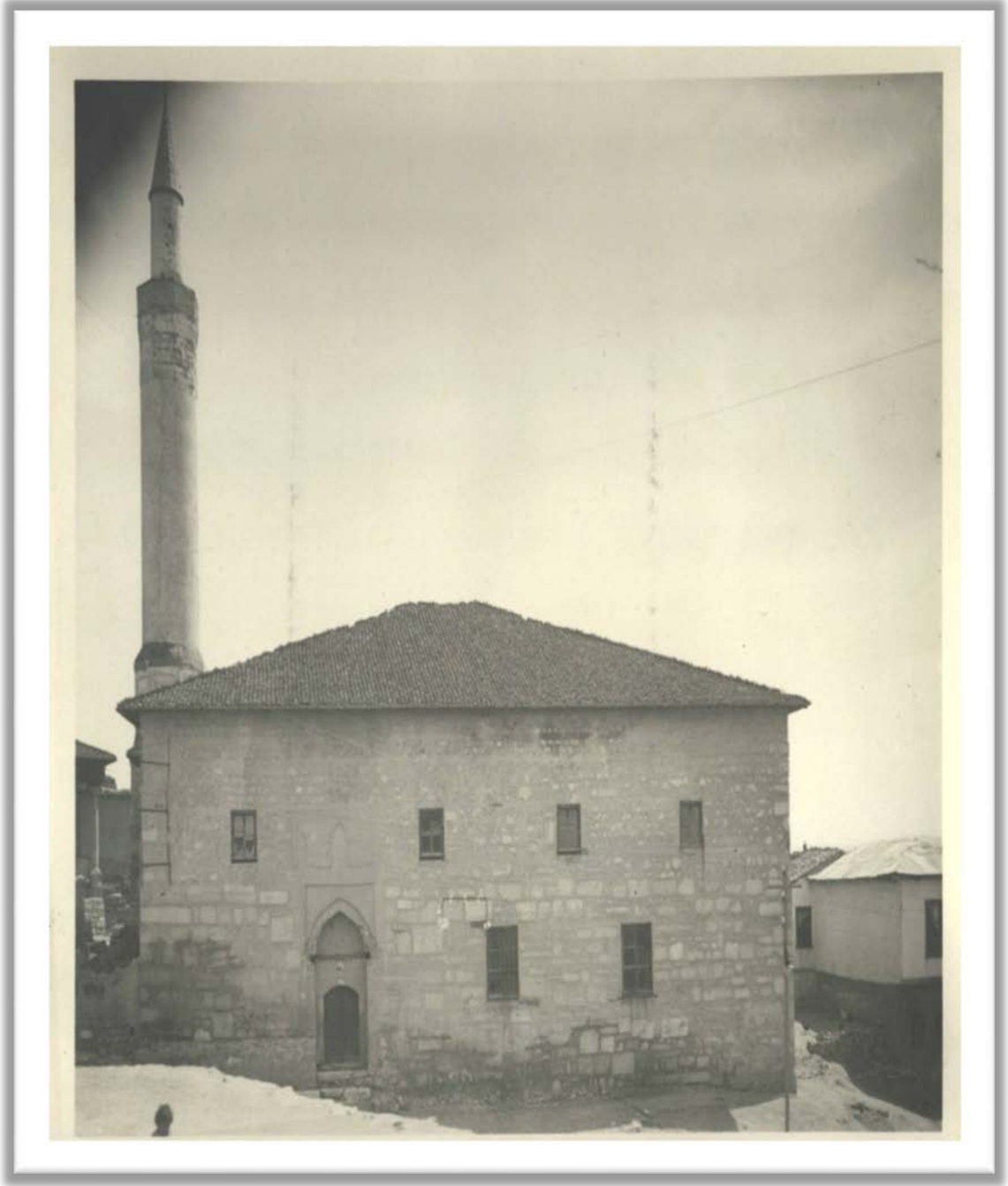
EK-1: TTK Arşivi, Osman Ferit Sağlam Koleksiyonu, Dosya No:67 Belge 8-1.