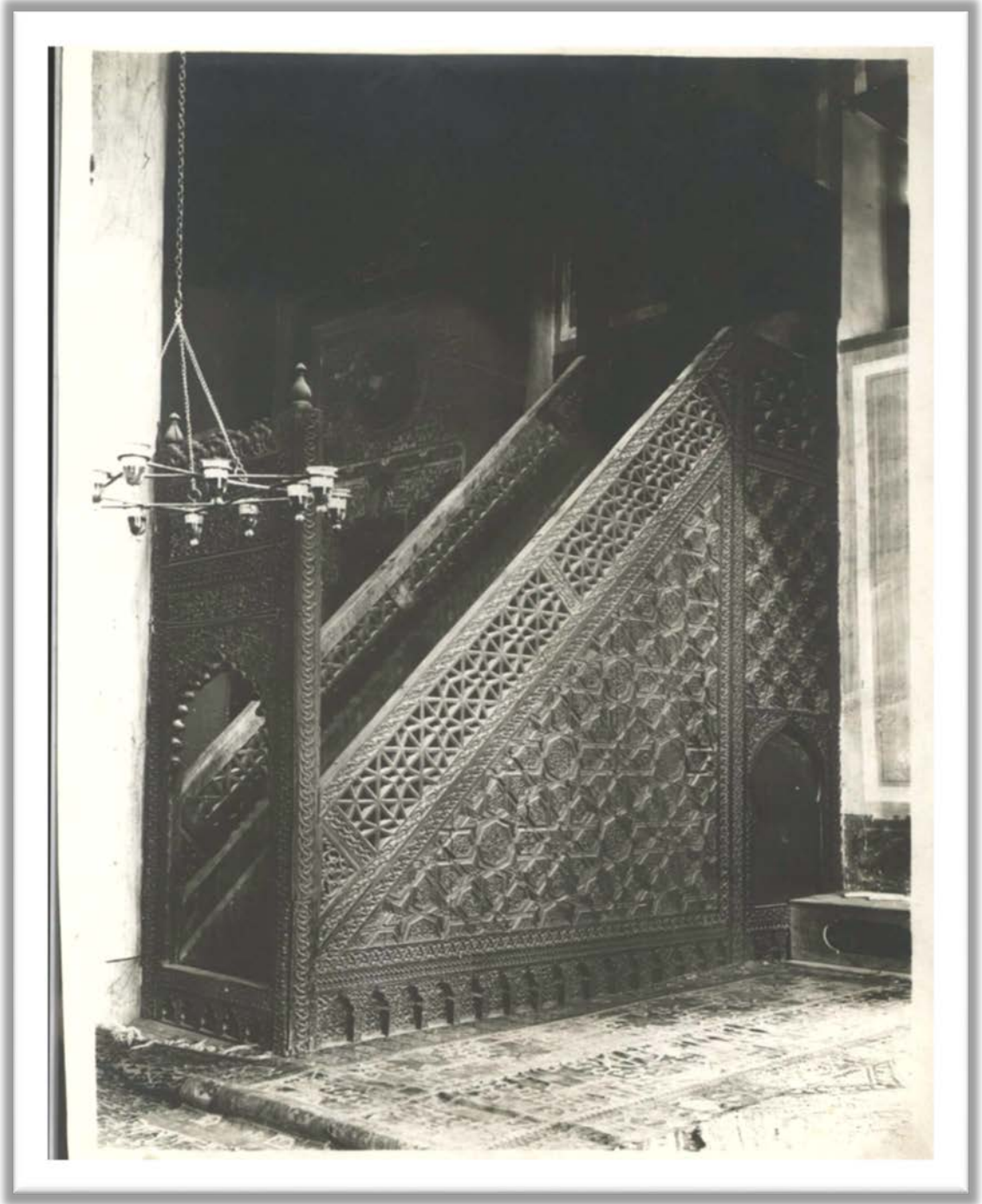
EK-2: TTK Arşivi, Osman Ferit Sağlam Koleksiyonu, Dosya No:67 Belge 8-6.