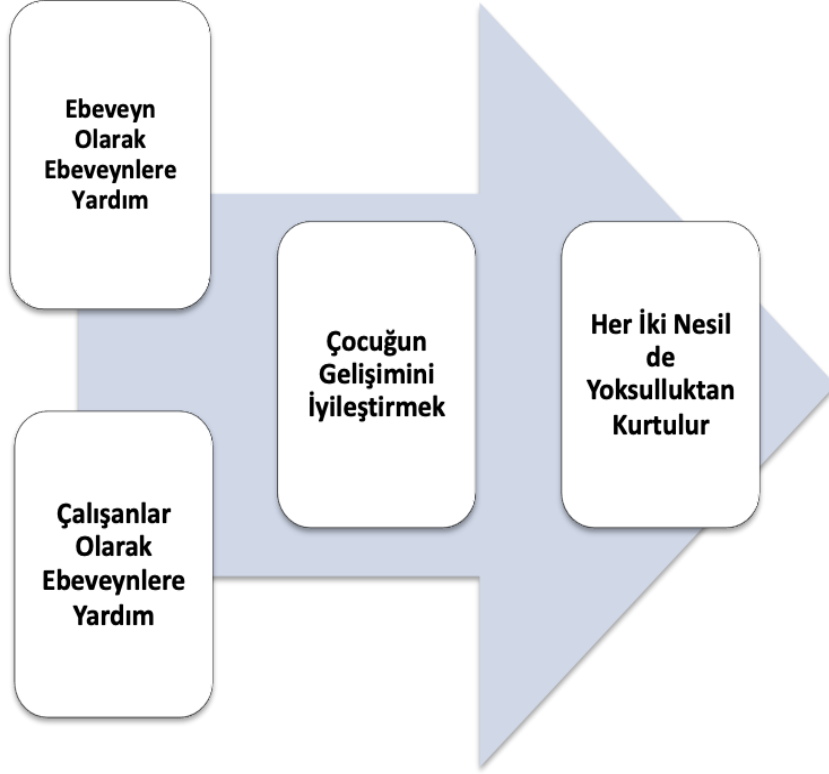
Tablo 2: İki Nesil Yaklaşımı

Kaynak: Schmit S, Matthews H, Golden O. Thriving children, successful parents: a two-generation approach to policy. CLASP Policy Solutions; July 9, 2014.