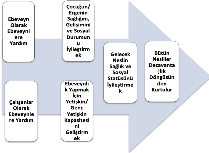
Tablo 3: Üç Nesil Yaklaşımı

Kaynak: Cheng, T. L., Johnson: B., ve Goodman, E. (2016). Breaking the Intergenerational Cycle of Disadvantage: The Three Generation Approach. Pediatrics Volume 137 , Number 6: 1-12.