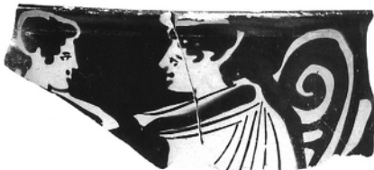
Abb. 11. Moskau M-683 (Nach: Tugusheva 2003, Pl. 69, 6)

dargestellt 10 [Abb. 1-2]. Der kopfüber gestellte “V”-förmige untere Saum der von diesen Jünglingen getragenen Himatia und der Punkt unmittelbar darunter sind auf den anderen Vasen des Malers bei allen Figuren wiederholt und somit ein charakteristisches Merkmal des Kalygnos-Malers 11 . Dieses bestimmende Merkmal, wenn auch viel schematischer, ist