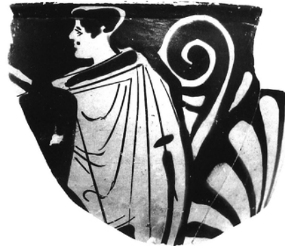
Abb. 10. Moskau M-649 (Nach: Tugusheva 2003, Pl. 69, 5)