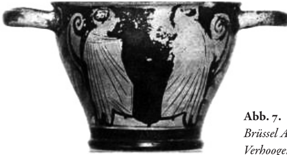
Abb. 7. Brüssel A 1729 (Nach: Mayence – Verhoogen 1949, (III I e) Pl. 4, 10)