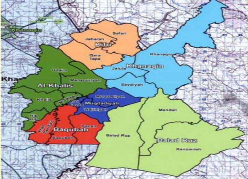
Ek: 1 Türkmeneli Haritasında ve Irak Haritasında Hanekin (Khanagiq) Orsam Rapor, Irak'ta İhtilafli Bölgelerin Durumu, Rapor No: 92, Aralık 2011, s. 19.

https://www.deviantart.com/turkmennetwork/art/TURKMENELI-216332728