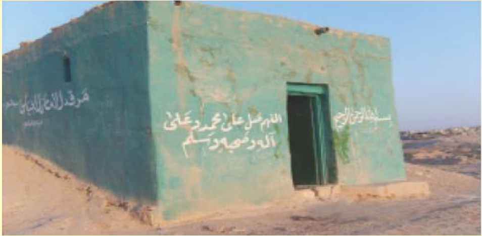
Ek: 6 İmam Abbas Makamı