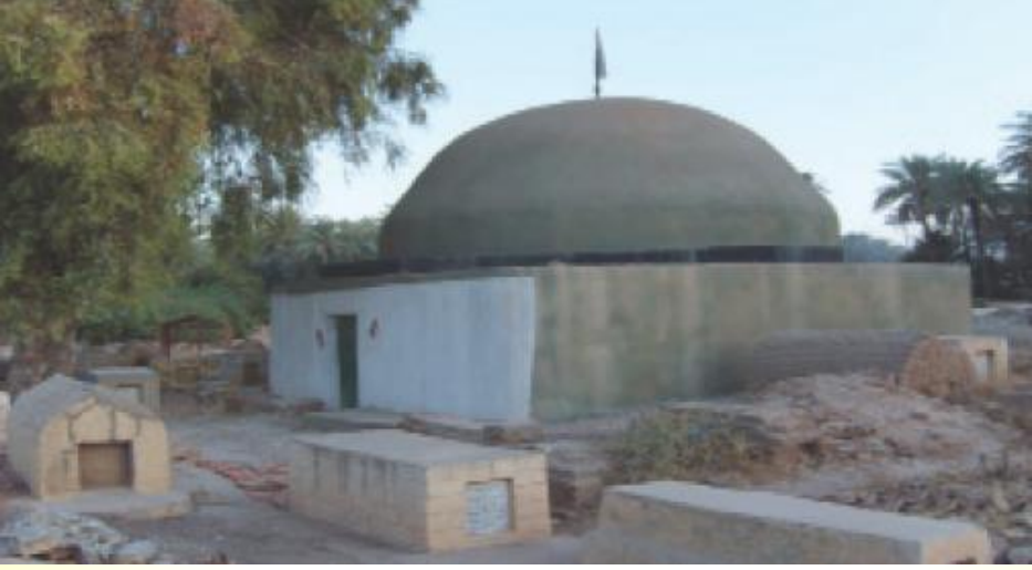
Ek: 7 Alemdar Makamı