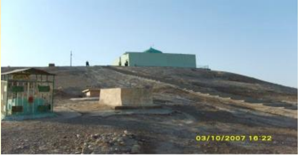
Ek: 5 Baba Mahmut Yatırı