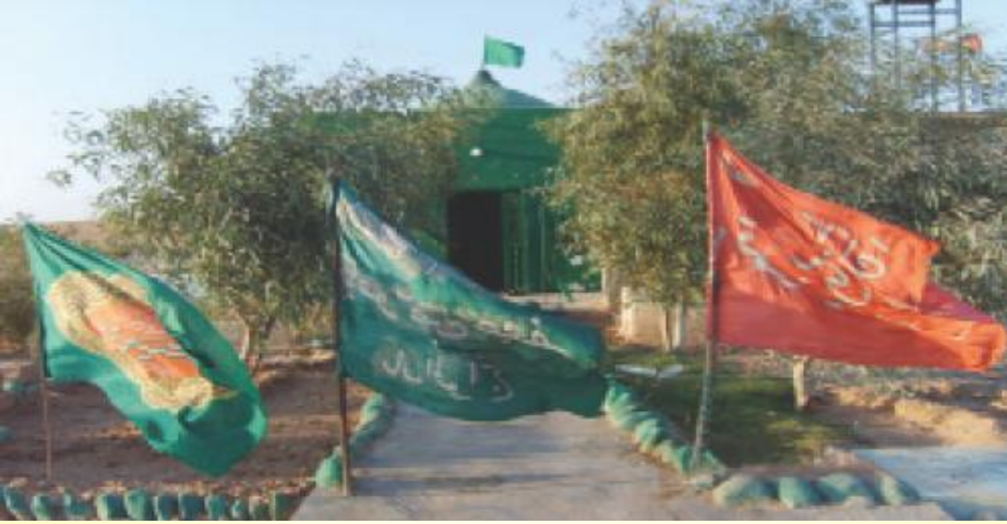
Ek: 8 Hıdırellez “Xıdırzında” Makamı

BAYATLI, Nejdet Yaşar “Irak-Diyale İlinin Hanekin İlçesinde Ziyaret Yerleri (Kutsal Mekânlar) Ve Bu Yerler Etrafında Oluşan İnanç Ve Pratiklerde Eski Türk İnançlarının İzleri” Türk Kültürü Ve Hacı Bektaş Veli Araştırma Dergisi / 2010 / 56, s.117.