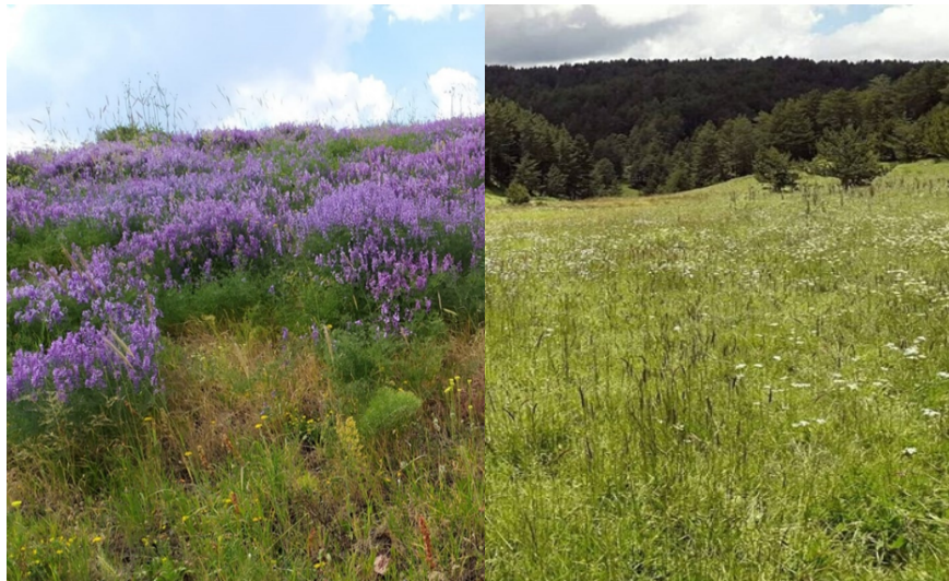
Fotoğraf 2: Araştırma sahamızda yaygın olan floristik zenginlikten bir görünüm

Son zamanlarda kentsel odaklı büyümenin yaygınlaşması ile beraber kırsal bölgelerde nüfusun hızla azaldığı ve sosyo-ekonomik yapının zarar gördüğü düşüncesi yoğunluk kazanmıştır. Nüfus kaybetmeye başlayan Refahiye ilçesinde de temel geçim kaynağı olan tarım ve hayvancılık makineleşme ve maliyetinin artmasına bağlı olarak eskiye oranla hızla azalmış ancak yerini bal üretimi almıştır. Bal üretiminin maliyetine göre kazancının yüksek olması, hobi olarak yapılabilmesi gibi pek çok avantajının olması kişilere cazip gelmektedir. Özellikle kırsal bölgelerde giderinin az olması ve bitki örtüsünün elverişli olması gibi sebeplerle tercih edilen arıcılık faaliyeti bölgenin kalkınmasında önemli bir yer tutmaktadır. Bu nedenle ilçede arıcılık faaliyeti ile uğraşan aile sayısı fazladır.