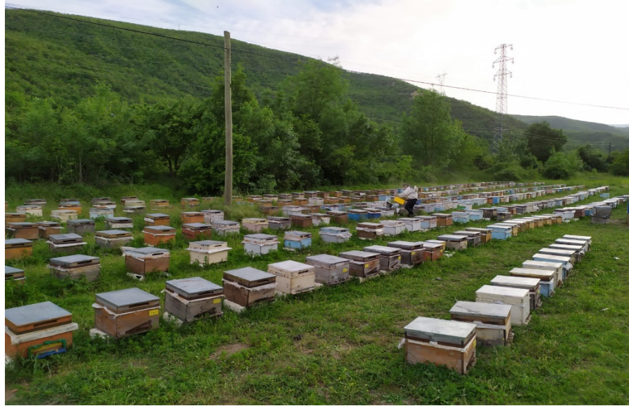
Fotoğraf 1: Araştırma sahasında arıcılık yapılan bölgeden bir görünüm

Refahiye ilçesinde hem Karadeniz hem de Doğu Anadolu ikliminin görülmesinden dolayı ilçede bitki örtüsü de çeşitlilik göstermektedir. İlçede belli bir yüksekliğe kadar step bitki örtüsü mevcut iken daha yüksek kesimlerde ormanlar mevcuttur. Arıcılığın verimli bir şekilde yapılabilmesi için bitki örtüsünün çeşitli olması önemlidir. Refahiye'nin de bu konuda zengin bitki örtüsüne sahip olması arıcılığın veriminin artmasında önemli bir etkidir. İlçede ilkbahar mevsiminde çiçek açan bitkiler yaz mevsiminin ortalarına kadar yeşilliğini koruyabildikleri için çeşitli türleri içinde barındıran floristik zenginliğe sahiptir (Fotoğraf 2). Yaygın olarak görülen bitki türleri; geven, yemlik otu, gelincik, kekik vb. bitkiler yaygındır. (Şahin,1997: 87).