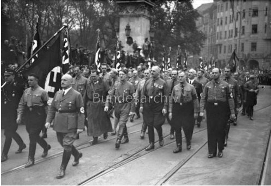
August 1935