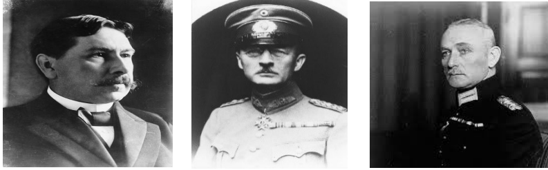
Fotoğraf 2: Triumvirat; (soldan sağa) Gustav v. Kahr, Otto v. Lossow ve Hans v. Seißer'e ait fotoğraflar. 16