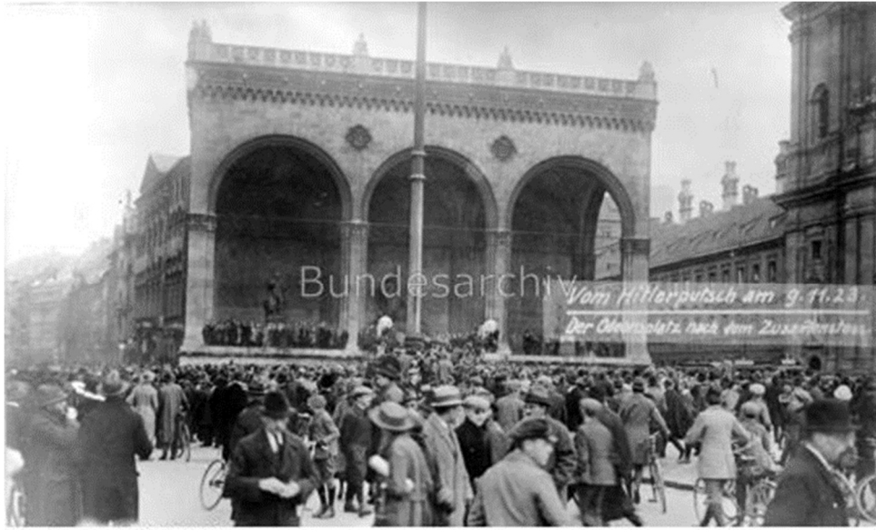
9. November 1923

kitlesel saldırıları durdurmak için birçok kez müdahale etmek zorunda kaldı. “Ülkede en nefret edilen adam” ilan edilen Kahr 20 ve Lossow’un Şubat 1924’te emekliye ayrılması ile birlikte Bavyera’daki aşırılık dönemi ve sağ cenahtan gelebilecek olası darbe tehlikesi de sona erdi (Kluge, 2006: s. 80).