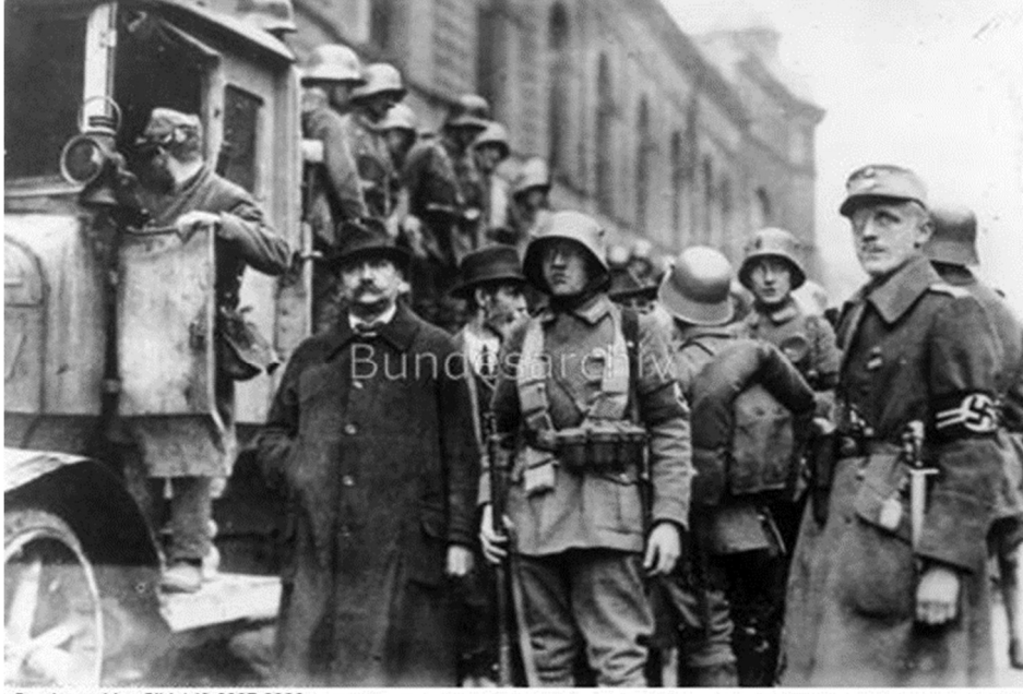
9. November 1923

Fotoğraf 3: NSDAP Hücum Birlikleri'nin (SA) 9 Kasım sabahı Eyalet Meclisi üyelerini tutuklarken (Bild 146 - Sammlung von Repro-Negativen, Bild 146-2007-0003).