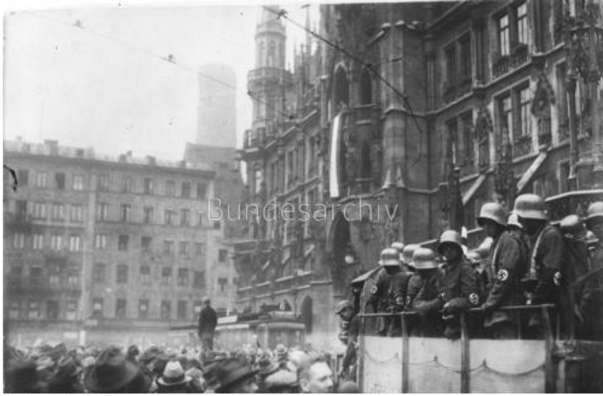
9. November 1923

üzerine darbecilerle polis arasında silahlı çatışma başladı. Bunun üzerine polis güçleri, geri çekilen kalabalığa ateş açtı. Kısa bir çatışmanın ardından Odeonsplatz'da 16 darbeci, dört polis memuru ve yoldan geçen bir sivil hayatını kaybetti, onlarca kişi de yaralandı. Darbeciler hızla dağıldı; Hitler de dâhil olmak üzere birçoğu kaçmayı başarırken Ludendorff ve Kampfbund'a mensup 20 kişi tutuklandı. Böylece Seißer yönetimindeki Bavyera Eyalet Polisi Feldherrnhalle'deki darbe girişimini önlemiş ve 17 saat bile sürmeyen Hitler darbesini başarısızlığa mahkum etmişti. (Gordon, 1978: s. 281-327).