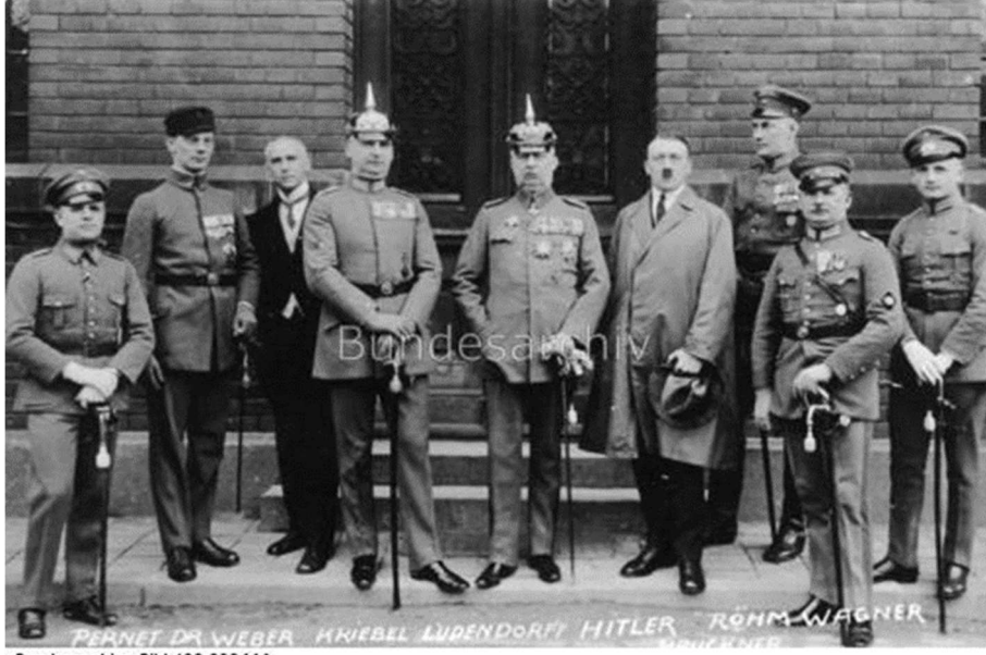
1. April 1924