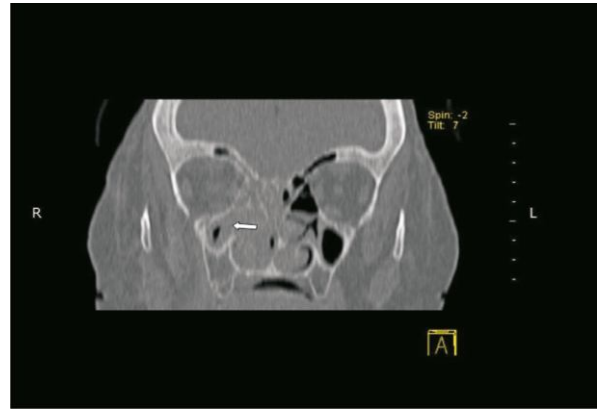
Şekil 2. Beyaz ok: sağ maksiller sinüste, medial duvarı erode eden yumuşak doku dansitesi

Ağız muayenesinde damakta nekrotik beyaz akıntılı ülseratif bir lezyon görüldü. Hasta mukormikoz ve sepsis ön tanısı ile servise yatırıldı. Hastanın kan kültürü alınarak ampirik olarak imipenem 2 gr/gün ve amfoterasin B (1mgr/kg/gün) başlandı. Hastanın ilk başvurusunda alınan göz sürüntüsünde, metilen mavisi boyamasında septasız mantar hifaları saptandı. Hastanın laboratuvar bulgusu olarak; hiperglisemi (kan şekeri 220 mg/dl), lökositoz (%90 parçalı hakimiyeti olarak 26.500/mm 3 ), CRP (136 mg/L) ve sedimantasyon (105 mm/h) yüksekliği dışında başka bir patolojik bulgusu yoktu. Olgunun kan şekeri regülasyonu düzenlendi. Hastanın radyolojik olarak paranazal sinüs ve beyin bilgisayar tomografisinde (BT) sağ maksiler sinüste, maksiler sinüs medial duvarını erode eden yumuşak doku kitlesine, sağda etmoid hücreler ve frontal/sfenoid sinüste yumuşak doku dansitesi saptandı. Ayrıca preseptal alanda kalınlık ve dansite artışı izlendi (Şekil 2).