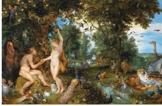
Görüntü 2. Jan Brueghel the Elder ve Peter Paul Rubens, “İnsanın Düşüşü, Adem ile Havva Aden Bahçesinde”, 74,3 x114,7 cm, Tuval üzerine yağlıboya, 1615, Maurithuis Kraliyet Resim Galerisi.