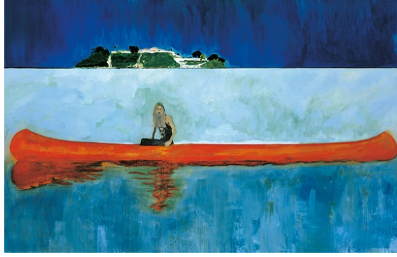
Görüntü 15. Peter Doig, “100 Yıl Önce”, 229 x 359 cm, Tuval Üzerine Yağlıboya, 2001, Centre Pompidou Ulusal Modern Sanat Müzesi, Paris.

Zaman olgusunun ve tarihsel sürecin etkisiyle birlikte; uzam da maddenin yapısındaki bulunan özelliklerden dolayı sürekli değişme sürecine maruz kalan kavramlardır. Ütopik yazın ve görsel sanatlarda yazarın, sanatçının tanımlamaya çalıştığı toplum ise en iyi, eksiksiz yaşama düzeniyle, değişime, her türlü dış etkiye kapalı kesinlikte bir örnek toplum, modeldir. Bundan dolayı, ada metaforu ütopycı anlatılar için mükemmel bir mekân biçimidir. Bu bağlamda, dışarıya kapalı ada (Görüntü 15 ve 16) olgusu Platon’dan beri toplumsal ütopycalar için en uygun mekân olarak düşünülmüştür (Göktürk, 1982, 17). Bu olgunun genel adlandırılmış biçimi olarak Utopia / Eutopia adası hiçbir yerin ve mutluluğun ülkesidir. Ütopik söylemler aynı zamanda bir U-chronie bir süreçle tarihi durdurur ve zamansızlık ruhu taşır. Bu bağlamda düşsel olan bu hiçbir yer ve güzel yer Yeni Dünya ile Eski Zamanları birleştiren metaforik mekânlardır (Mattelart, 2005, 29).