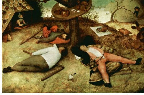
Görüntü 11. Pieter Bruegel the Elder, “The Land of Cockaigne, Gençlik Ülkesi”, 52 x 78 cm, Ahşap panel üzerine yağlıboya, 1567, Alte Pinakothek, Münih.

hertürlü yiyeceklerin en iyisi bulunur, emek sarfedilmeden pişirilmiş ve hazırlanmış türlü türlü yiyecekler bulunur; insanlar yattıkları yerden zahmetsizce bu nimetlerin keyfini yaşarlar (Göktürk, 1982, 24).