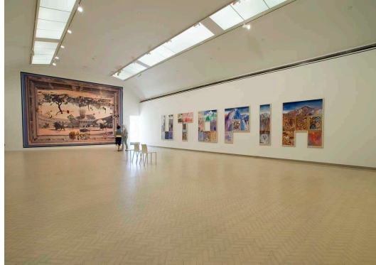
Görüntü 14. Juan Davila, “Utopia”, Sergi Alanından Yerleştirme Görünümü, Muhtelif Ebatlarda Tuval Üzerine Yağlıboya, 1998, Avusturalya Çağdaş Sanatlar Müzesi, Sidney.