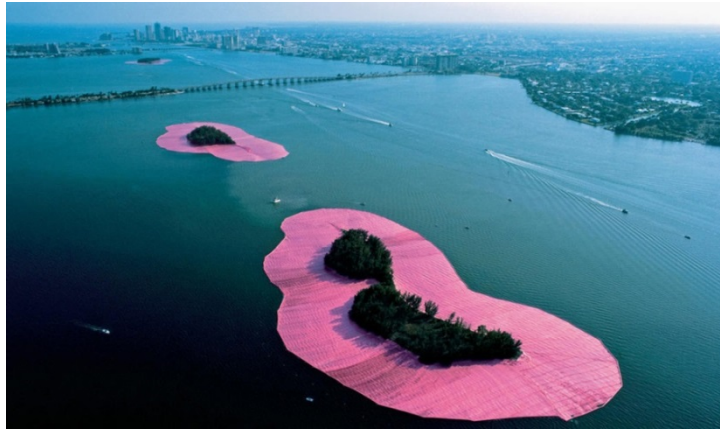
Görüntü 16. Christo ve Jeanne-Claude, Çevrelenmiş Adalar, Çevresel Sanat Projesi Biscayne Koyu, Greater Miami Florida, 1980-1983.

Zaman olgusunun ve tarihsel sürecin etkisiyle birlikte; uzam da maddenin yapısındaki bulunan özelliklerden dolayı sürekli değişme sürecine maruz kalan kavramlardır. Ütopik yazın ve görsel sanatlarda yazarın, sanatçının tanımlamaya çalıştığı toplum ise en iyi, eksiksiz yaşama düzeniyle, değişime, her türlü dış etkiye kapalı kesinlikte bir örnek toplum, modeldir. Bundan dolayı, ada metaforu ütopycı anlatılar için mükemmel bir mekân biçimidir. Bu bağlamda, dışarıya kapalı ada (Görüntü 15 ve 16) olgusu Platon’dan beri toplumsal ütopycalar için en uygun mekân olarak düşünülmüştür (Göktürk, 1982, 17). Bu olgunun genel adlandırılmış biçimi olarak Utopia / Eutopia adası hiçbir yerin ve mutluluğun ülkesidir. Ütopik söylemler aynı zamanda bir U-chronie bir süreçle tarihi durdurur ve zamansızlık ruhu taşır. Bu bağlamda düşsel olan bu hiçbir yer ve güzel yer Yeni Dünya ile Eski Zamanları birleştiren metaforik mekânlardır (Mattelart, 2005, 29).