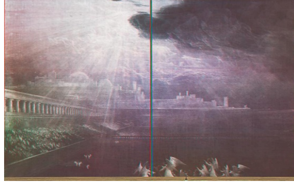
Görüntü 1. R. H. Quaytman, “Sürgün, Bölümler 20”, 82,2 x 133 cm, Ahşap üzerine yağlıboya, serigrafî ve gesso, 2010, Miguel Abreu Galerisi, New York.