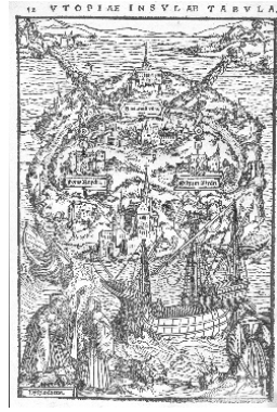
Görüntü 13. Ambrosius Holbein, “Utopiae Insulae Tabula- Ütopya Haritası”, 17,9 x 11,9 cm, Ahşap Gravür Baskı, 1518, Nadir Kitap ve Belgeler Bölümü, Princeton Üniversitesi Kütüphanesi.