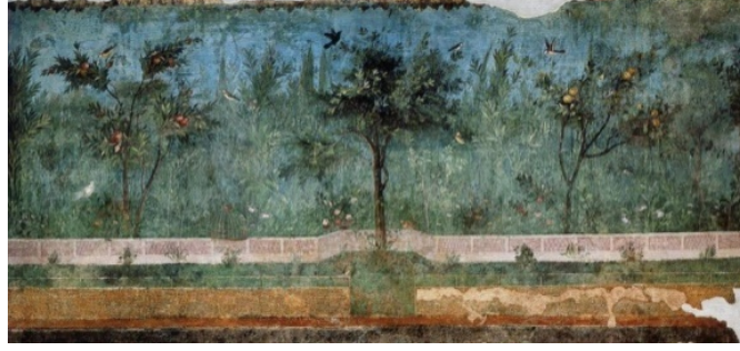
“Bahar Uygarlığı Bölgesinden Fresk, M.Ö. Cyclades, Stokstad, 1999,